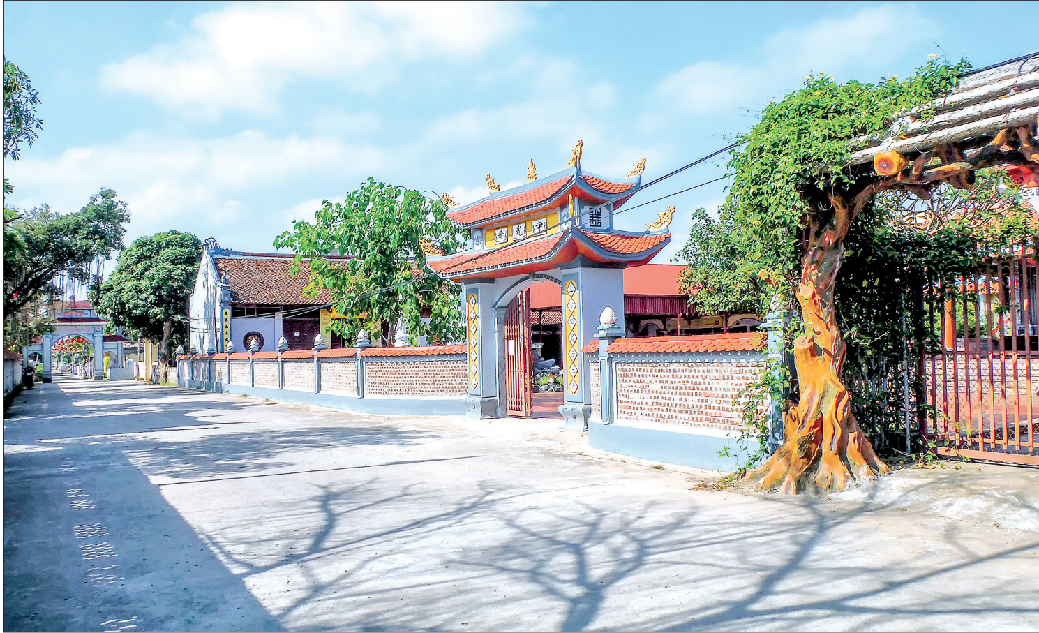
Chùa Địa, thôn Việt Thắng, xã Hồng An, huyện Hưng Hà xây dựng năm 1238, mới được trùng tu, đây là phủ lý Ngự Thiên thời nhà Trần cách khu lăng mộ vua Trần khoảng 2km.

Đầu thế kỷ XIII, nhà Trần thay thế nhà Lý nhanh chóng khôi phục nền kinh tế vốn đã kiệt quệ vì vua Lý mai mê sa đọa để dân đói triền miên, giặc dã đe dọa biên cương, nhà nước tập quyền gồng mình chống đỡ, đưa đất nước dần vào thế ổn định.