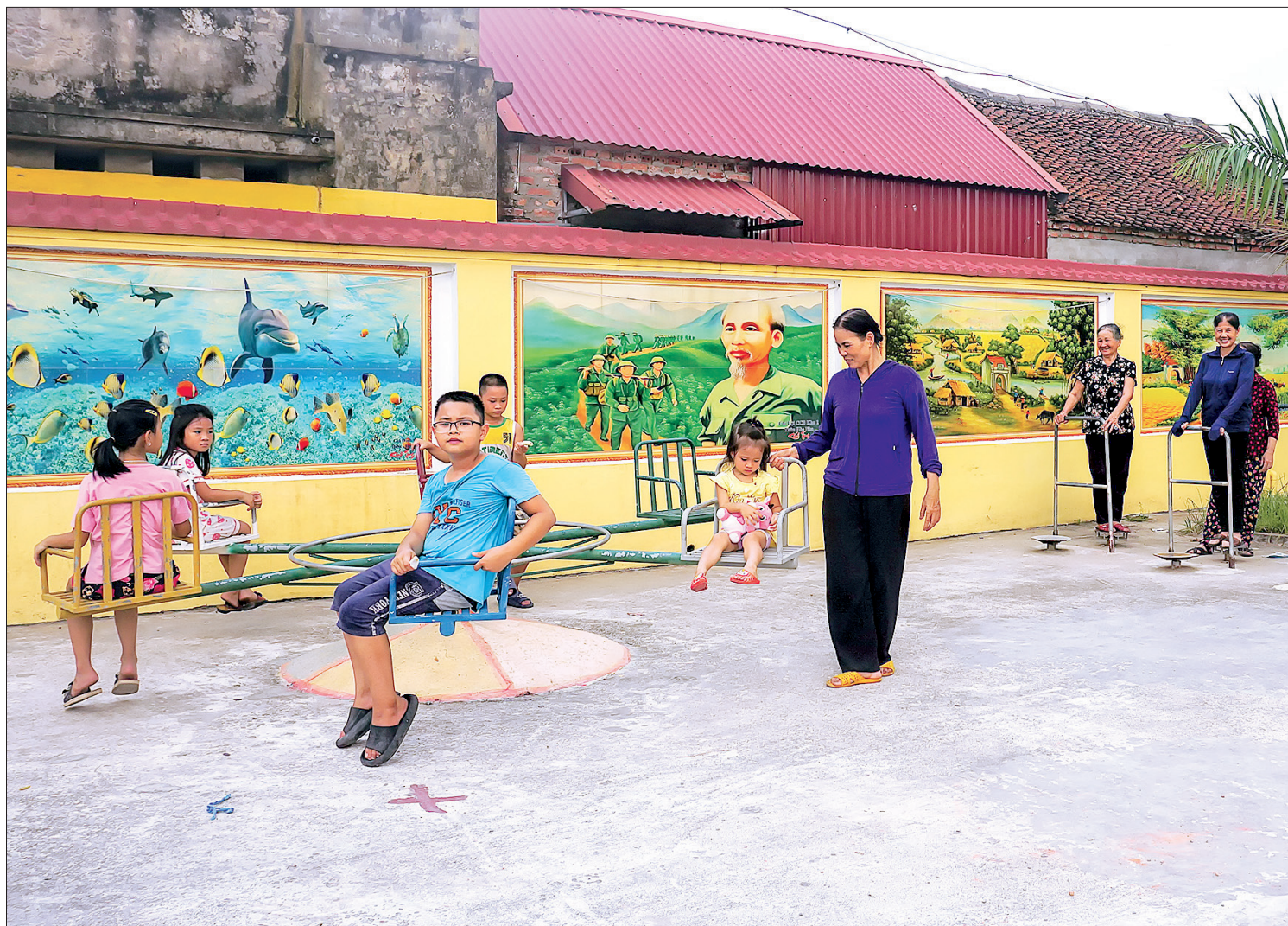
Nhà văn hóa dân hoàn thiện, người lớn có chỗ tập thể dục thể thao, trẻ nhỏ có nơi vui chơi.

Sau thành công từ mô hình nhà văn hóa khu dân cư kiểu mẫu đầu tiên tại thôn Bích Du, xã Thái Thượng, nhiều địa phương khác trong huyện Thái Thụy cũng tích cực đầu tư xây dựng thiết chế văn hóa này. Huyện Thái Thụy phấn đấu đến cuối năm 2021 có 36 nhà văn hóa khu dân cư kiểu mẫu tại các xã, thị trấn.