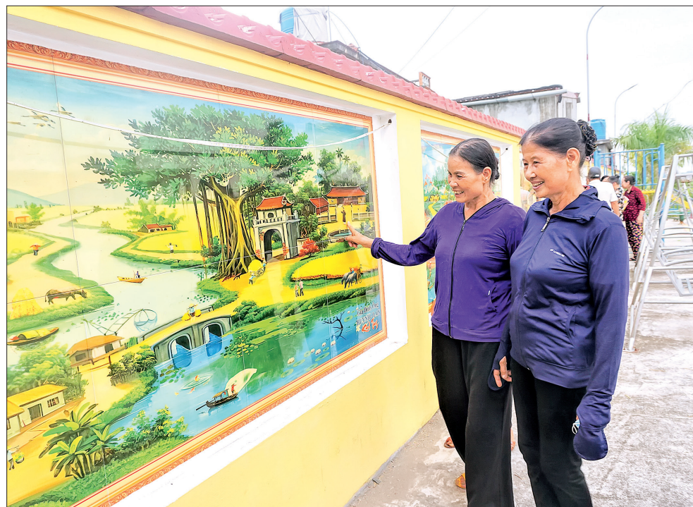
Người dân xã Thụy Chính (Thái Thụy) bên những bức tranh gạch khổ lớn tại nhà văn hóa khu dân cư kiểu mẫu thôn Hòe Nha.

tinh thần của xã hội, là động lực thúc đẩy các nhiệm vụ khác của địa phương phát triển. Do đó, việc nâng cao chất lượng cuộc sống của người dân là nhiệm vụ Đảng ủy xã đã xây dựng sau khi địa phương về đích nông thôn mới nâng cao, hướng tới hoàn thiện các tiêu chí nông thôn mới kiểu mẫu. Sau khi Ban Thường vụ Huyện ủy Thái Thụy ban hành Nghị