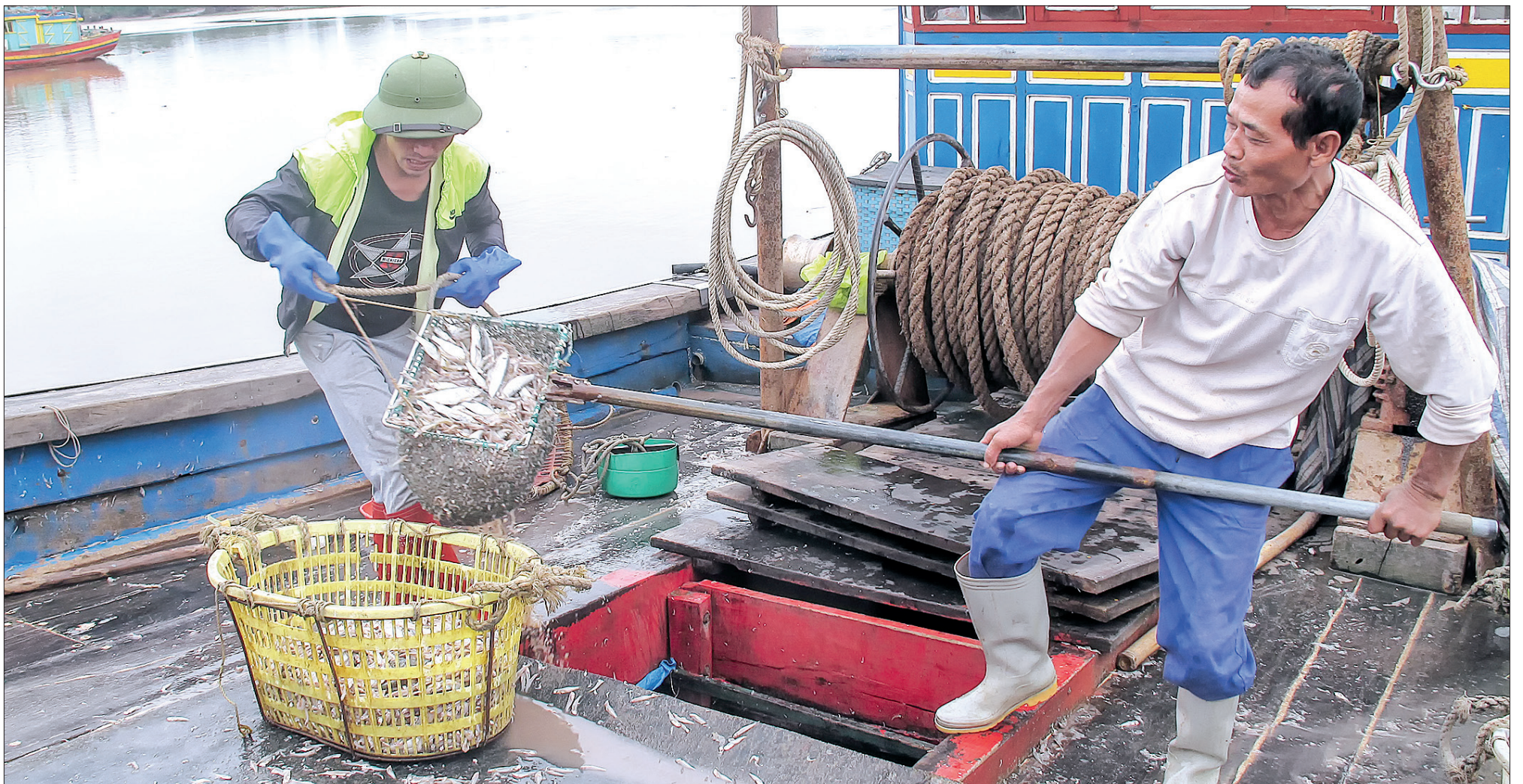
Ngư dân Thái Thụy khai thác hải sản.

Cùng với sự hiểu biết về pháp luật, sự hỗ trợ từ các lực lượng chức năng, những thiết bị VMS đã trở thành một điểm tựa để ngư dân Thái Bình nói riêng và ngư dân cả nước nói chung tự tin hơn trong chuỗi ngày dài vươn khơi, bám biển, vừa sản xuất phát triển kinh tế vừa bảo vệ chủ quyền biển, đảo của Tổ quốc.