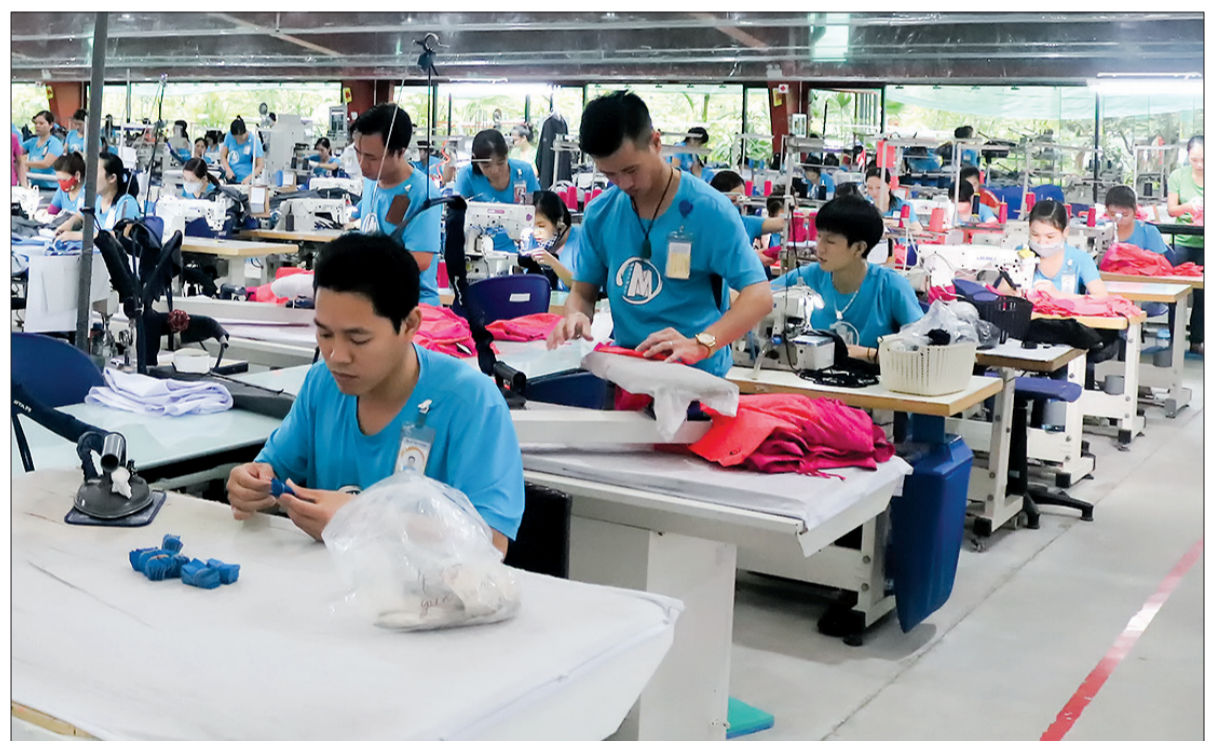
Công ty TNHH Maxport Limited Việt Nam chi nhánh Thái Bình xây dựng môi trường làm việc thoáng mát cho người lao động.