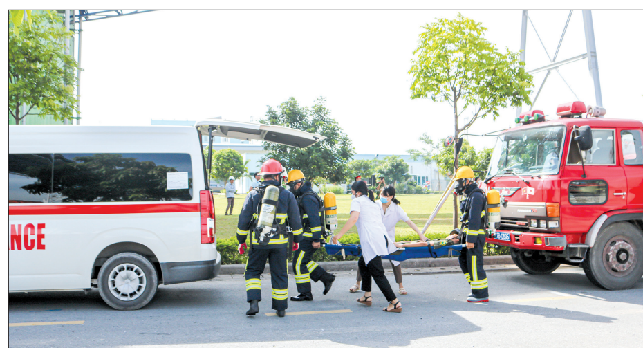
Các đơn vị luyện tập phương án cứu hộ, cứu nạn.

tốt công tác phối hợp, bổ sung lực lượng, phương tiện, thiết bị sát với tình huống thực tế, khoa học, đúng với tình huống để ra trong phương án, bảo đảm các yêu cầu và quy trình về chiến thuật, kỹ thuật chữa cháy và cứu nạn, cứu hộ. Tập trung rà soát các nội dung, phương án, tích cực luyện tập, sử dụng thành thạo các dụng cụ, phương tiện, trang thiết bị chuyên dùng được trang bị để phát huy tính năng, tác dụng, hiệu quả cao nhất, bảo đảm an ninh, an toàn về mọi mặt trong quá trình diễn tập.