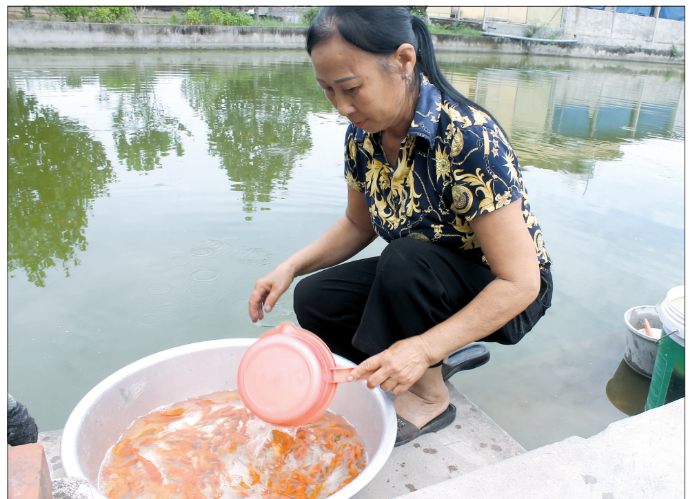
Ương cá chép vàng giống phục vụ mùa sản xuất cá chép vàng cuối năm.