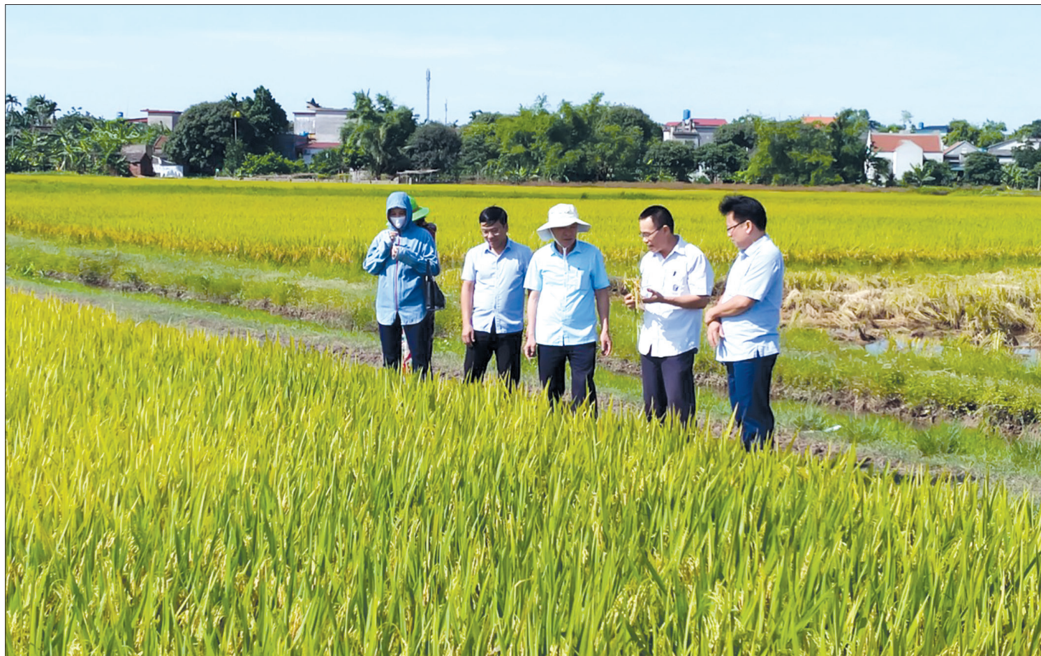
Lãnh đạo Ban Dân vận Tỉnh ủy, Ban Dân vận Huyện ủy Quỳnh Phụ khảo sát mô hình dân vận khéo cánh đồng không bờ ở xã Quỳnh Thọ.

Không chỉ tạo điều kiện thuận lợi cho việc ứng dụng khoa học kỹ thuật vào sản xuất, mô hình “Cánh đồng không bờ, sản xuất lúa thương phẩm” tại xã Quỳnh Thọ (Quỳnh Phụ) còn giúp người dân tiết kiệm nhân công, hạn chế được tình trạng chuột phá hoại do bờ ngăn ruộng gây ra và bảo đảm đầu ra ổn định cho sản phẩm.