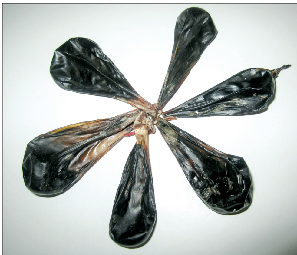
Túi mật rắn sấy khô.

loài mật động vật có tác dụng bồi bổ và chữa được nhiều bệnh khác nhau... Bởi thế, nhiều người, đặc biệt là “cánh nhậu nhẹt” đã thi nhau nuốt sống hoặc uống vô tội vạ rượu có pha các loại mật động vật như mật bò tót, mật rắn, mật ba ba, mật rùa, mật trăn, mật mèo, mật khỉ..., thậm chí cả mật cá trắm và mật cóc với hy vọng rằng sẽ làm tăng cường sinh lực, cải thiện sức khỏe, giải rượu, giải độc và phòng, chống nhiều loại bệnh tật... Khẳng định