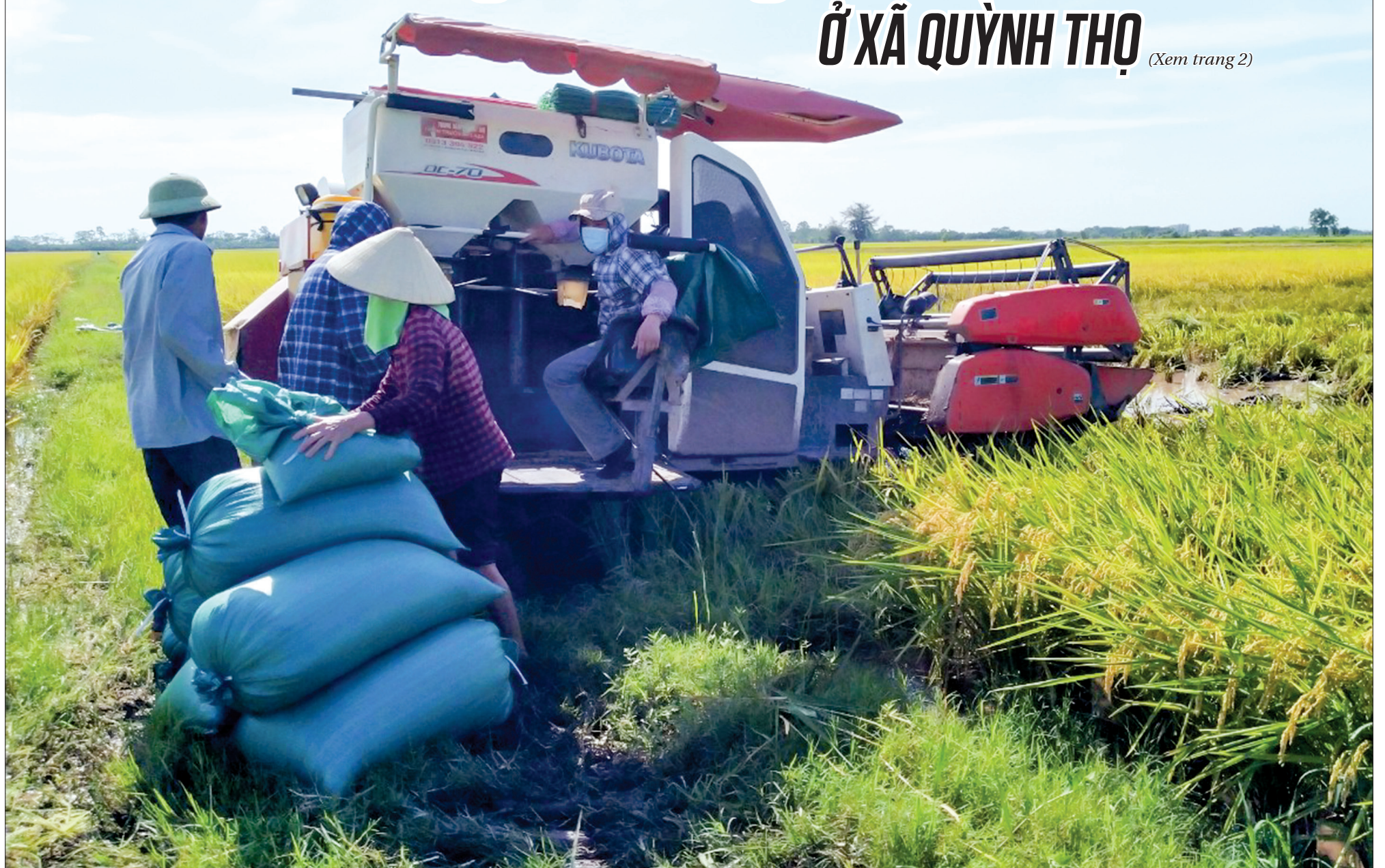
Việc xóa bỏ bờ ngăn giúp máy móc phục vụ sản xuất hoạt động thuận lợi, giảm thời gian và chi phí xăng dầu.