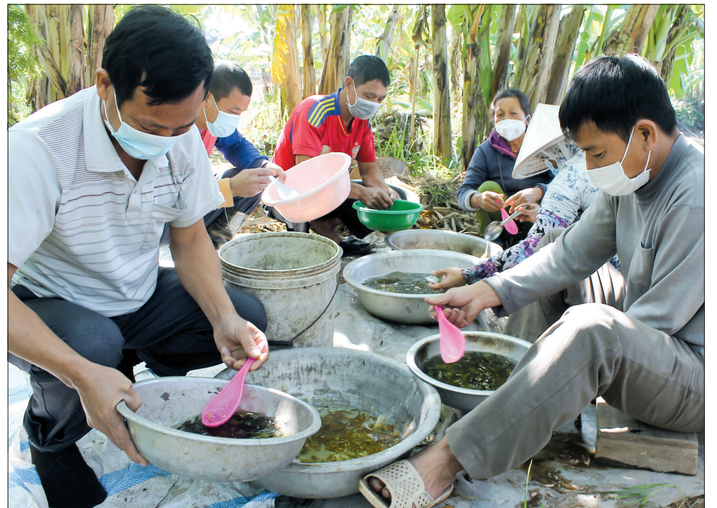
Người dân Vũ Đoài chọn lọc, phân loại cá giống trước khi xuất bán.