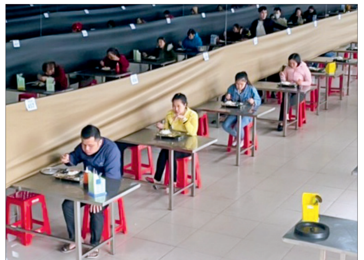
Bếp ăn Công ty Cổ phần TBS Sông Trà bố trí vách ngăn vải tạo khoảng cách an toàn cho người lao động.