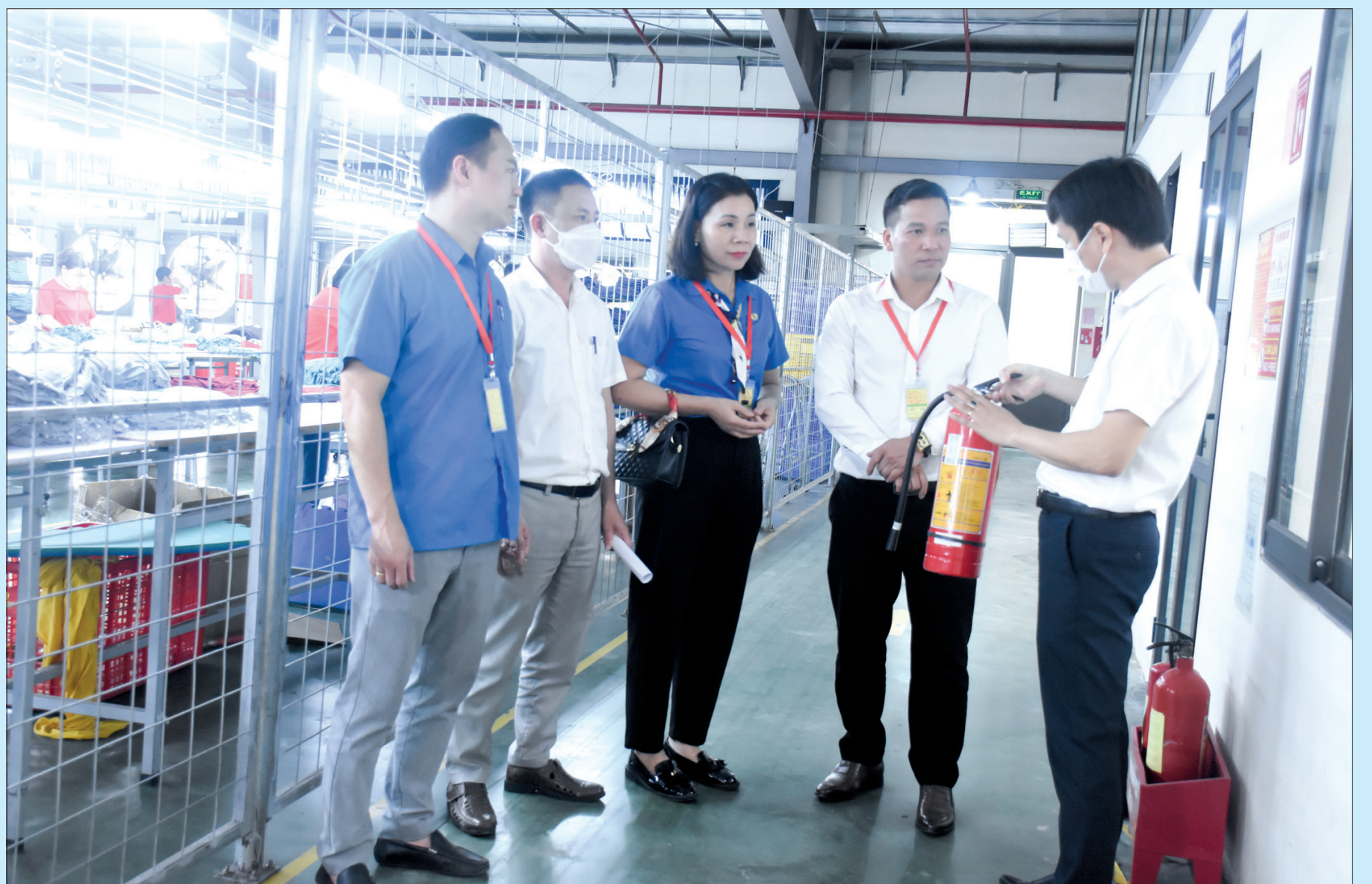
Công ty Cổ phần Tập đoàn may Đại Dương luôn thực hiện tốt các quy định về an toàn, vệ sinh lao động.