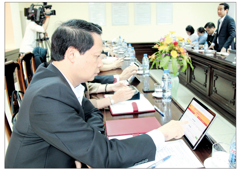
Đại biểu HĐND tỉnh thao tác trên máy tính bảng để nghiên cứu tài liệu, phát biểu, biểu quyết.