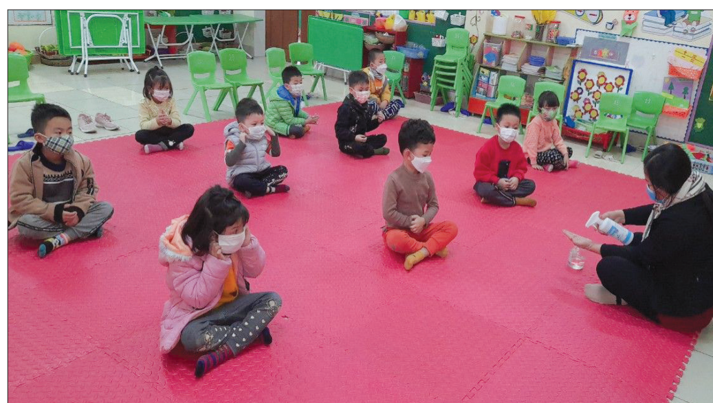
Giáo viên Trường Mầm non Thái Thượng (Thái Thụy) hướng dẫn trẻ cách giữ ấm, bảo vệ sức khỏe khi thời tiết chuyển rét đậm, rét hại và dịch Covid-19 diễn biến phức tạp.

Đỗ Trường Sơn, Trưởng phòng Giáo dục và Đào tạo huyện cho biết: Ngày chiếu ngày 20/2, Phòng đã chỉ đạo các trường thông báo đến toàn thể cán bộ, giáo viên và phụ huynh học sinh thường xuyên cập nhật diễn biến thời tiết và có biện pháp bảo đảm sức khỏe cho học sinh trong những ngày rét đậm, rét hại. Theo Đài Khí tượng thủy văn tỉnh, nhiệt độ đo được lúc 13 giờ ngày 20/2 là 8,1°C, trời rét hại và dự báo còn rét đậm, rét hại trong những ngày tới. Do đó, ngày 21/2 nhiệt độ xuống thấp dưới 10°C