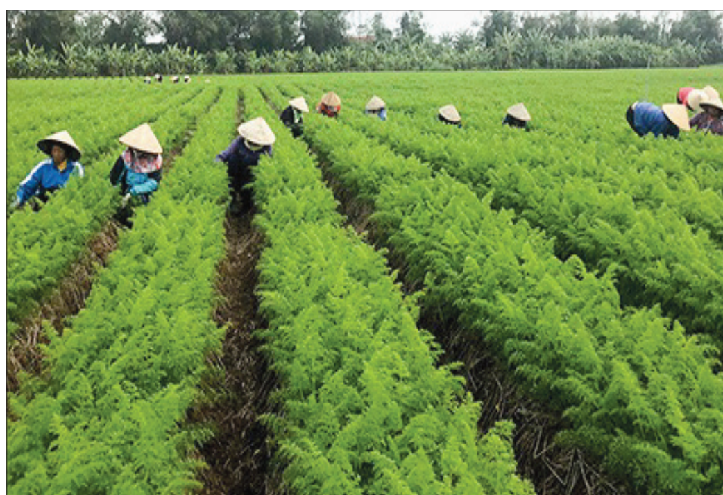
Vùng trồng cà rốt ở xã Địch Nông tạo việc làm cho hàng chục lao động địa phương.

đồng. Hiện, mỗi sào cà rốt anh thu được một tấn với giá bán từ 5.000 - 6.000 đồng/kg tại ruộng. Anh Hưng chia sẻ: Dù bị ảnh hưởng của dịch Covid-19 nhưng năm nay giá cà rốt bán được giá. Tính ra mỗi sào tôi thu lãi 4 - 5 triệu đồng. So với các loại cây trồng truyền thống như ngô, lạc thì cà rốt mang lại hiệu quả cao gấp 2 - 3 lần. Tôi cũng mạnh dạn đầu tư máy làm đất, máy gieo hạt, hệ thống tưới nên giảm được ngày công, giống, phân bón nên nguồn thu nhập cao và ổn định hơn, đặc biệt trồng đến đâu được thương lái đến tận ruộng thu mua đến đó.