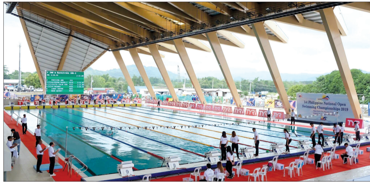
Bể bơi 10 làn tiêu chuẩn Olympic tại Trung tâm thể thao dưới nước thuộc Khu liên hợp thể thao New Clark City.