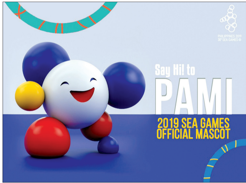
Linh vật Pami của SEA Games 30.