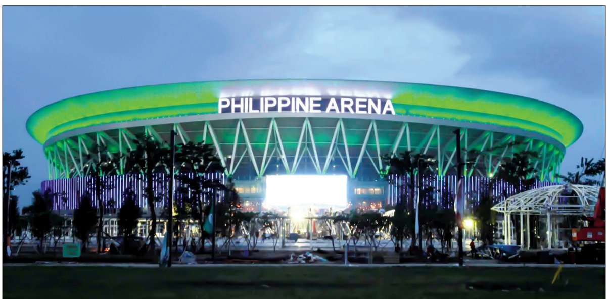
Nhà thi đấu hỗn hợp Philippine Arena.

băng nghệ thuật, năm môn thể thao phối hợp, chèo thuyền, đua thuyền buồm, trượt ván tốc độ, bắn súng, quần vợt bóng mềm, Squash, lướt sóng, bóng bàn, quần vợt, ba môn thể thao phối hợp, cử tạ và lướt ván buồm). Các môn thể thao truyền thống và các môn thể thao mới gồm: các môn thể thao đồng đội (E-sports, Floorball, Netball, khúc côn cầu dưới nước); các môn thể thao đối kháng (võ gậy - Arnis), Jujitsu, Kick-boxing, Kurash và Sambo) và các môn thể thao cá nhân (cờ, bóng cò, bi sắt, trượt chèo ngựa vật và Wakeboarding). Đoàn thể thao Việt Nam sẽ mang tới Philippines tổng cộng 856 thành viên, tham gia tranh tài ở 43/56 môn; trong đó, có nhiều môn thể mạnh như điền kinh, bắn súng, thể dục dụng cụ, đấu kiếm, đua thuyền, bơi, cờ vua, cử tạ... được kỳ vọng sẽ mang vinh quang về cho Tổ quốc. Bộ Văn hóa, Thể thao và Du lịch cũng đã giao nhiệm vụ cho đoàn thể thao Việt Nam,