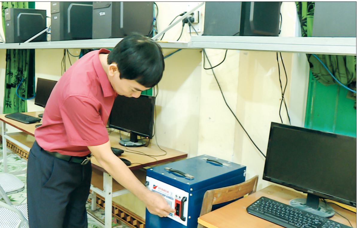
Hành động tắt thiết bị điện trước khi ra khỏi phòng học cũng góp phần bảo đảm an toàn và tiết kiệm điện.