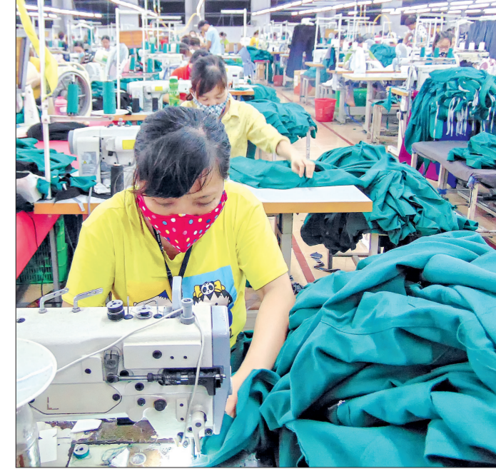
Công nhân Công ty Cổ phần May Hà Thành.

Nhờ thực hiện tốt dân chủ nên từ khi thành lập đến nay, Công ty không hề xảy ra tình trạng ngừng việc tập thể; lòng tin của người lao động với Công ty ngày càng được củng cố. Người lao động ngày càng gắn bó với Công ty, hăng say sản