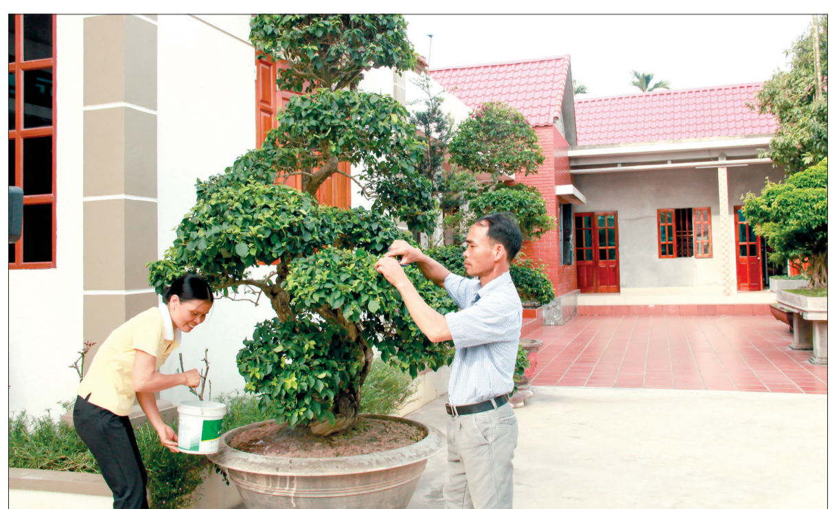
Vợ chồng anh Ân cùng chăm sóc cây cảnh trong khuôn viên ngôi nhà khang trang của gia đình.