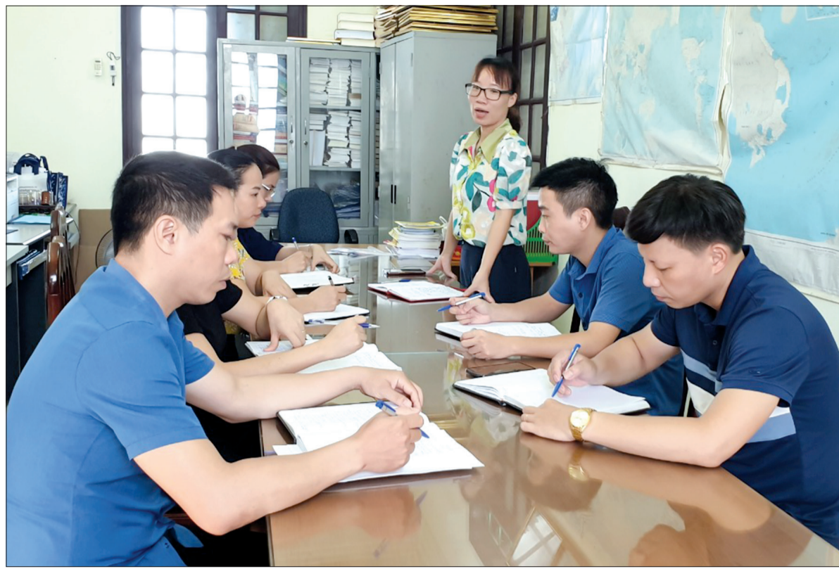
Chi bộ Ban Tuyên giáo Huyện ủy - Trung tâm Chính trị huyện Quỳnh Phụ triển khai nội dung xây dựng mô hình chi bộ kiểu mẫu.

Xác định việc lựa chọn nội dung để tập trung lãnh đạo, chỉ đạo trước hết phải gắn với thực hiện nhiệm vụ chính trị, nhiệm vụ chuyên môn của cơ quan, vì vậy trong quá trình chuẩn bị các nội dung để xây dựng mô hình chi bộ kiểu mẫu, chúng tôi đã thảo luận, bàn bạc, thống nhất trong Chi bộ. Xuất phát từ quá trình triển khai thực hiện Nghị quyết số 04-NQ/TU của Ban Chấp hành Đảng bộ tỉnh khóa XIX về tăng cường giáo dục, phát huy truyền thống văn hóa, văn hiến, yêu nước, cách mạng của quê hương Thái Bình cho cán bộ, đảng viên và các tầng lớp nhân dân và việc thực hiện Đề án số 01-ĐA/HU của Ban Thường vụ Huyện ủy Quỳnh Phụ về việc tăng cường tuyên truyền, giáo dục truyền thống của lịch sử như: tham mưu biên soạn tài liệu tuyên truyền, giáo dục lịch sử truyền thống của Đảng bộ huyện Quỳnh Phụ; tham mưu hoàn thiện biên soạn cuốn Lịch sử Đảng bộ huyện Quỳnh Phụ giai đoạn 2005 - 2020. Để hoàn thành các nhiệm vụ này, hàng tháng Chi bộ tổ chức sinh hoạt, đánh giá kết quả thực hiện từng