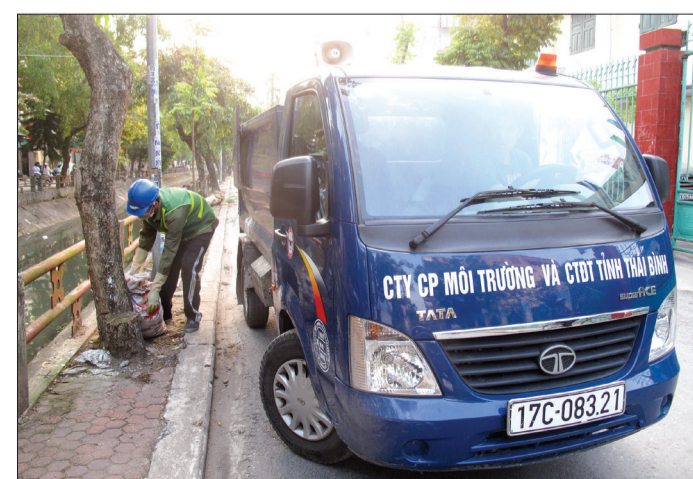
Công nhân Công ty Cổ phần Môi trường và Công trình đô thị Thái Bình thu gom rác thải sinh hoạt bằng xe cơ giới trên địa bàn phường Bồ Xuyên.

nhân Công ty Cổ phần Môi trường và Công trình đô thị Thái Bình thu gom rác thải sinh hoạt bằng xe cơ giới trên địa bàn phường Bồ Xuyên.