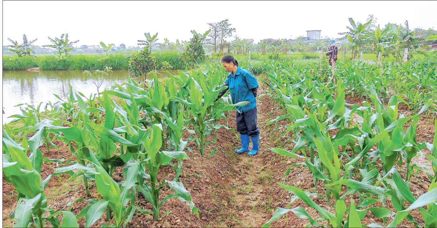
Nông dân xã Tây Lương (Tiền Hải) phát triển kinh tế từ nguồn vốn tín dụng chính sách.

Đến ngày 31/3, tổng doanh số cho vay xây dựng NTM của Ngân hàng CSXH Chi nhánh tỉnh đạt 227,948 tỷ đồng; tổng dư nợ cho vay đạt 2.574,266 tỷ đồng, chiếm 95,92% tổng dư nợ cho vay toàn Chi nhánh; tỷ lệ nợ xấu chiếm 0,11%. 98.572 hộ nghèo, hộ cận nghèo và các đối tượng chính sách khác trên địa bàn tỉnh đã được tiếp cận vốn vay ưu đãi của Chính phủ trong các lĩnh vực như: giải quyết việc làm; cải tạo, nâng cấp công trình nước sạch và vệ sinh môi trường nông thôn; phát triển sản xuất, kinh doanh của gia đình... Nhờ đó, cuộc sống của hộ nghèo và các đối tượng chính sách trên địa bàn tỉnh ngày càng được cải thiện, nâng cao, góp phần cùng các địa phương hoàn thành các tiêu chí trong xây dựng NTM.