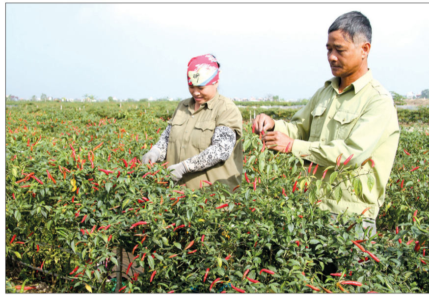
Nông dân xã Quỳnh Hải (Quỳnh Phụ) thu hoạch cây vụ đông.