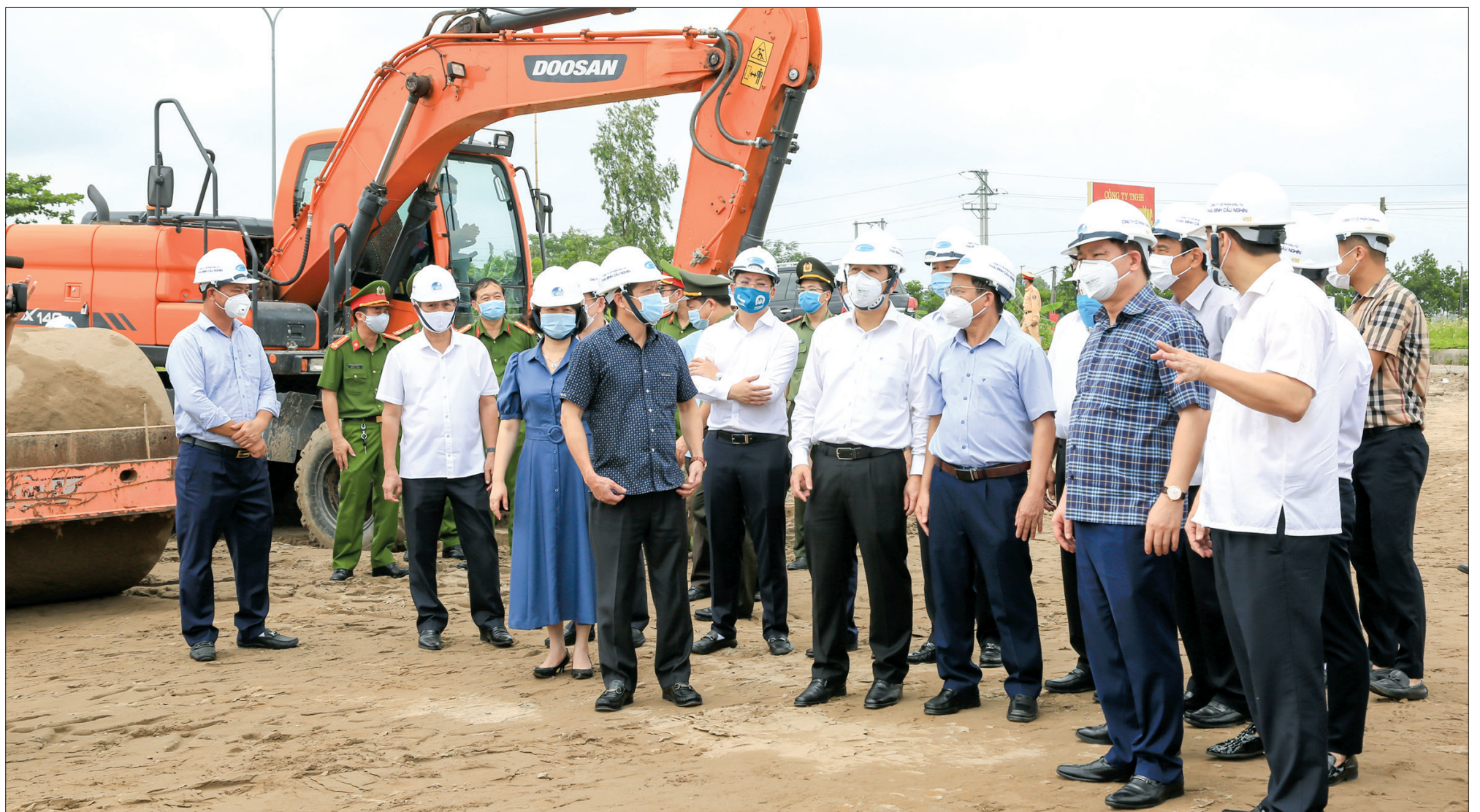
Các đồng chí lãnh đạo tỉnh dự, chứng kiến nhà thầu triển khai thi công gói thầu số 1 dự án đầu tư xây dựng tuyến đường bộ từ thành phố Thái Bình đi cầu Nghìn.