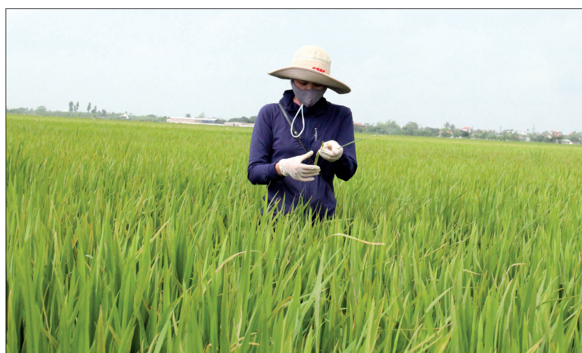
Cán bộ Trạm Trồng trọt và Bảo vệ thực vật huyện Quỳnh Phụ kiểm tra tình hình sâu bệnh trên lúa xuân.