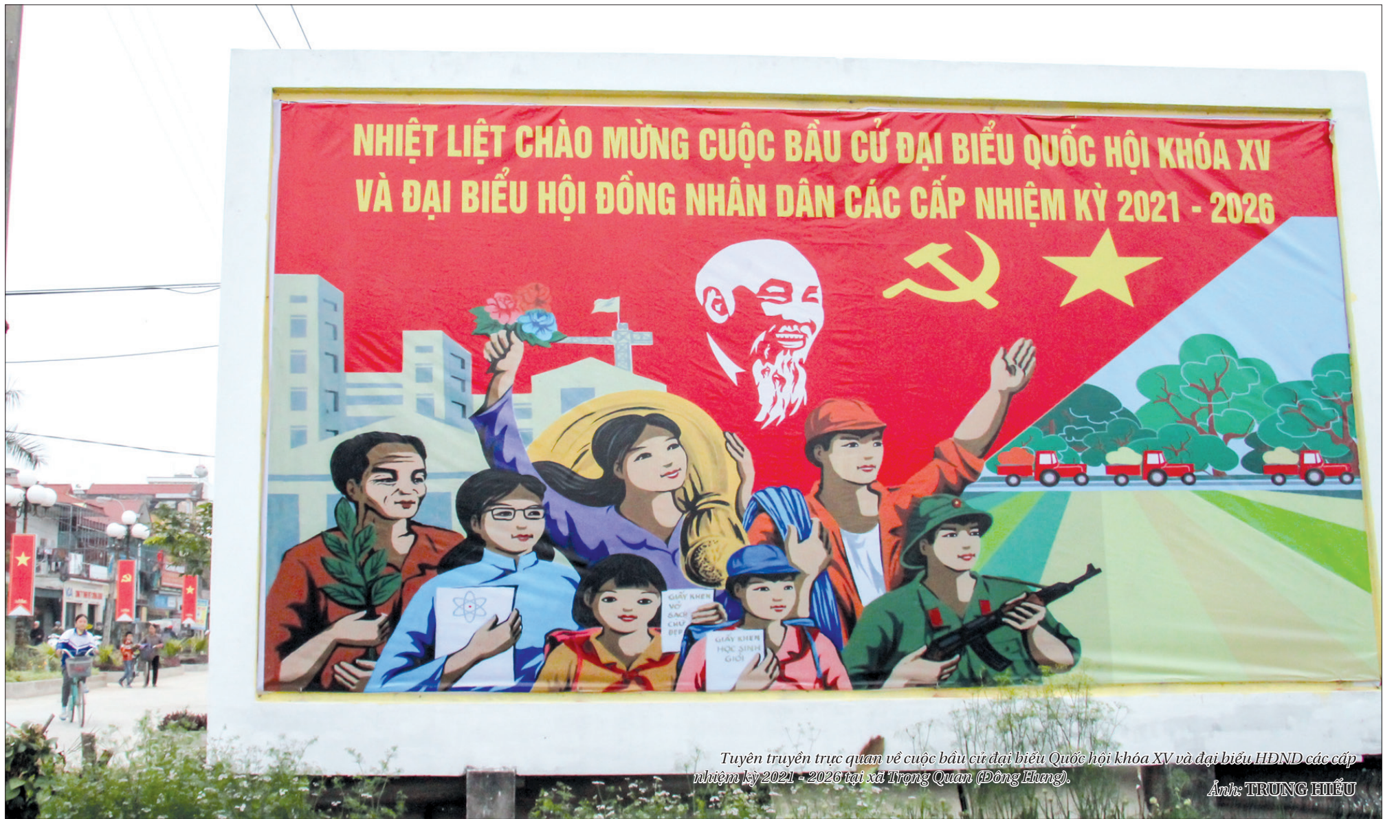
Tuyên truyền trực quan về cuộc bầu cử đại biểu Quốc hội khóa XV và đại biểu HĐND các cấp nhiệm kỳ 2021 - 2026 tại xã Trọng Quán (Đông Hưng).