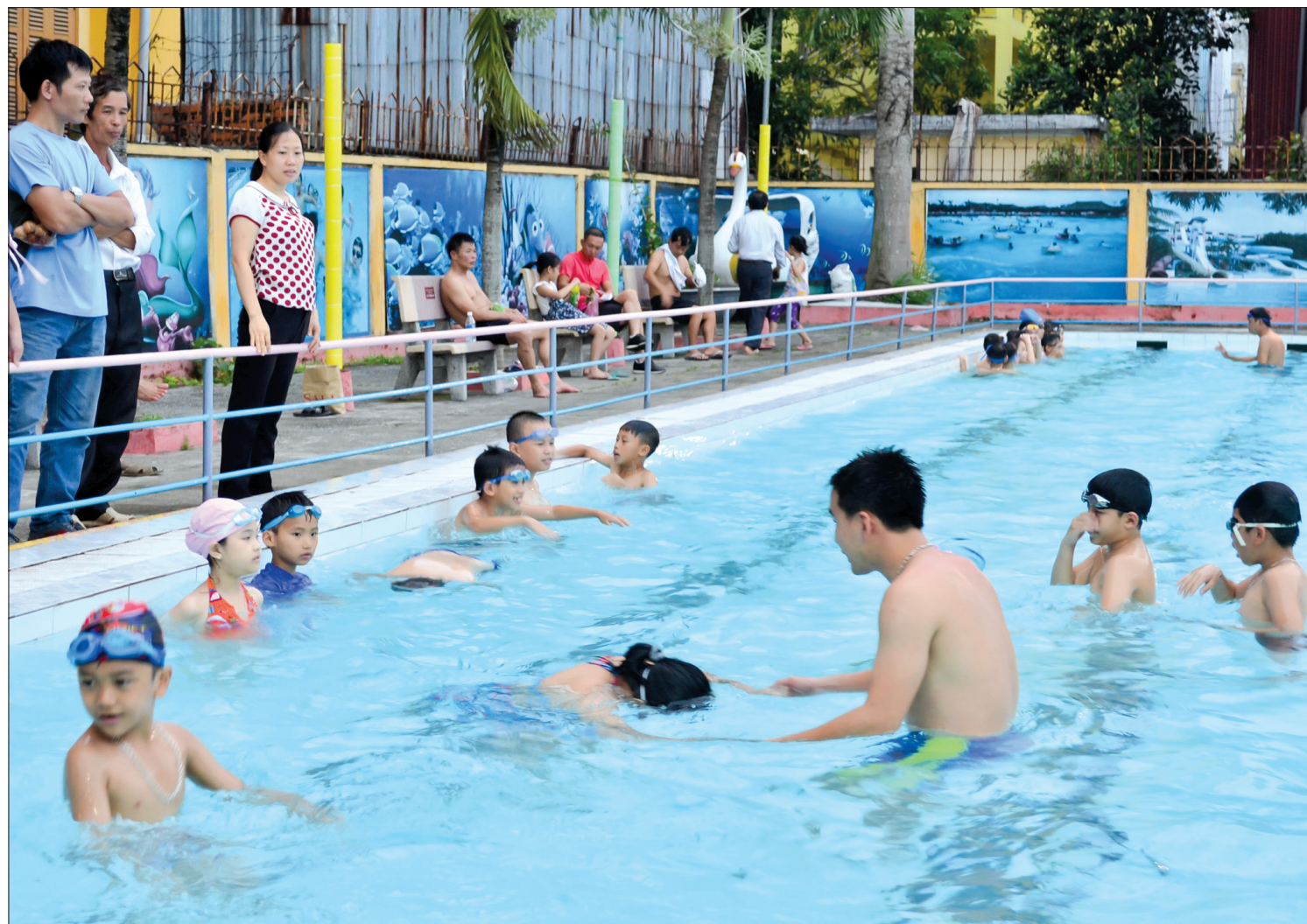
Dạy bơi cho trẻ là giải pháp phòng, chống đuối nước hiệu quả.

Xã Lô Giang (Đông Hưng) có sông Tiên Hưng bao bọc, có 4 thôn trong đó