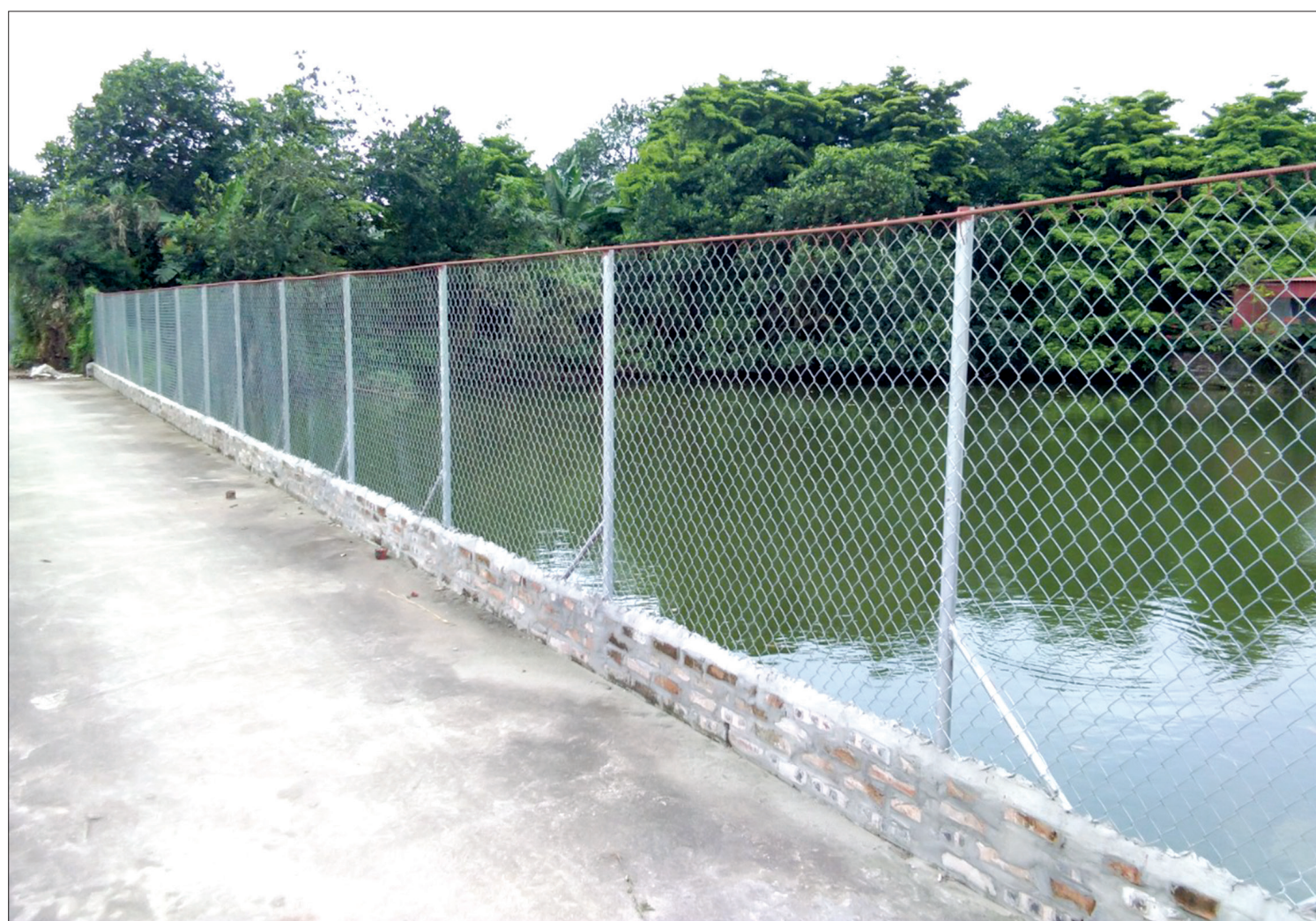
Gia đình có ao, hồ chủ động làm rào chắn để hạn chế nguy cơ trẻ bị đuối nước.

Cùng với việc tổ chức các hoạt động vui chơi bổ ích cho trẻ trong dịp hè, các địa phương cần đẩy mạnh tuyên truyền về phòng, chống đuối nước, có các biện pháp bảo vệ trẻ kịp thời; mỗi gia đình cũng thường xuyên quan tâm, chú ý đến trẻ, có như vậy mới không để xảy ra nguy cơ đuối nước.