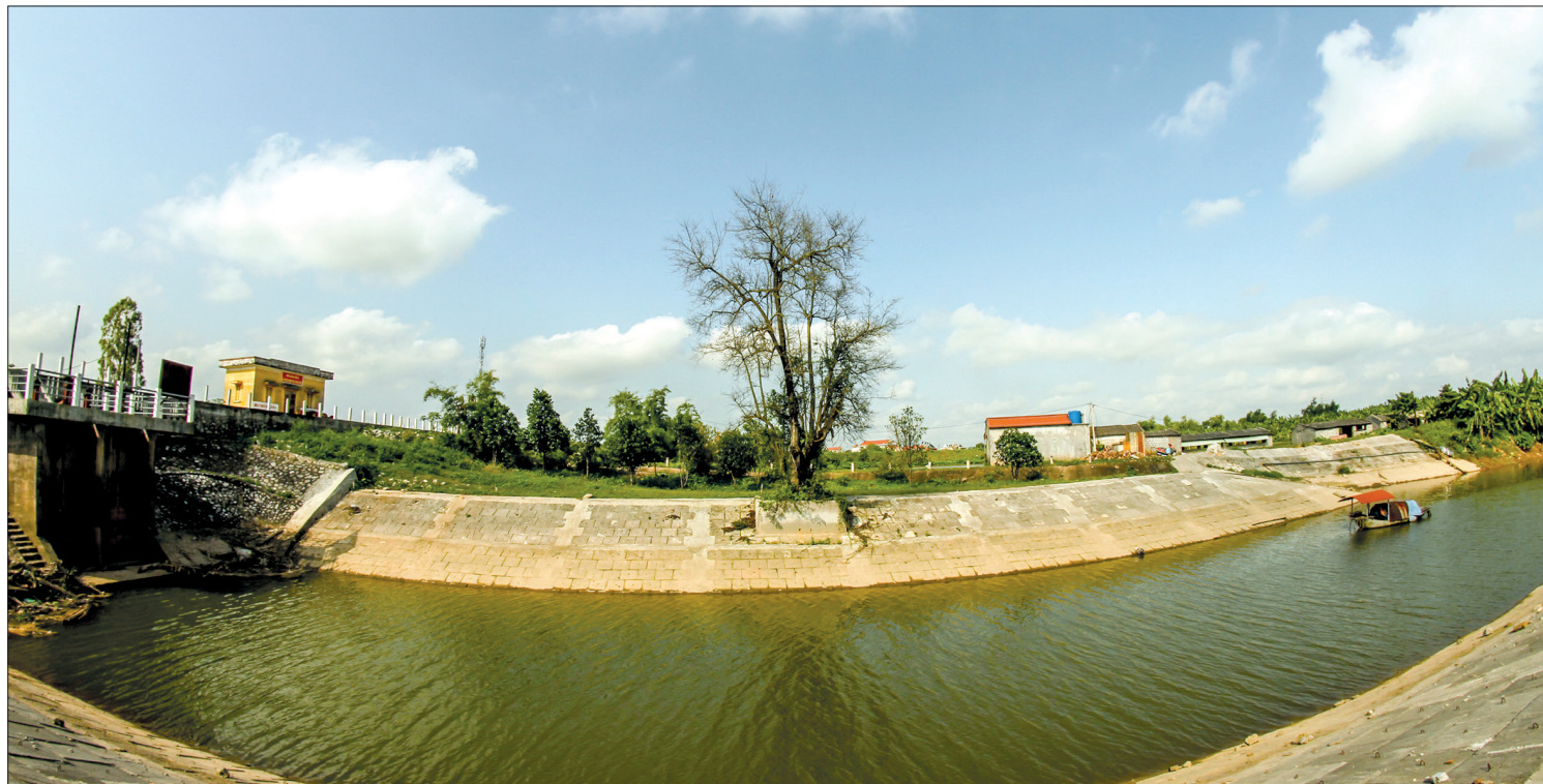
Cống Hậu Thượng, xã Hồng Bạch, huyện Đông Hưng - địa danh được xác định là nơi tập kết quân đội nhà Trần tiến đánh quân Nguyên Mông.

Trước khi trở thành vương triều phong kiến thịnh vượng mang quốc hiệu Đại Việt, nhà Trần (1226 - 1400) vốn “nổi đời làm nghề chài lưới” đời một tổ ở hương Tức Mặc (Thiên Trường - Nam Định) sang Thái Đường (Tiến Đức, Hưng Hà) táng và đặt tên lộ Long Hưng. Vì thế, vua tôi nhà Trần thấu hiểu sâu sắc lợi thế sông ngòi trong tổ chức quân đội và vai trò quân thủy trong chiến tranh. Sách “Lịch triều hiến chương loại chí” của Phan Huy Chú biên khảo có chép: Trần Thái Tông, năm 1239 chọn đình tráng làm binh, định làm 3 bậc thượng, trung, hạ. Năm 1241, chọn người có sức khỏe, biết võ nghệ sung làm quân thượng đô túc vệ... Thánh Tông, năm 1261 tuyển đình tráng các lộ làm binh, số còn thừa cho sung làm sắc dịch ở các sảnh viện cục và các đội tuyển phong ở các phủ, lộ, huyện.