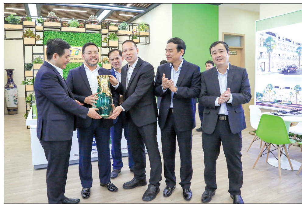
Các đồng chí lãnh đạo tỉnh tặng quà Ban Quản lý Công ty Cổ phần Khu công nghiệp Sài Gòn - Hải Phòng.