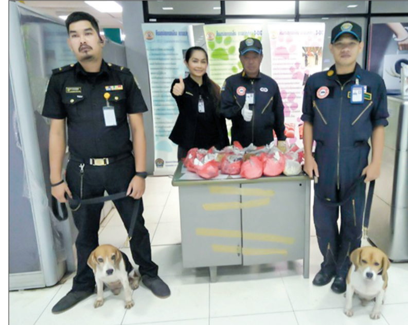
Lực lượng chức năng và chó nghiệp vụ được triển khai nhằm phát hiện các sản phẩm từ thịt lợn đưa vào Thái Lan.

tư duy “đằng nào nước ta cũng đã có bệnh dịch tả lợn châu Phi rồi” mà buông lỏng kiểm soát nguồn lây lan từ các nước vào Việt Nam. Bởi việc không chế dịch trong nước sẽ vô nghĩa nếu tiếp tục có nguồn lây lan mới vào nước ta. Theo đó, Việt Nam không chỉ cần thiết phải cấm nhập khẩu thịt lợn và các sản phẩm từ thịt lợn từ các nước có dịch (bắt buộc phải có giấy phép nhập khẩu và kiểm dịch) mà còn phải có các giải pháp cụ thể để kiểm