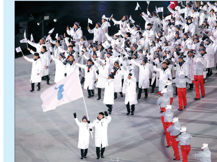
Các vận động viên Hàn Quốc và Triều Tiên tại lễ bế mạc Olympic PyeongChang 2018.

(vietnamplus.vn) Theo Tổng Thư ký Liên đoàn Bóng đá Hàn Quốc Hong Myung-bo, FIFA đã lần đầu tiên đề cập đến việc hai miền Triều Tiên đồng đăng cai giải đấu này cách đây một tháng. Theo hãng tin Yonhap, Liên đoàn Bóng đá Hàn Quốc đang xem xét khả năng cùng Triều Tiên đăng cai giải vô địch bóng đá nữ thế giới 2023. Trong một tuyên bố ngày 4/3, Tổng Thư ký Liên đoàn Bóng đá Hàn Quốc Hong Myung-bo cho biết: “Đại diện Liên đoàn Bóng đá thế giới (FIFA) đã có các cuộc tiếp xúc với chúng tôi và thảo luận về việc đồng đăng cai. Chúng tôi đã báo cáo chính phủ về vấn đề này”. Theo Tổng Thư ký Hong Myung-bo, FIFA đã lần đầu tiên đề cập đến việc hai miền Triều Tiên đồng đăng cai giải đấu này cách đây một tháng, khi Chủ tịch Liên đoàn Bóng đá Hàn Quốc Chung Mong-gyu tham dự một cuộc họp của FIFA. Tuy nhiên, Tổng Thư ký Hong Myung-bo nêu rõ hiện chưa có lời đề nghị chính thức nào từ FIFA và Liên đoàn Bóng đá Hàn Quốc cũng chưa trao đổi với Triều Tiên về vấn đề này.