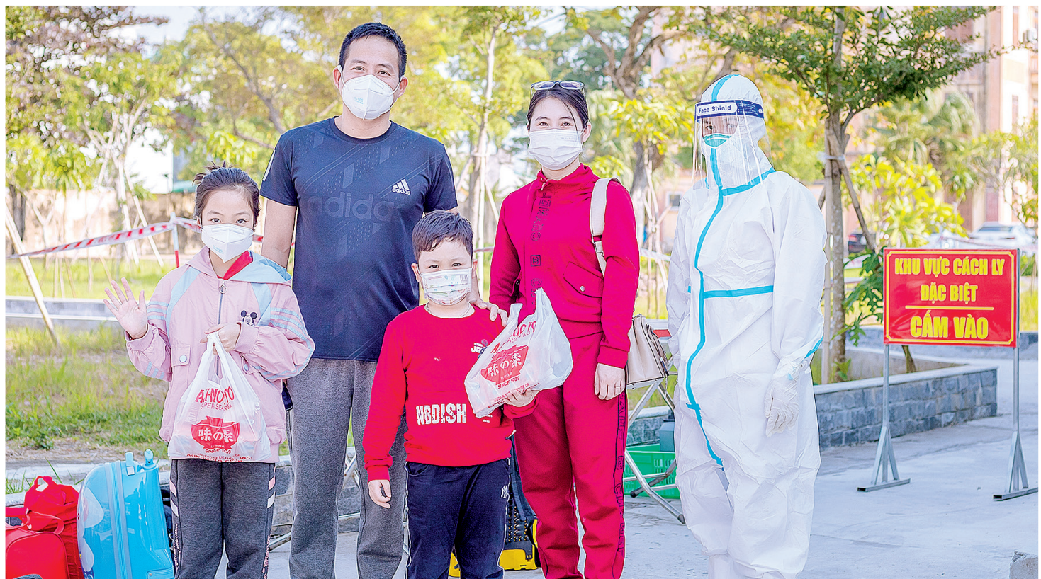
Niềm vui của bệnh nhân Covid-19 khi được công bố khỏi bệnh.