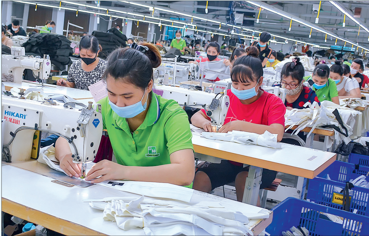
Công ty TNHH May xuất khẩu Đông Thọ với doanh thu đạt khoảng 250 - 270 tỷ đồng/năm tạo việc làm cho gần 2.000 lao động.