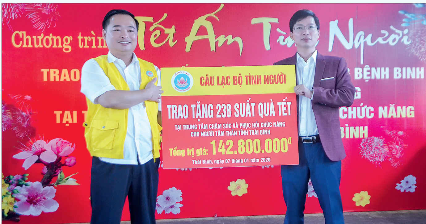
Tặng quà người có công tại Trung tâm Chăm sóc và Phục hồi chức năng cho người tâm thần.

Việc thực hiện các chế độ, chính sách cũng như chăm lo cho NCC không chỉ góp phần nâng cao đời sống vật chất, tinh thần của NCC và gia đình NCC với cách mạng mà còn để NCC cũng như thân nhân NCC thấy ấm lòng hơn với những hoạt động tri ân, thấm đượm đạo lý “Uống nước nhớ nguồn”.