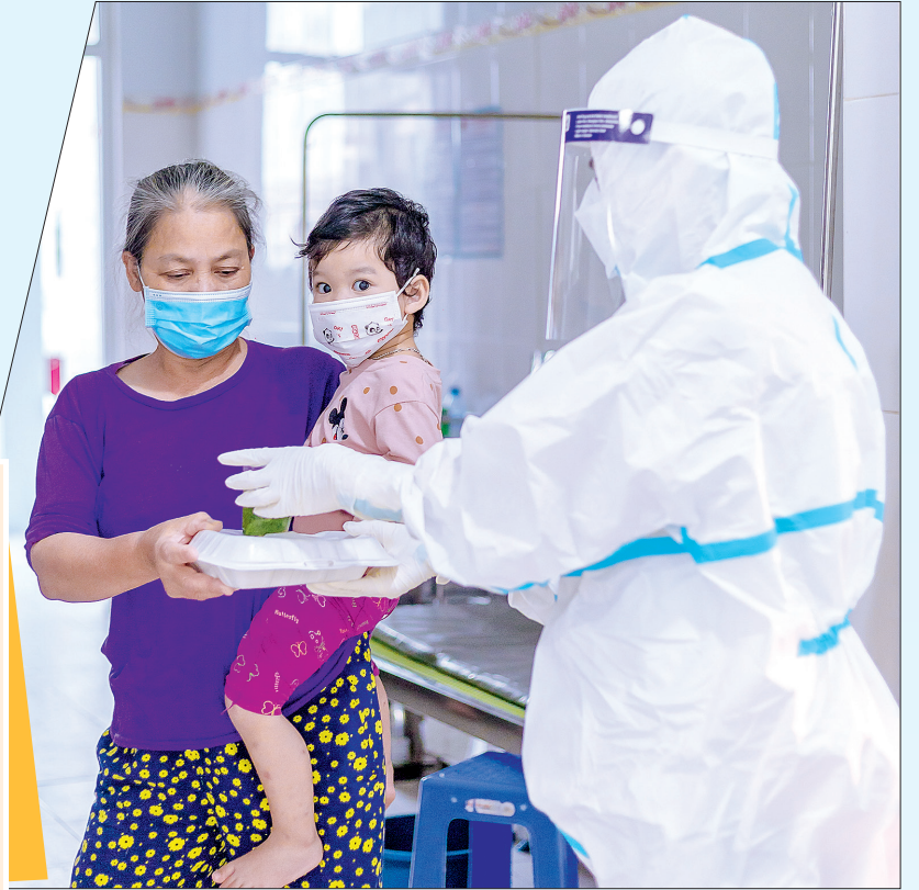
Những suất cơm được mang tới từng buồng bệnh.

Năm 2021, tiếp tục ghi nhận những diễn biến phức tạp của dịch Covid-19 trên địa bàn tỉnh, đặc biệt ở những tháng cuối năm khi số ca mắc tăng cao, có ngày ghi nhận hơn 130 ca. Dịch xâm nhập vào doanh nghiệp, trường học, cộng đồng dân cư đã ảnh hưởng nghiêm trọng đến phát triển kinh tế, gây ra những xáo trộn trong cuộc sống của người dân. Thế nhưng, từ những khó khăn ấy, tinh thần đoàn kết, sẻ chia, quyết tâm, đồng lòng đẩy lùi đại dịch lại thêm tỏa sáng. Một lão nông trích tiền tiết kiệm lúc tuổi già; một em nhỏ làm thêm việc bọc sách, dán nhãn vở để lấy tiền ủng hộ công tác phòng, chống dịch hay những việc làm ấm áp tình người nơi điều trị bệnh nhân Covid-19, các khu cách ly, phong tỏa... là những câu chuyện cảm động thấm đẫm tình người trong mùa dịch.