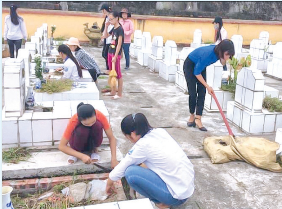
Chăm sóc nghĩa trang liệt sĩ tại xã Chí Hòa (Hưng Hà).