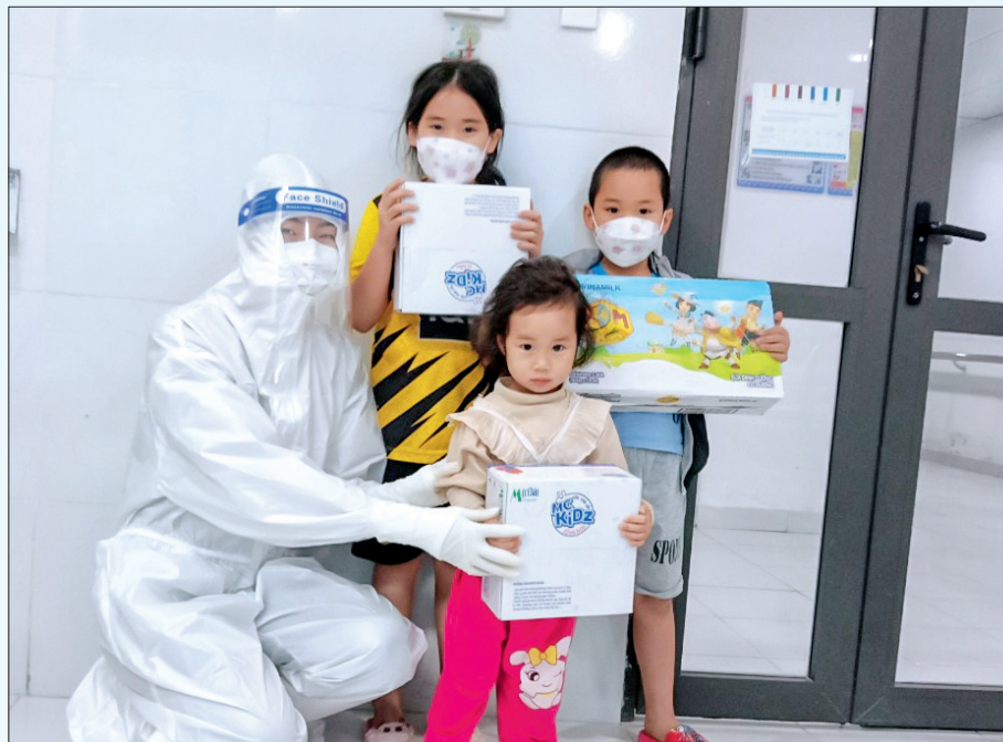
Trao quà cho bệnh nhi điều trị tại Bệnh viện Nhi Thái Bình.