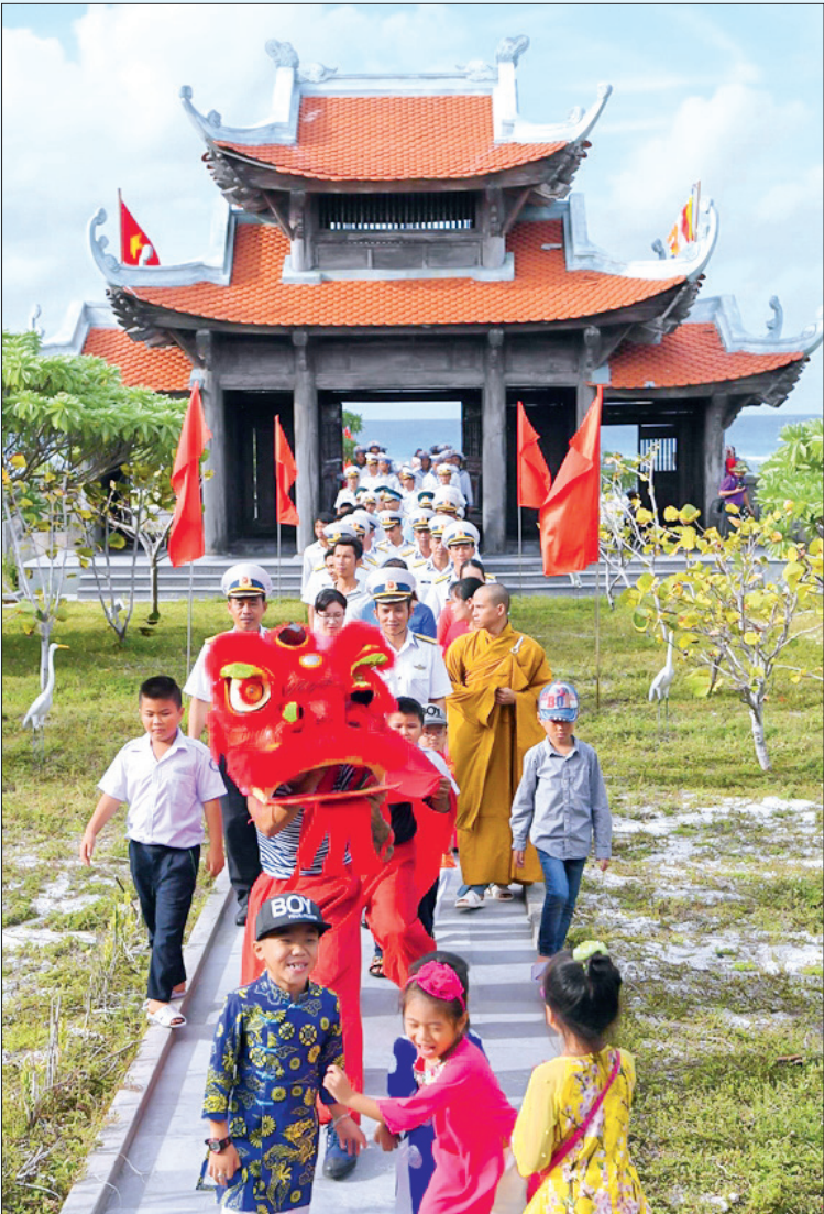
Lễ chùa đầu năm ở đảo Song Tử Tây.