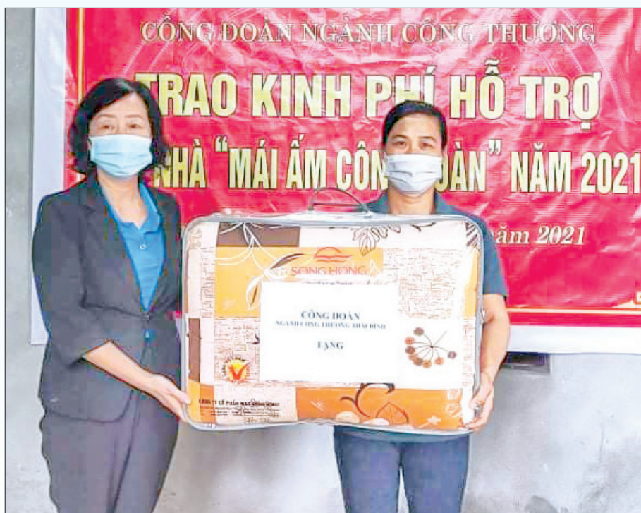
Công đoàn ngành công thương tặng quà đoàn viên nhân dịp khánh thành nhà “Mái ấm công đoàn”.

Trong năm 2021, Liên đoàn Lao động tỉnh đã triển khai vận động ủng hộ quỹ “Mái ấm công đoàn”; giao chỉ tiêu xây dựng quỹ cho các công đoàn ngành, liên đoàn lao động huyện, thành phố. Kết quả, tổng số tiền thu nộp về quỹ đạt trên 1,3 tỷ đồng. Liên đoàn Lao động tỉnh trích từ quỹ hơn 1 tỷ đồng để hỗ trợ xây dựng 32 nhà, sửa chữa 4 nhà “Mái ấm công đoàn” cho đoàn viên, CNVCLĐ có khó khăn về nhà ở. Ngoài ra tổ chức xét chọn một CNVCLĐ có hoàn cảnh đặc biệt khó khăn thuộc Liên đoàn Lao động huyện Đông Hưng tiếp nhận 60 triệu đồng kinh phí hỗ trợ xây nhà “Mái ấm công đoàn” của Công đoàn Viên chức Việt Nam. Với sự quan tâm hướng về đoàn viên, về cơ sở và cách làm hiệu quả, giải pháp linh hoạt, chương trình “Mái ấm công đoàn” đã góp phần hỗ trợ đoàn viên, CNVCLĐ có khó khăn về nhà ở được đón mùa xuân mới an vui trong mái ấm của mình.