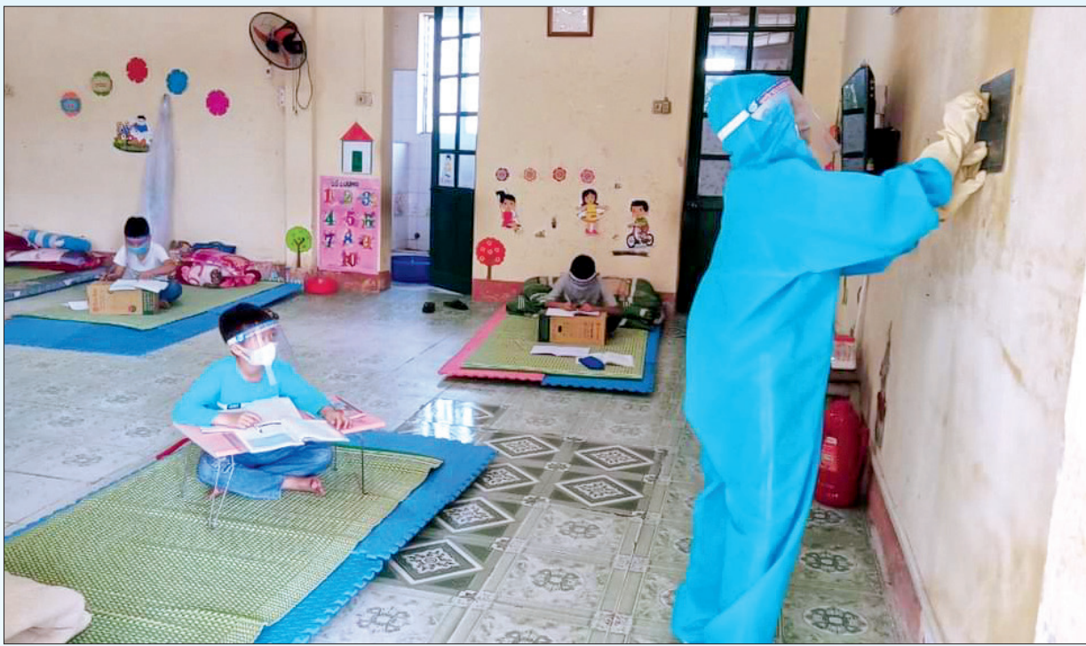
Giáo viên Trường Tiểu học Đông Hợp (Đông Hưng) dạy học cho học sinh trong khu cách ly tập trung.

Những ngày giữa tháng 11, đầu tháng 12/2021 có lẽ là khoảng thời gian khó quên nhất với nhiều địa phương khi liên tiếp ghi nhận các ca mắc Covid-19 trong cộng đồng, trong đó có hàng chục trường hợp là giáo viên và học sinh. Cách ly tập trung là biện pháp quan trọng hàng đầu để khẩn trương triển khai bóc tách F0 ra khỏi cộng đồng. Trước tình huống cấp bách, hàng chục cán bộ, giáo viên đã tình nguyện vào khu cách ly để chăm sóc học trò và hỗ trợ lực lượng y tế thực hiện các biện pháp phòng, chống dịch.