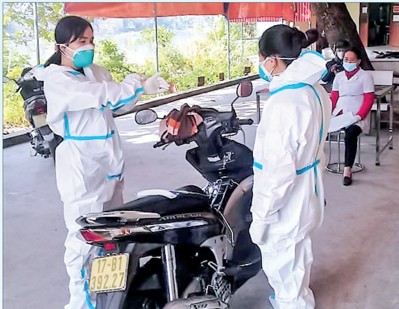
Nhân viên Trạm Y tế xã Phú Lương (Đông Hưng) chuẩn bị đi lấy mẫu xét nghiệm tại gia đình có F0.

Trong đợt cao điểm của dịch bệnh (từ ngày 10/11 đến nay), cũng như Trạm Y tế xã Nguyên