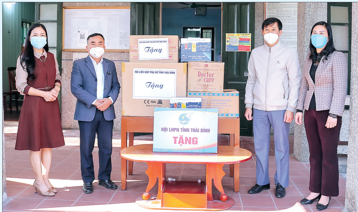
Hội Liên hiệp Phụ nữ tỉnh ủng hộ công tác phòng, chống dịch Covid-19 tại xã Đông Hợp (Đông Hưng).

Giữa dòng đời với bao bộn bề lo toan vẫn có những phụ nữ lặng thầm làm việc thiện. Dù điều kiện vật chất chỉ ở mức bình thường, thậm chí có người còn nhiều khó khăn nhưng với họ “sống là để cho đi...”