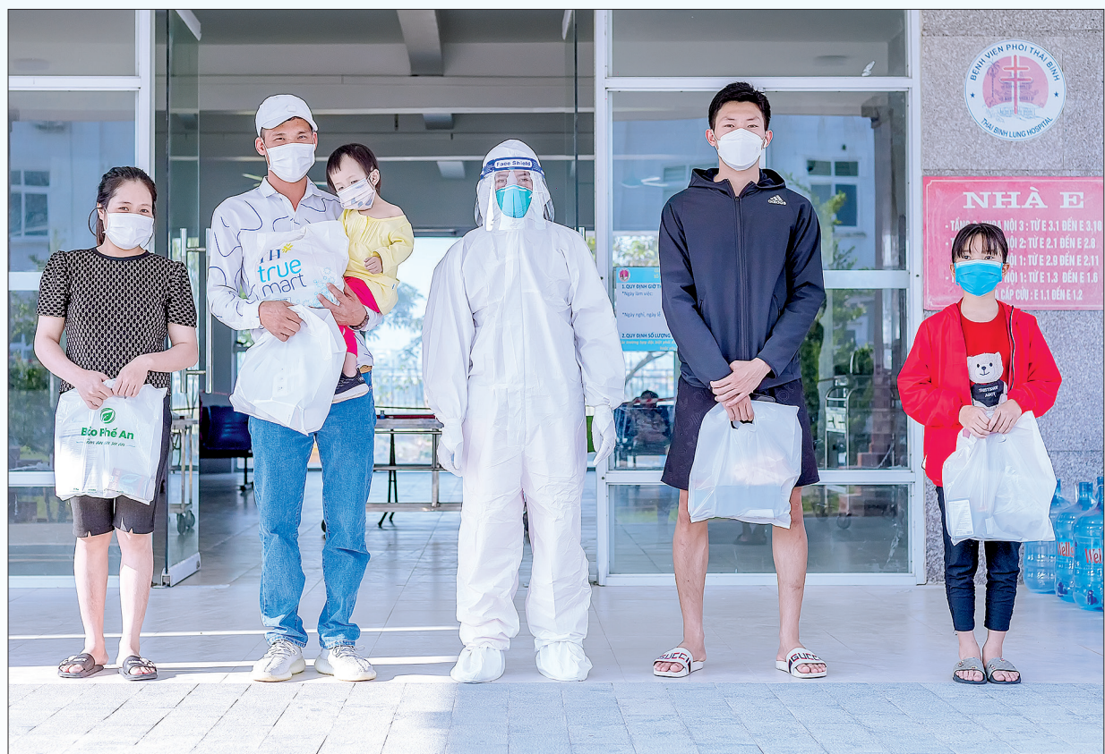
Niềm vui ngày ra viện.

Còn rất nhiều hình ảnh đẹp về sự ấm áp tình người trong những giai đoạn khó khăn của dịch bệnh khó có thể kể hết. Cuộc chiến chống dịch Covid-19 sẽ còn nhiều gian nan, thử thách. Song, tinh thần đoàn kết, lan tỏa yêu thương, chia sẻ hạnh phúc, không để ai bị bỏ lại phía sau đã thấp lên ngọn lửa niềm tin và sức mạnh cùng chung sức đồng lòng vượt qua đại dịch.