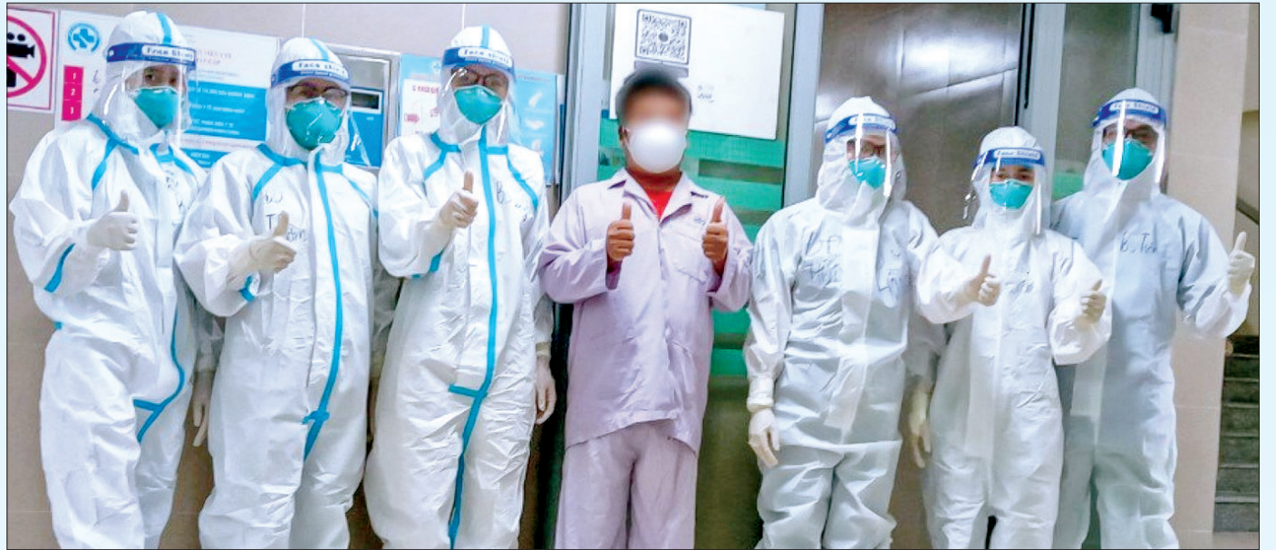
Niềm vui của các bác sĩ, nhân viên y tế Bệnh viện Đa khoa tỉnh khi sức khỏe bệnh nhân tiến triển tốt.

Gần 2 năm liên tục chiến đấu với dịch Covid-19 là những ngày quên thứ bảy, chủ nhật, quên lễ, tết và làm quen với những bữa ăn vội, giấc ngủ chập chờn, thường xuyên phải đối mặt với áp lực, nguy cơ lây nhiễm... Thế nhưng, các bác sĩ, nhân viên y tế điều trị cho bệnh nhân Covid-19 luôn kiên cường, mạnh mẽ. Gác lại hạnh phúc riêng, vượt qua khó khăn, vất vả, họ thực hiện nhiệm vụ với quyết tâm, nỗ lực và tinh thần cao nhất, tất cả vì sức khỏe người bệnh.