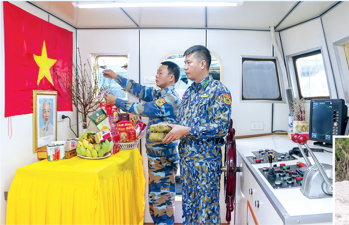
Cán bộ, chiến sĩ Hải đội 2, Bộ đội Biên phòng tỉnh trang trí phòng đón xuân trên tàu tuần tra.

Khi những cánh én chao liệng gọi xuân về, đường phố chen chân người sắm tết thì các chiến sĩ biên phòng gác lại niềm riêng để lên đường làm nhiệm vụ. Những người lính quân hàm xanh viết tiếp khúc quân hành nơi đầu sóng, cho những mùa xuân bình yên.