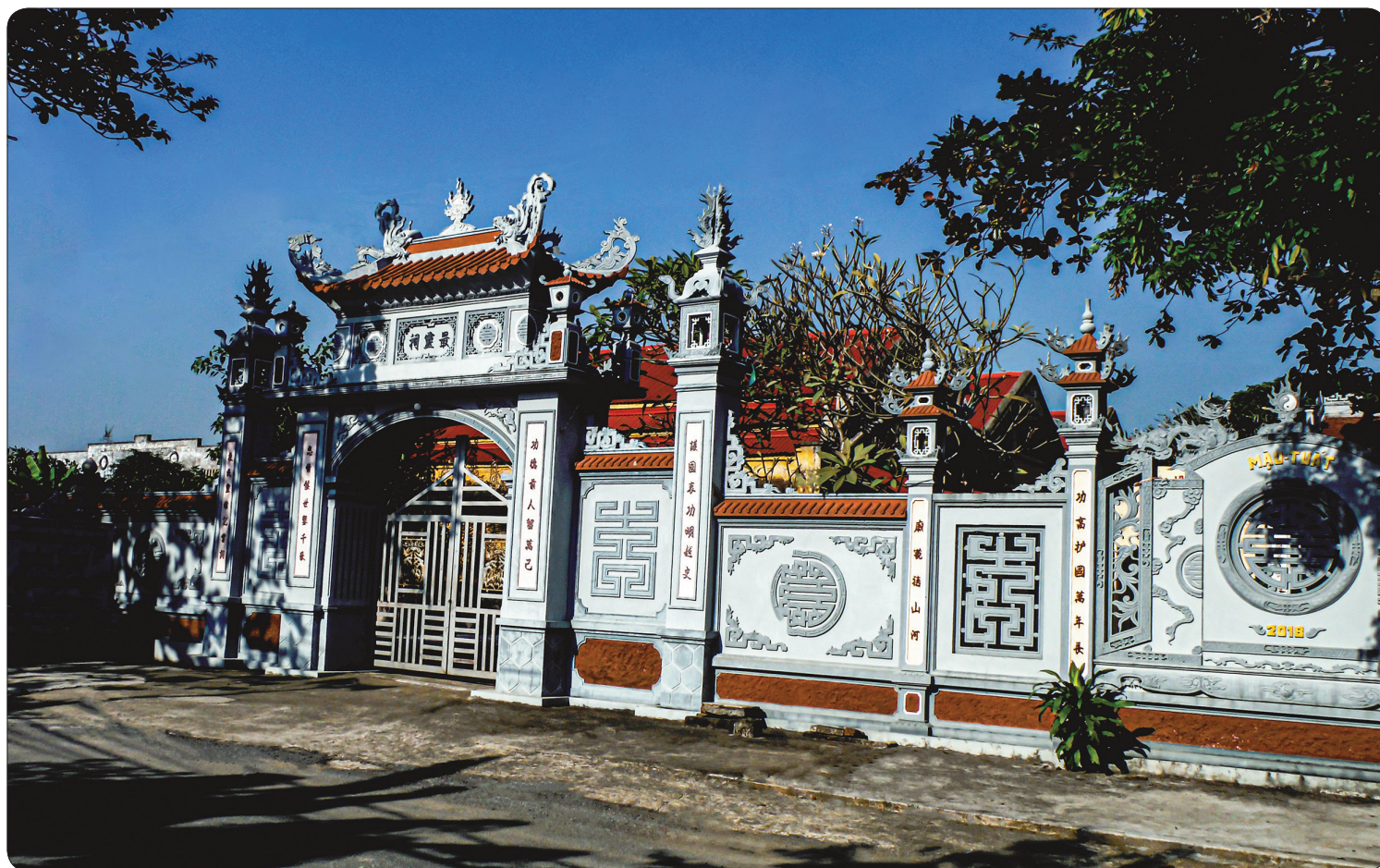
Đền Độc nhĩ, làng An Bình, xã Lô Giang (Đông Hưng) - nơi thờ tướng quân Đỗ Cảnh Thạc có công lao to lớn giúp Ngô Quyền đánh tan giặc Nam Hán.

Ngọc phá đền thờ “Độc Nhĩ Đại vương” Đỗ Cảnh Thạc ở làng An Bình, xã Lô Giang, huyện Đông Hưng có ghi: Tướng quân Đỗ Cảnh Thạc trên đường tuần tiễu giặc ngoại xâm đã dừng chân, hạ trại ở làng An Bình. Nghe danh tiếng tướng quân phò tá Ngô Vương Quyền, thanh niên trai tráng khắp vùng kéo đến xin đầu quân. Dân chúng nể phục tướng quân đã đem sản vật, lương thảo đến cổ súy đội quân. Đáp lại thịnh tình dân chúng, tướng quân Đỗ Cảnh Thạc ân cần chỉ bảo dân chúng tích cực khai khẩn đất đai, cấy trồng lúa gạo, ngô khoai cung cấp lương thảo cho triều đình, nuôi quân đánh giặc. Ngược dòng