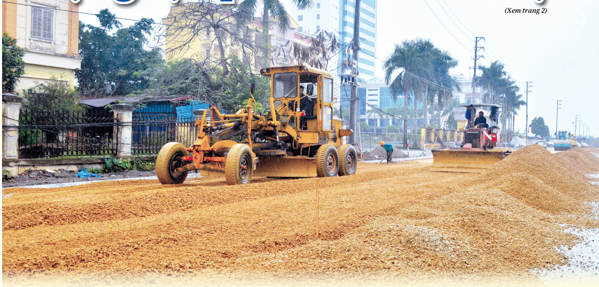
Đẩy nhanh tiến độ thi công đường Nguyễn Tông Quai, đoạn từ đường Lý Bôn đến đường quy hoạch số 1 phường Trần Lâm.