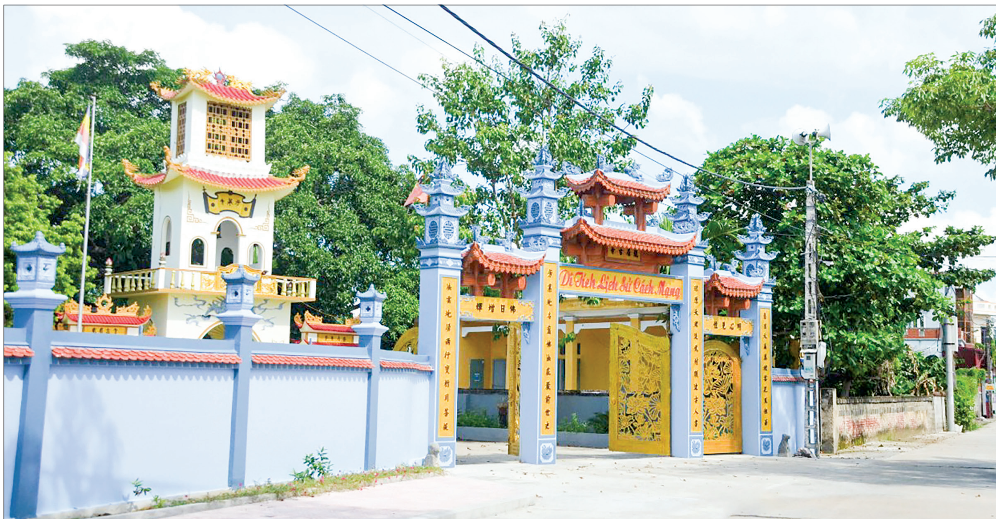
Chùa Phương Quả, xã Quỳnh Nguyên (Quỳnh Phụ).

Một sự trùng lặp ngẫu nhiên là Đoàn Nguyễn Thục, con trai là Đoàn Nguyễn Tuấn và con rể là Nguyễn Du đều là sứ thần ở ba triều đại. Sự kỳ thú là ba triều đại này đối lập, lật đổ nhau và cả ba cha con đều là những danh gia đã đóng góp những áng văn chương truyền đời trong dòng thơ bang giao của nước nhà. Có lẽ, đó là một sự kỳ thú riêng có về "Người Thái Bình - đất Thái Bình".