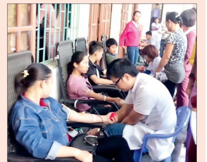
Đoàn viên công đoàn các đơn vị trong huyện tích cực tham gia hiến máu tình nguyện.