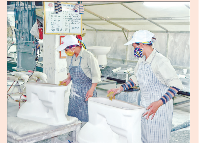
Công ty TNHH Sản xuất kinh doanh sứ Hào Cảnh quan tâm bảo đảm an toàn vệ sinh lao động cho người lao động.