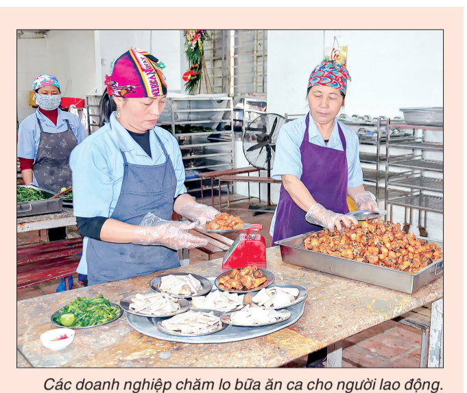
Các doanh nghiệp chăm lo bữa ăn ca cho người lao động.