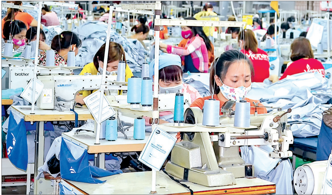
Công nhân Công ty TNHH Ha Hae Việt Nam, Chi nhánh Thái Bình thi đua lao động sản xuất.

Thực hiện Nghị quyết Đại hội lần thứ IX, nhiệm kỳ 2012 - 2017, 5 năm qua, các cấp công đoàn huyện Tiên Hải luôn đổi mới nội dung, phương thức hoạt động với phương châm hướng về cơ sở, từ đó vị thế của tổ chức công đoàn ngày càng được nâng cao, đời sống người lao động từng bước được cải thiện.