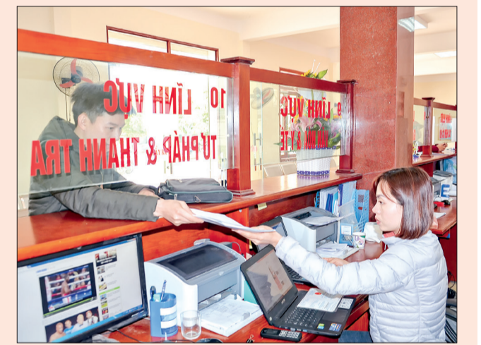
Đoàn viên công đoàn Trung tâm Hành chính công huyện Tiên Hải hướng dẫn người dân các thủ tục hành chính.