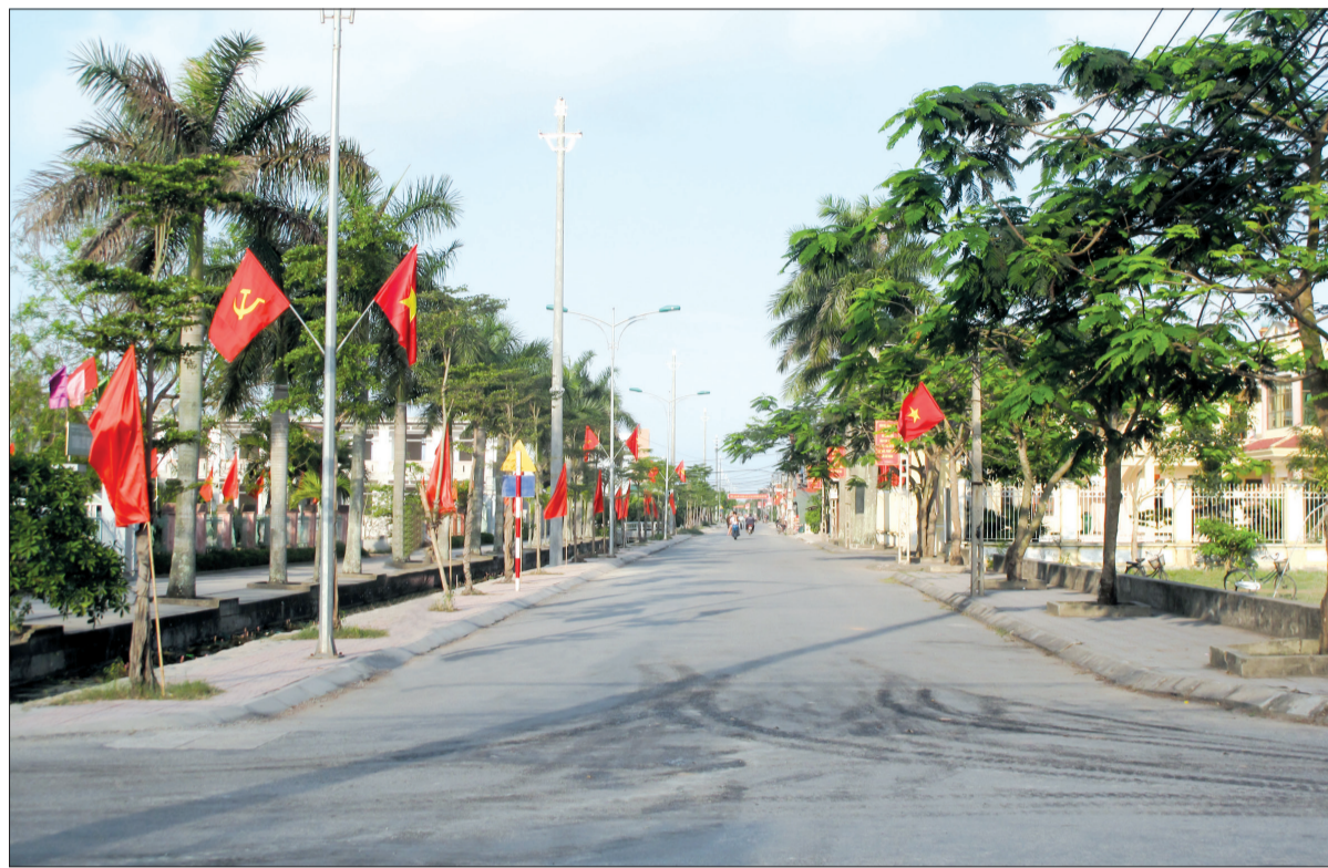
Diện mạo nông thôn mới nâng cao xã Đông Lâm (Tiên Hải).