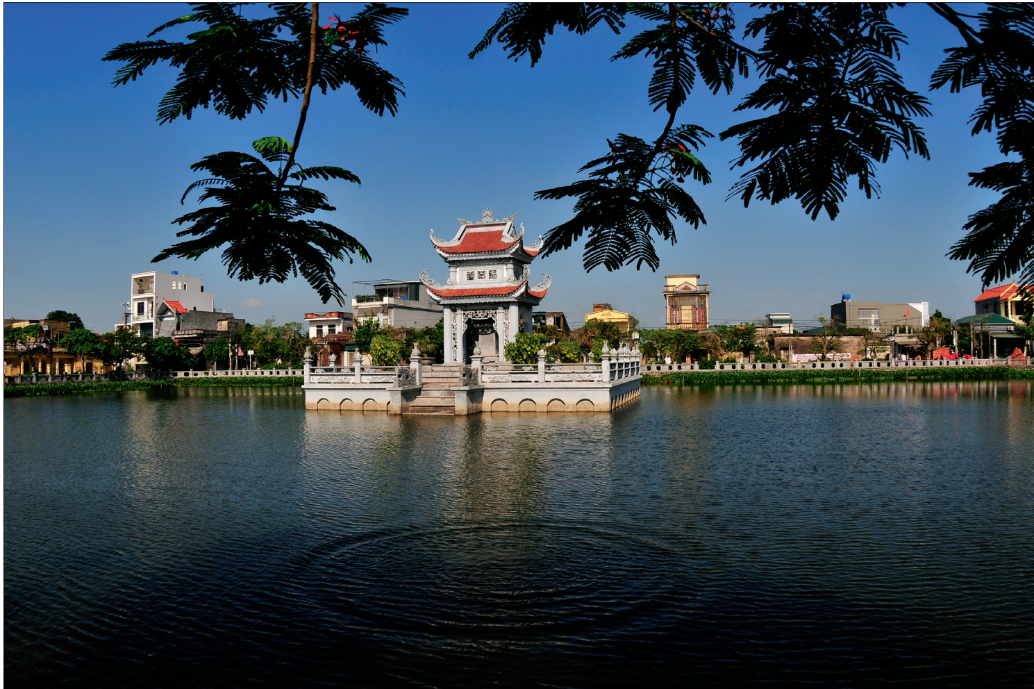
Khu tưởng niệm Doanh điền sứ Nguyễn Công Trứ tại thị trấn Tiên Hải - người có công lao lớn trong việc thành lập huyện Tiên Hải.

Nhằm tăng cường chính sách cai trị ở Bắc Kỳ, thực dân Pháp thực hiện “chia để cai trị”. Tháng 3/1890, toàn quyền Pháp tại Đông Dương Doumer quyết định thành lập tỉnh Thái Bình. Ngoài bổ nhiệm người đứng đầu bộ máy cai trị cấp tỉnh ở Bắc Kỳ là một viên Công sứ hoặc một viên Phó sứ người Pháp, thực dân Pháp thúc ép triều đình Huế cử quan lại về vùng đất “ven bờ cuối bãi”, tụ tập dân siêu tán khẩn hoang. Các viên Công sứ nắm tình hình và cai trị các tỉnh thông qua hệ thống quan lại của triều đình Huế. Người Pháp coi trọng bộ máy quản lý làng xã, họ duy trì toàn bộ các thiết chế phong kiến An Nam đã tri tri, thậm chí khuyến khích “nó” tri tri hơn. Một chính trị gia người Pháp tên Luy-rô (Luro) trong Giáo trình về tổ chức hành chính ở An Nam thừa nhận đó là “...một tổ chức đã tồn tại theo truyền thống từ thời rất xa xưa, tổ chức đó chúng ta không nên động chạm tới kéo làm dân chúng bất bình, xú sở rối loạn”.