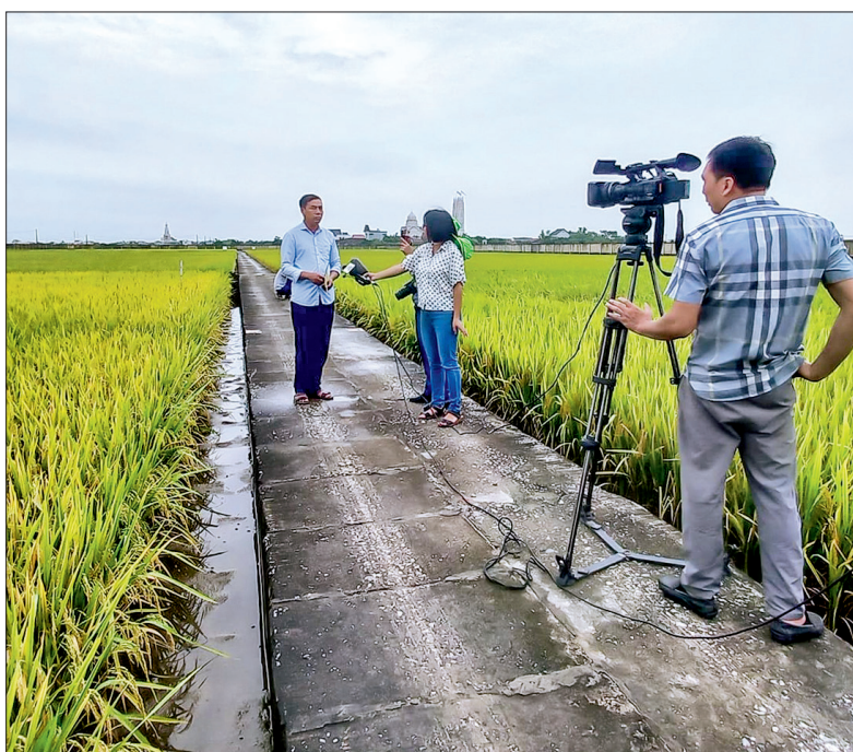
Phóng viên Đài PTTH Thái Bình tác nghiệp.