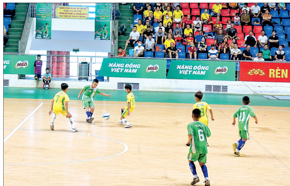
Đội Vietcombank Thái Bình (trang phục màu xanh) được đánh giá cao tại vòng loại bảng Thái Bình giải bóng đá nhi đồng toàn quốc.

Trong suốt những ngày diễn ra tại Thái Bình, các giải cầu lông, bóng đá