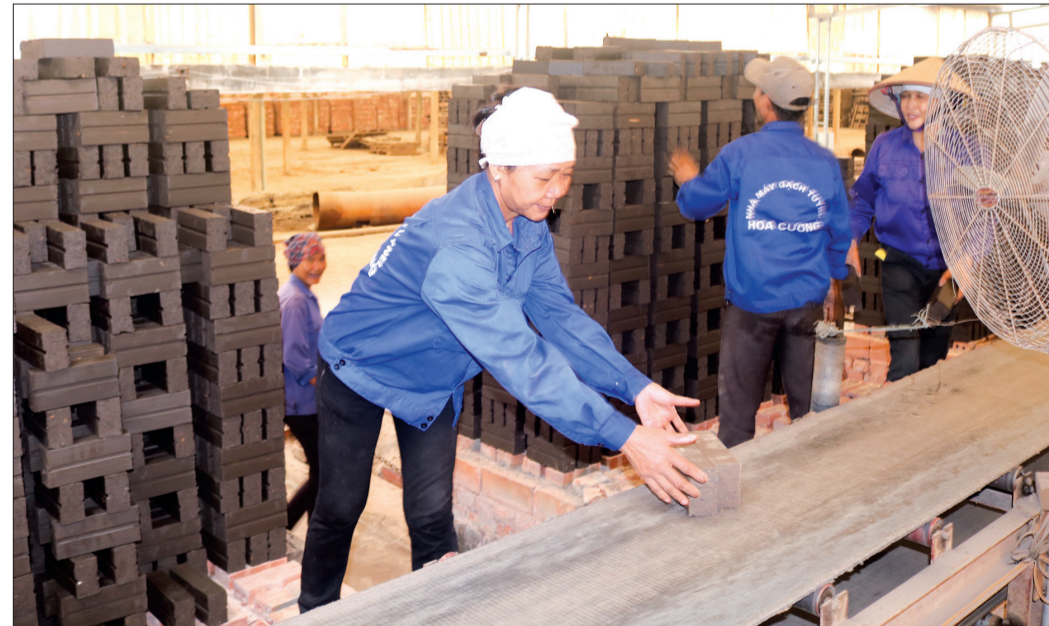
Dây chuyền băng tải tự động giúp công nhân Công ty TNHH Vật liệu xây dựng hạ tầng Hoa Cương giảm sức lao động nặng nhọc.