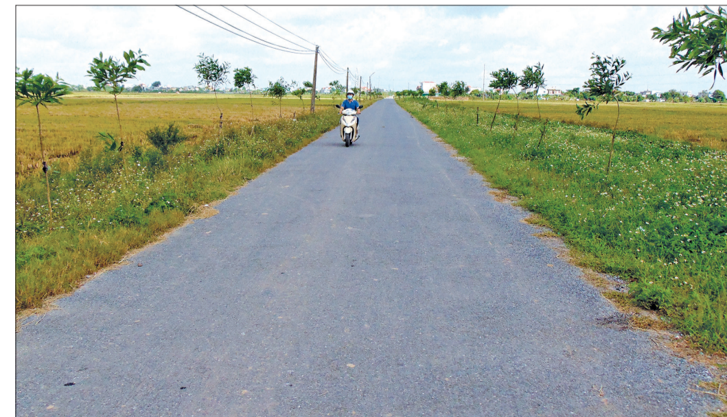
Hàng cây keo trồng hai bên đường vào xã Vũ Lạc từ nguồn kinh phí xã hội hóa.