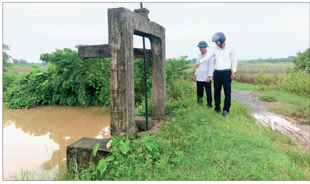
Xã Vũ Văn (Vũ Thu) thường xuyên kiểm tra tuyến đê bồi để kịp thời phát hiện, báo cáo xử lý các sự cố.

Trước những diễn biến phức tạp của thời tiết, khí hậu trong mùa mưa bão năm nay, ngành chức năng và các địa phương đang tích cực triển khai đồng bộ các biện pháp, sẵn sàng phương án bảo vệ an toàn tính mạng, tài sản cho người dân vùng bồi.