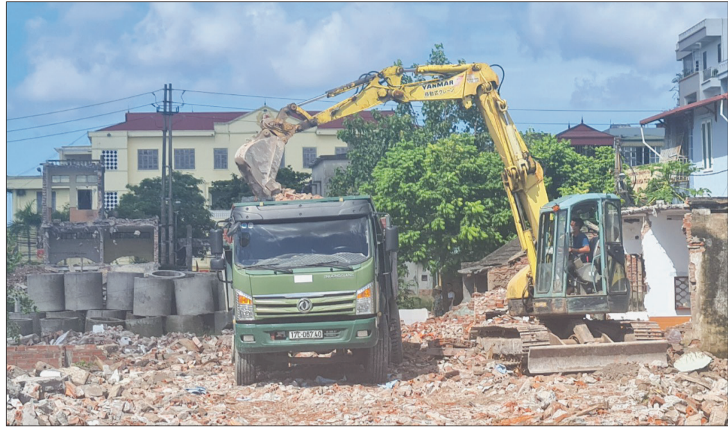
Đường Đinh Tiên Hoàng (thành phố Thái Bình) sau nhiều năm vướng mắc về mặt bằng nay đã được khơi thông.

Một trong những nguyên nhân dẫn đến tình trạng khiếu kiện, khiếu nại về đất đai là do những vướng mắc phát sinh liên quan đến công tác bồi thường GPMB. Vì vậy, Thái Bình luôn xác định cần công khai, minh bạch, bảo đảm hài hòa lợi ích của người dân, nhà đầu tư và nhà nước trên cơ sở đúng quy định của pháp luật.