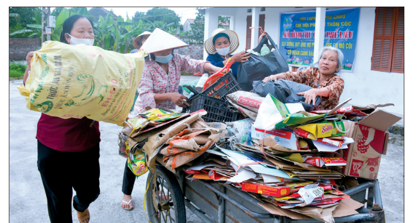
Phụ nữ thôn Cốc, xã Phú Châu (Đông Hưng) thu gom phế liệu gây quỹ học.

Thời gian qua, cán bộ, hội viên, phụ nữ trong tỉnh đã tích cực hưởng ứng, chung tay tham gia xây dựng nông thôn mới, đô thị văn minh bằng những công trình, phần việc cụ thể, thiết thực.