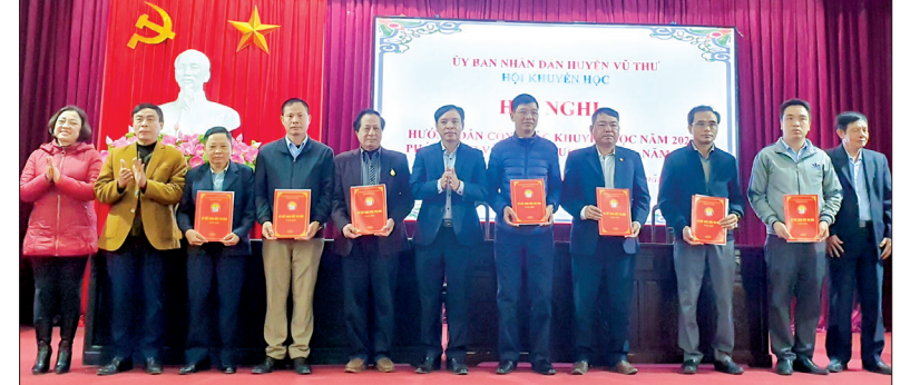
Đại diện các cụm thi đua khuyến học huyện Vũ Thư ký giao ước thực hiện công tác khuyến học năm 2023.

Sáng ngày 16/2, Hội Khuyến học huyện Vũ Thư tổ chức hội nghị hướng dẫn thực hiện các nhiệm vụ trọng tâm công tác khuyến học, phát động và ký giao ước thi đua năm 2023.