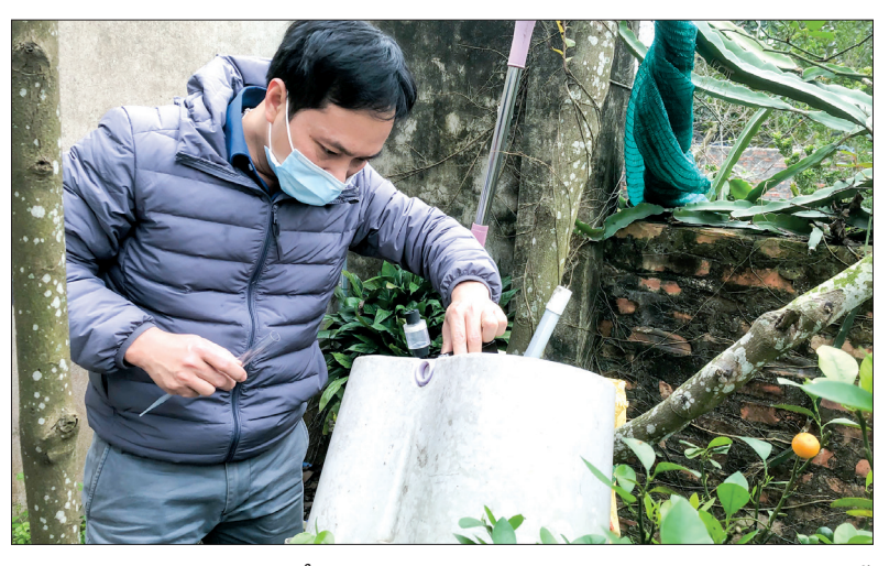
Cán bộ Trung tâm Kiểm soát bệnh tật tỉnh giám sát chỉ số bọ gậy, muỗi tại khu vực ghi nhận ca mắc sốt xuất huyết ở xã Vũ Lạc.