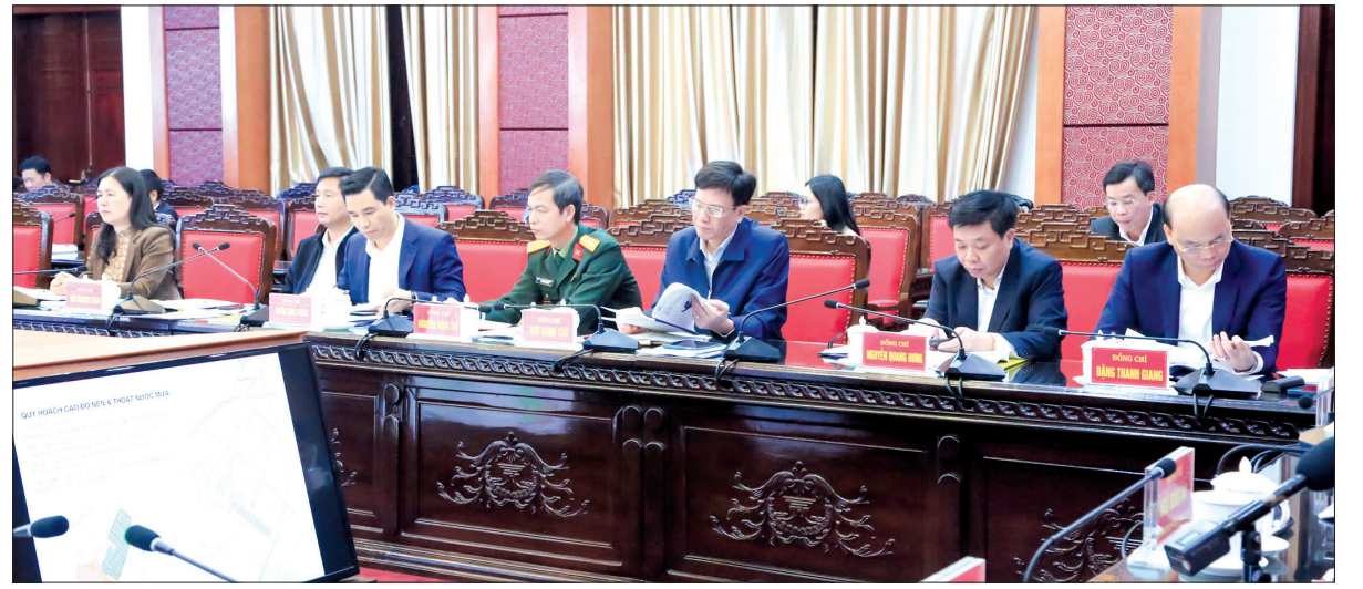
Các đại biểu dự hội nghị.