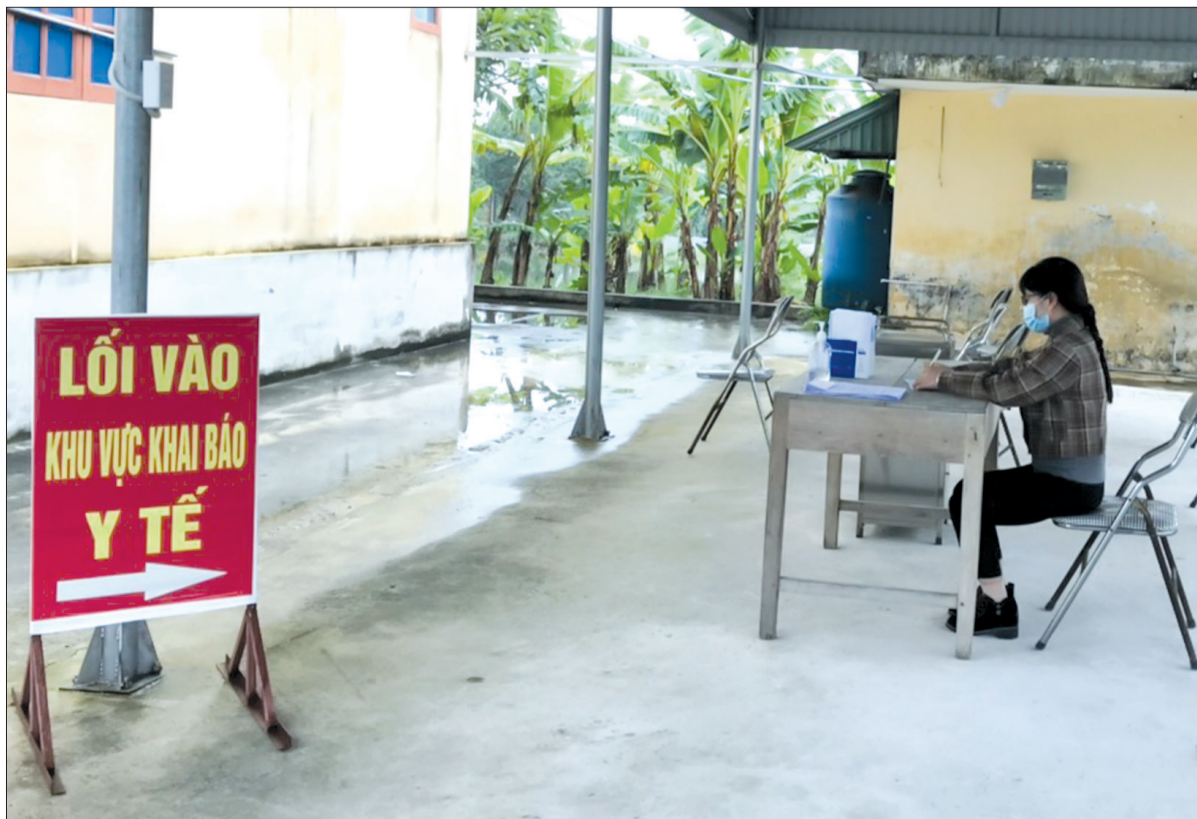
Người trở về từ các tỉnh, thành phố khác đến khai báo y tế tại Trạm Y tế xã Việt Thuận (Vũ Thư).