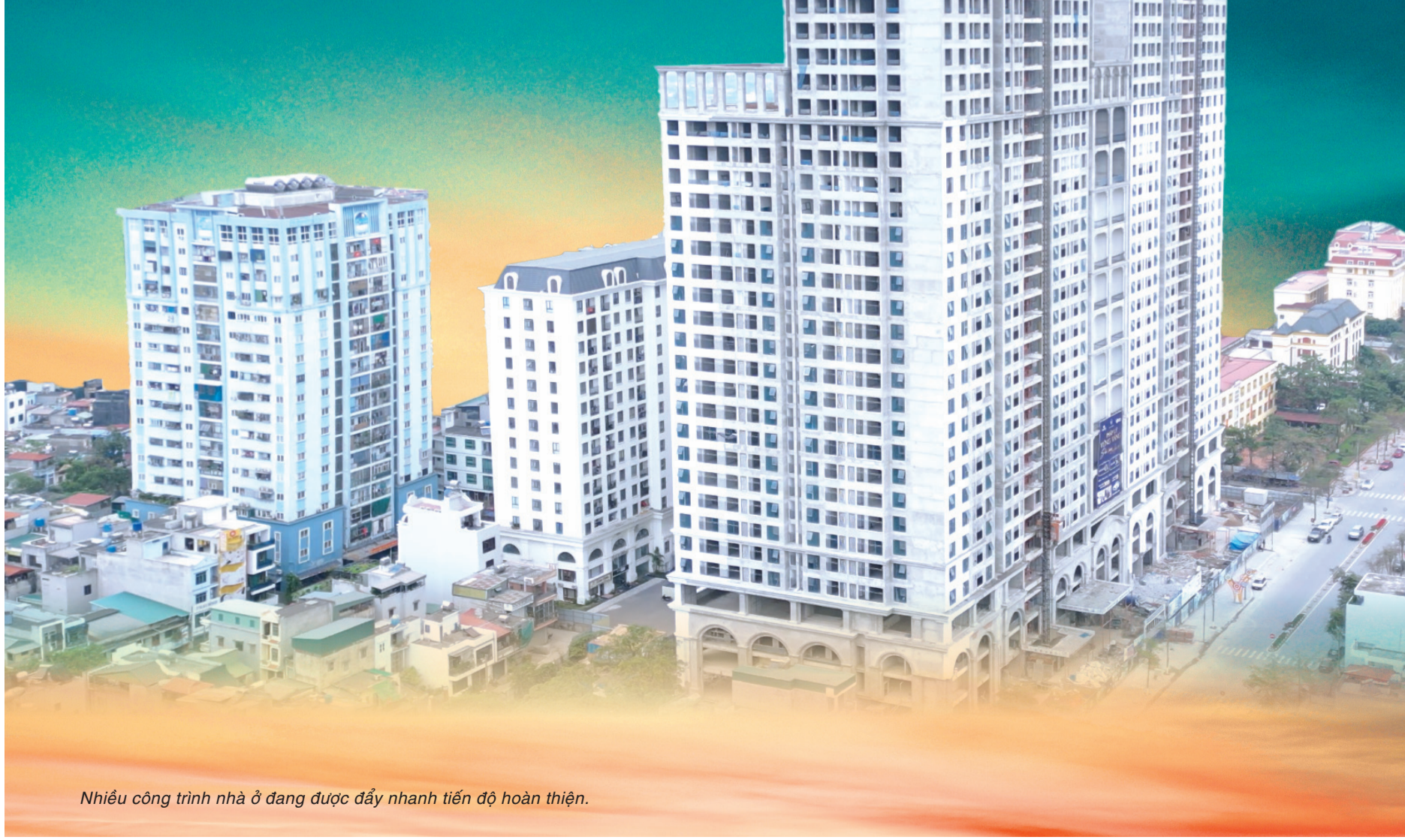
Nhiều công trình nhà ở đang được đẩy nhanh tiến độ hoàn thiện.