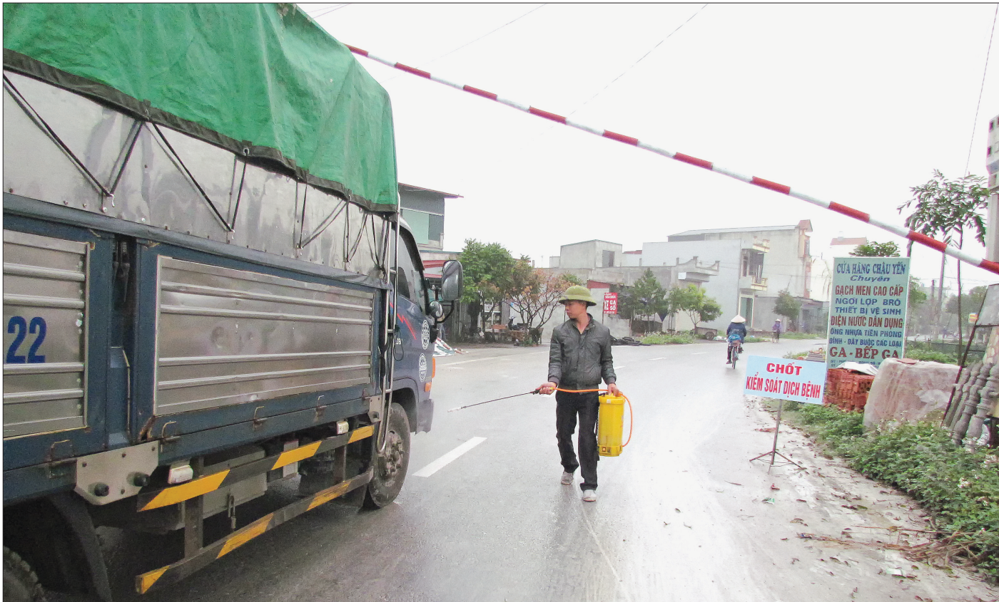
Phun hóa chất phòng, chống bệnh dịch tả lợn châu Phi tại Hưng Hà.

Bệnh dịch tả lợn châu Phi tiếp tục diễn biến phức tạp đã gây tổn thất nặng nề cho người chăn nuôi huyện Hưng Hà, thậm chí khiến nhiều gia đình mất trắng và khó khôi phục lại sản xuất.