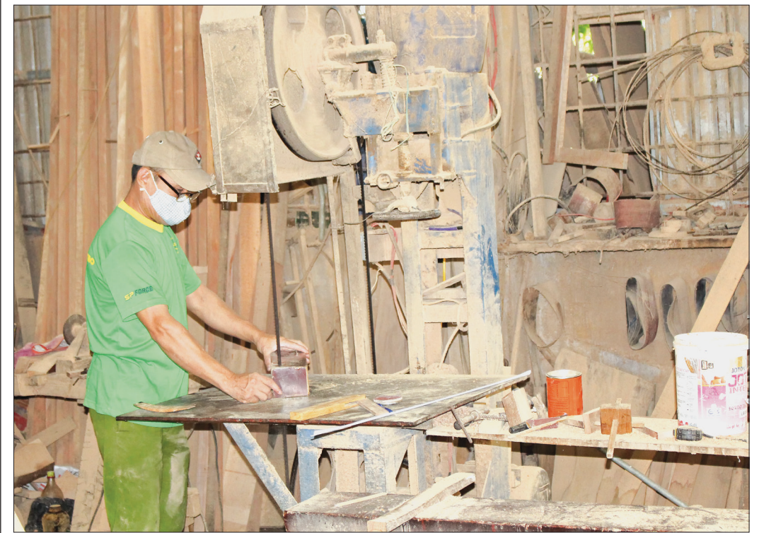
Sử dụng vốn vay hiệu quả, cơ sở sản xuất đồ gỗ Hoàn Thơm (thôn Lục Nam, xã Thái Xuyên, huyện Thái Thụy) đạt doanh thu trung bình từ 400 - 500 triệu đồng/tháng.

Là tổ chức tín dụng hoạt động gần dân, sát dân, từ khi thành lập đến nay, Quỹ Tín dụng nhân dân (TDND) Thái Xuyên (Thái Thụy) luôn tạo mọi điều kiện thuận lợi để các thành viên được vay vốn, từ đó góp phần đẩy lùi tín dụng đen, xóa đói giảm nghèo, phát triển kinh tế địa phương.