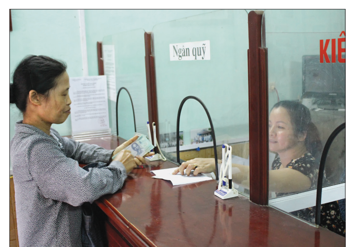
Hoạt động giao dịch tại Quỹ Tín dụng nhân dân Thái Xuyên.