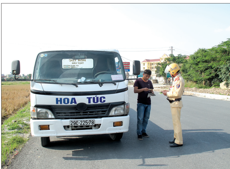
Lực lượng cảnh sát giao thông huyện Thái Thụy kiểm tra phương tiện.

tri nghiệm túc các quy trình, quy chế, kỷ luật công tác; chấn chỉnh tư thế, lễ tiết, tác phong, tinh thần trách nhiệm với tinh thần “Vi nhân dân phục vụ”. Nhằm làm tốt công tác bảo đảm an ninh chính trị, trật tự an toàn xã hội, từng đội nghiệp vụ đã xây dựng kế hoạch, tăng cường cán bộ, chiến sĩ xuống cơ sở tuyên truyền chủ trương của Đảng, chính sách, pháp luật của Nhà nước tới các tầng lớp nhân dân, kịp thời giải quyết các vụ việc, đơn thư khiếu nại, tố cáo, tháo gỡ những khó khăn, vướng mắc về an ninh trật tự ngay tại cơ sở, không để hình thành các điểm “nóng”, phức tạp. Cùng với đẩy mạnh tuyên truyền thì công tác đấu tranh phòng, chống tội phạm được tập trung chỉ đạo quyết liệt. Trong đó liên tục mở các đợt cao điểm tấn công các loại tội phạm theo từng chuyên đề, do đó các vụ việc xảy ra đều được phát hiện và điều tra xử lý kịp thời, kiên quyết không để hình thành ổ nhóm, gây nhức nhối tại các địa bàn dân cư. Từ