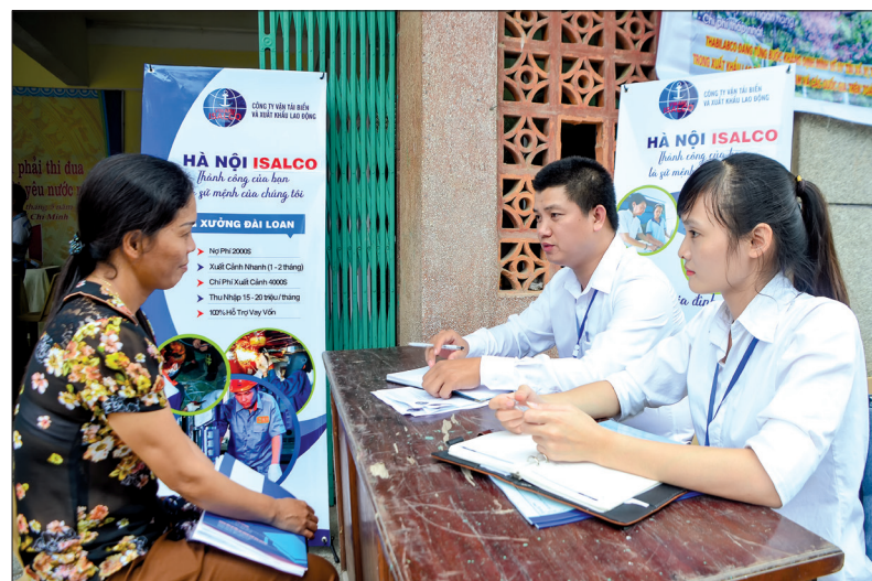
Tư vấn về xuất khẩu lao động cho thân nhân người lao động tại huyện Quỳnh Phụ.

Những năm qua, tình trạng lao động đi xuất khẩu tại Hàn Quốc hết hạn hợp đồng không về nước ngày càng phổ biến, ảnh hưởng trực tiếp đến hoạt động xuất khẩu lao động (XKLD). Vì vậy, việc đẩy mạnh tuyên truyền nâng cao nhận thức cho người lao động và thân nhân của họ đang được các cấp, các ngành và các địa phương trong tỉnh quan tâm.