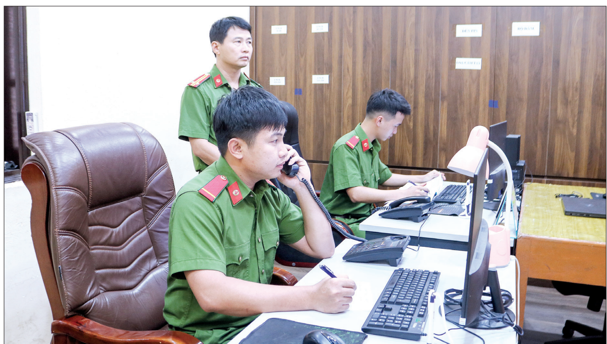
Tổng đài 114, Phòng Cảnh sát phòng cháy, chữa cháy và cứu nạn, cứu hộ, Công an tỉnh thường trực tiếp nhận thông tin của người dân.

Hồi 20 giờ 51 phút ngày 6/3/2024, Trung tâm nhận và xử lý tin báo cháy, tai nạn, sự cố, Phòng Cảnh sát phòng cháy, chữa cháy và cứu nạn, cứu hộ (PCCC và CNCH), Công an tỉnh nhận được tin báo cháy qua máy điện thoại 114 của một người đàn ông tự xưng tên là Hùng, số điện thoại 0523015xxx báo tin cháy tại nhà kho xưởng vải có diện tích khoảng 50m 2 , có người đang mắc kẹt bên trong tại một xã mới sáp nhập trên địa bàn huyện Đông Hưng. Sau quá trình xác minh thông tin, người báo cháy tiếp tục khẳng định đám cháy đang xảy ra gần UBND xã. Cảnh sát PCCC và CNCH đã điều 2 xe chữa cháy, 1 xe CNCH cùng lực lượng xuống hiện trường thực hiện nhiệm vụ. Trong quá trình lực lượng chức năng di chuyển, Trung tâm tìm vị trí địa điểm báo cháy trên bản đồ hành chính để hướng dẫn đoàn xe đến hiện trường thuận lợi nhất, sau nhiều lần tìm kiếm thì xác định trên địa bàn huyện Đông Hưng không có tên địa danh của xã mới sáp nhập như người gọi cung cấp. Tiếp tục xác minh thông tin diễn biến vụ cháy thì không liên lạc được lại được với số điện thoại báo cháy, xác định đây là vụ báo cháy giả