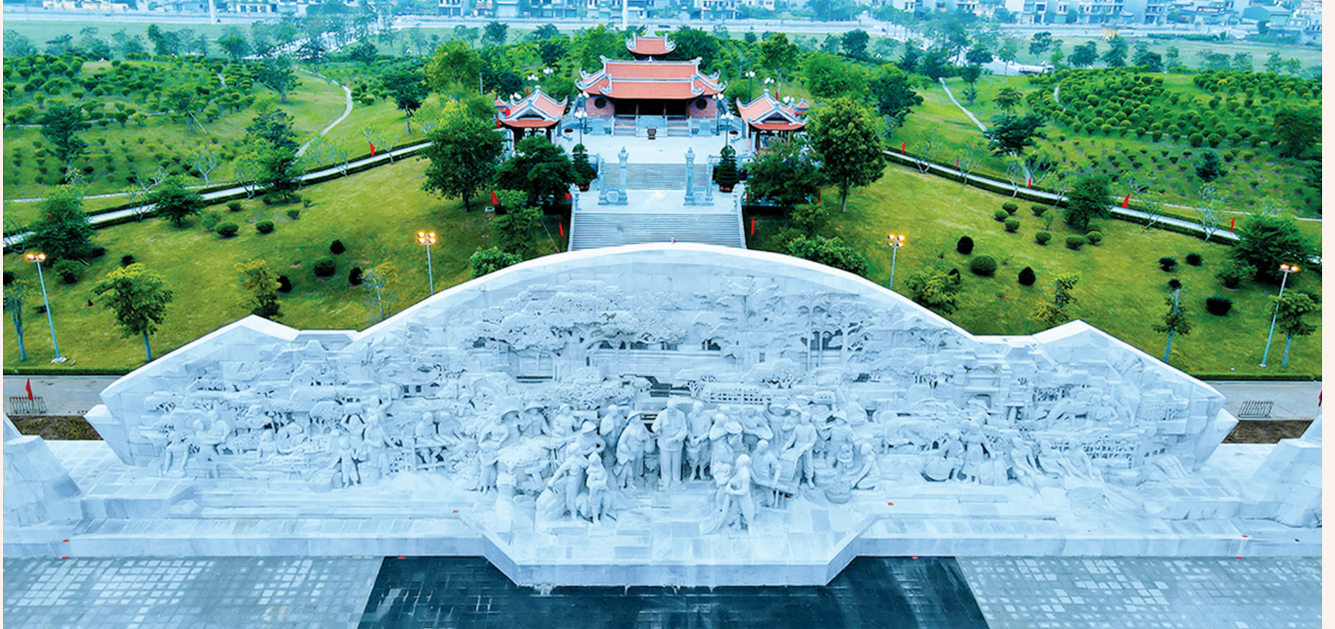
Quần thể Đền thờ Bác Hồ và Tượng đài “Bác Hồ với nông dân Việt Nam” tại phường Hoàng Diệu, thành phố Thái Bình.