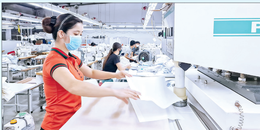
Các doanh nghiệp vừa thi đua sản xuất, kinh doanh vừa thực hiện nghiêm công tác phòng, chống dịch Covid-19.