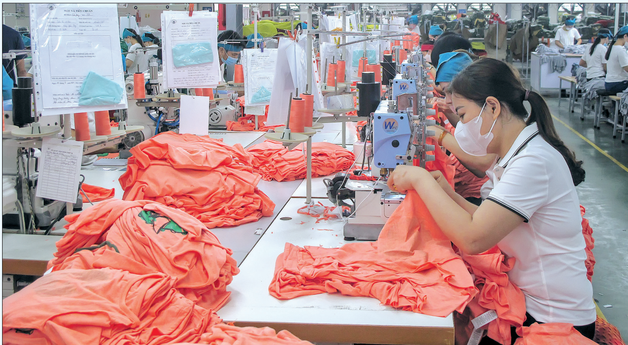
Nhà máy may xuất khẩu Đại Dương (xã Thụy Hải, huyện Thái Thụy) tạo việc làm ổn định cho hơn 1.000 lao động.