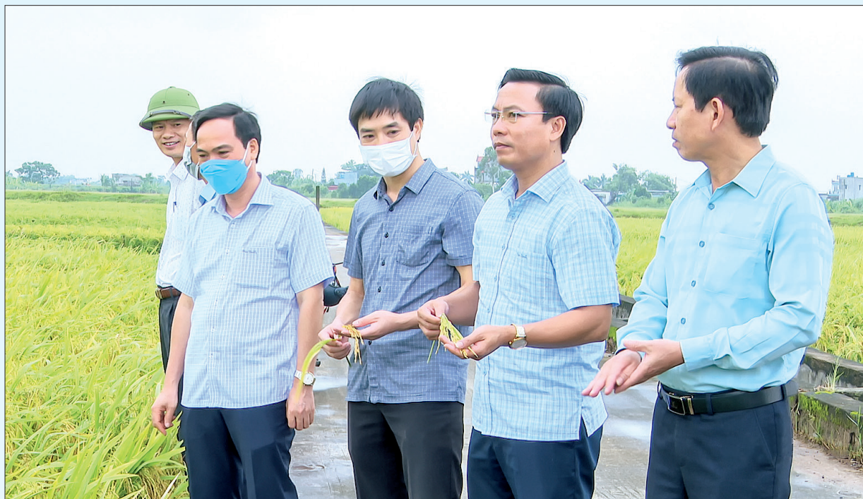
Các đồng chí lãnh đạo huyện Kiến Xương thăm đồng, đánh giá năng suất lúa mùa năm 2021.

Năm 2021 đi qua đánh dấu năm khởi đầu của nhiệm kỳ mới với những khó khăn chưa có trong tiền lệ đối với tất cả các lĩnh vực, ảnh hưởng trực tiếp đến kinh tế - xã hội và đời sống nhân dân trên địa bàn huyện Kiến Xương. Song, với quyết tâm thực hiện hiệu quả mục tiêu kép vừa phòng, chống dịch Covid-19 vừa phục hồi, phát triển kinh tế - xã hội, cả hệ thống chính trị và cộng đồng doanh nghiệp, nhân dân trong huyện đã cùng nhau vượt qua khó khăn, thách thức, đưa kinh tế - xã hội của huyện đạt nhiều kết quả quan trọng.