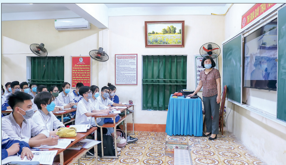
Ngành giáo dục thích ứng an toàn trước diễn biến phức tạp của dịch Covid-19.