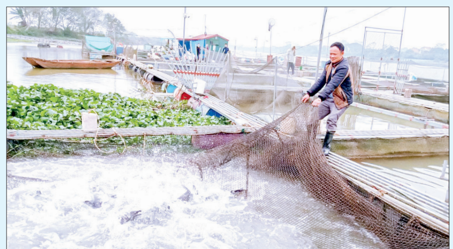
Nuôi cá lồng trên sông cho hiệu quả kinh tế cao.