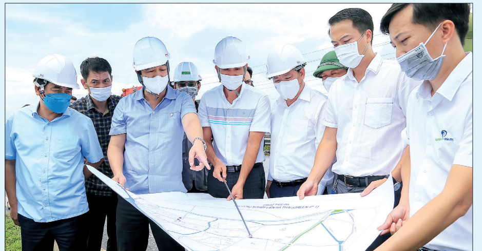
Các đồng chí lãnh đạo tỉnh kiểm tra tiến độ giải phóng mặt bằng, đầu tư hạ tầng khu công nghiệp Liên Hà Thái.