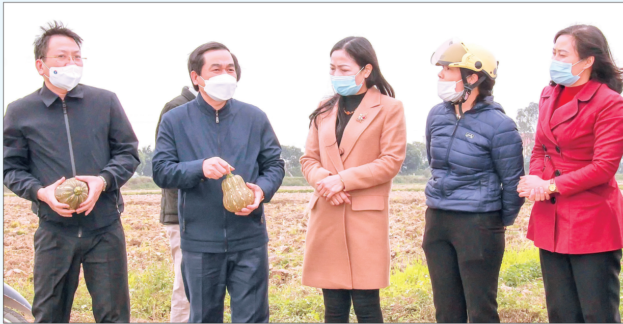
Đồng chí Nguyễn Tiến Thành, Phó Bí thư thường trực Tỉnh ủy, Chủ tịch HĐND tỉnh đi cơ sở kiểm tra, chỉ đạo và động viên nhân dân.

Đi qua một năm hoạt động đầy thách thức và không ít khó khăn song HĐND tỉnh vẫn ghi dấu ấn trong lòng cử tri và nhân dân từ sự linh hoạt để kịp thời thích ứng nhằm tiếp tục khẳng định vai trò cơ quan quyền lực nhà nước ở địa phương. Đặc biệt và trên hết là tinh thần trách nhiệm với những vấn đề thực tiễn, cử tri và nhân dân đặt ra.