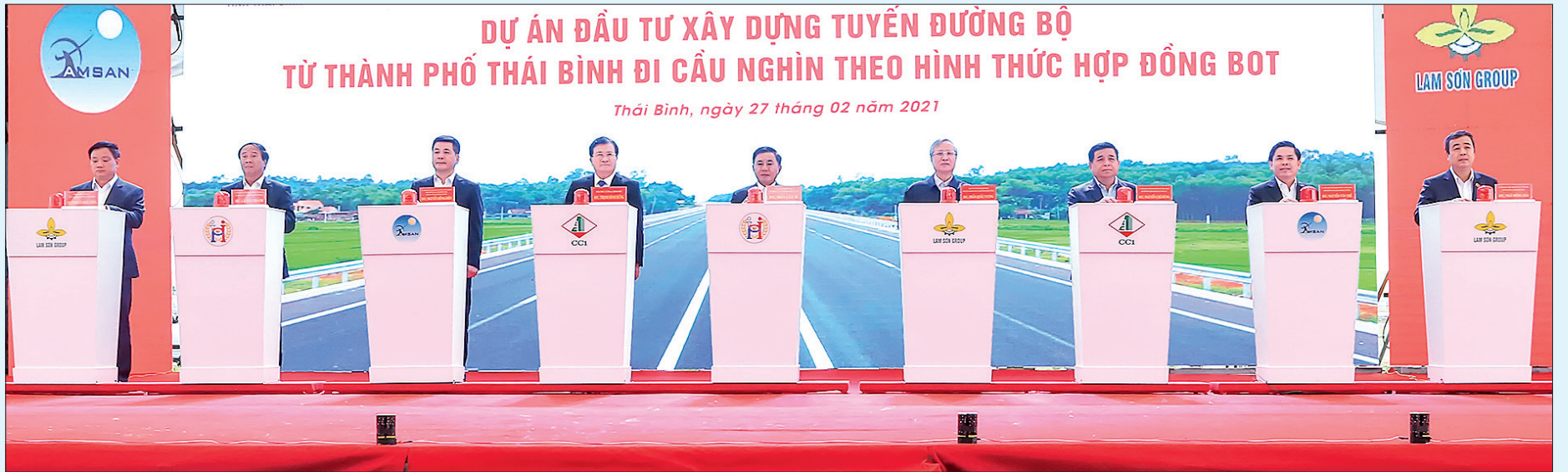
Các đồng chí lãnh đạo nhấn nút khởi công dự án đầu tư xây dựng tuyến đường bộ từ thành phố Thái Bình đi cầu Nghìn.