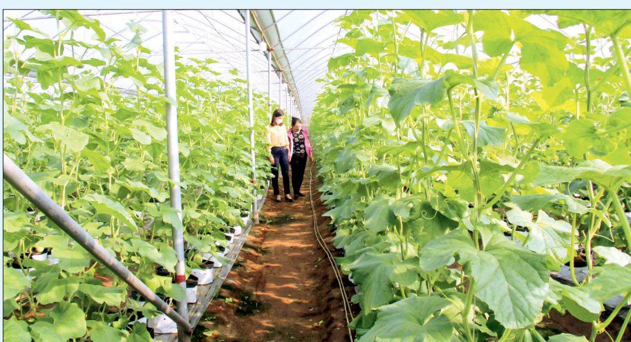
Mô hình trồng dưa lưới công nghệ cao.