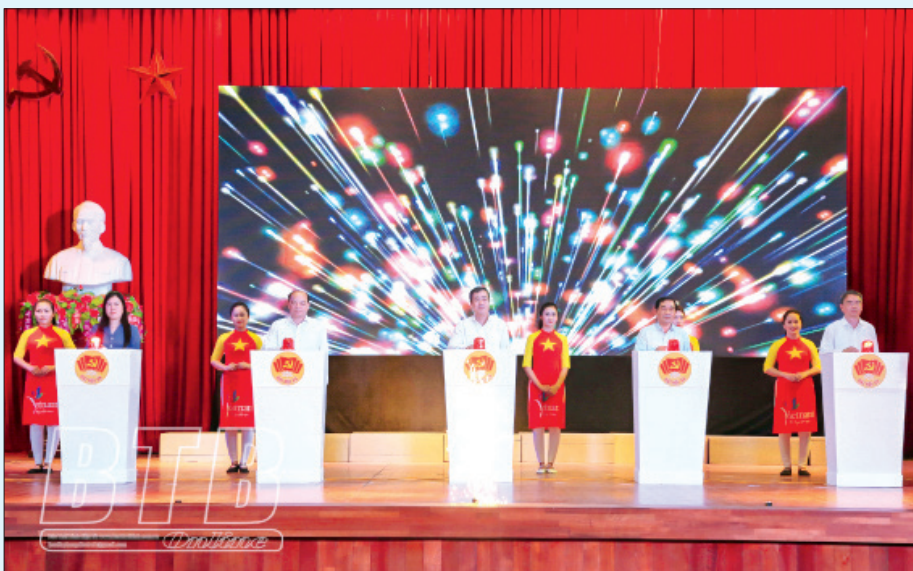
Các đồng chí lãnh đạo tỉnh phát động cuộc thi trắc nghiệm trên internet tìm hiểu Nghị quyết Đại hội đại biểu Đảng bộ tỉnh lần thứ XX.