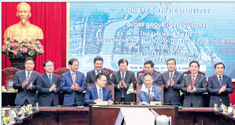
Các đồng chí lãnh đạo chứng kiến lễ ký kết thỏa thuận của các nhà đầu tư.