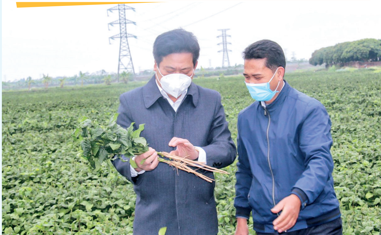
Lãnh đạo huyện Hưng Hà kiểm tra hiệu quả cây ngưu tất trên cánh đồng xã Thống Nhất.

Khép lại năm 2021, trong bối cảnh dịch Covid-19 tiếp tục có những diễn biến phức tạp, tác động tiêu cực đến việc thực hiện các nhiệm vụ phát triển kinh tế - xã hội của huyện, song dưới sự lãnh đạo, chỉ đạo của Tỉnh ủy, HĐND, UBND tỉnh, Đảng bộ và chính quyền huyện Hưng Hà đã điều hành linh hoạt, sáng tạo, quyết liệt, có hiệu quả mục tiêu kép vừa tập trung phòng, chống dịch vừa phục hồi và đẩy mạnh phát triển kinh tế - xã hội, đạt được nhiều kết quả khởi sắc, tự tin vững bước vào năm 2022.