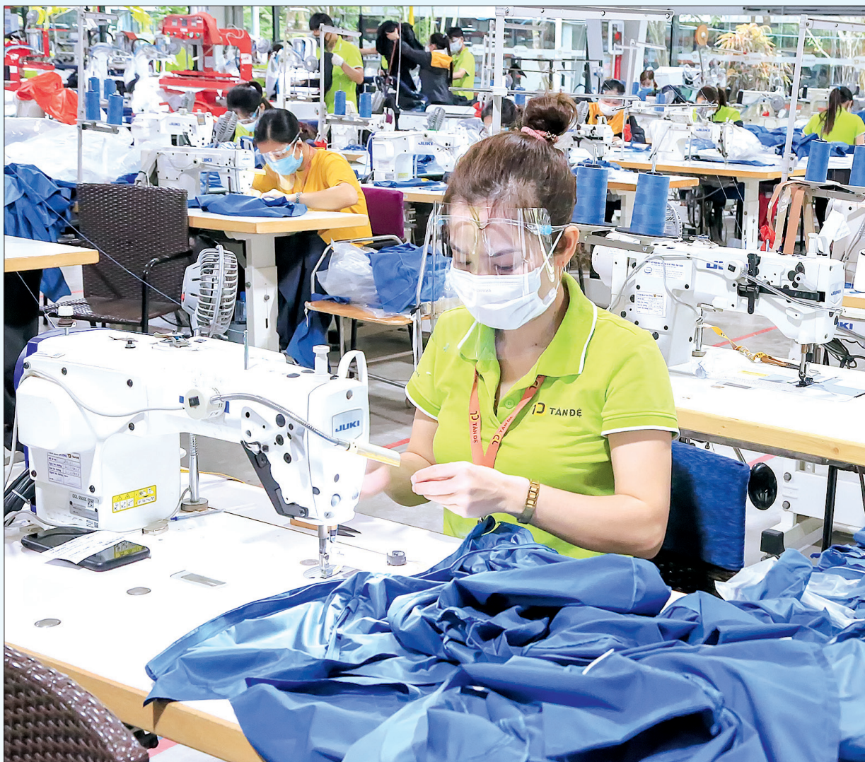
Công ty Cổ phần Sản xuất hàng thể thao chi nhánh Thái Bình có số nộp ngân sách cao.

Năm 2021 khép lại với bứt phá ấn tượng của ngành thuế trong thực hiện nhiệm vụ thu ngân sách nhà nước. Trong bối cảnh dịch Covid-19 diễn biến rất phức tạp tác động lớn đến hoạt động sản xuất, kinh doanh của người dân và doanh nghiệp nhưng ngành thuế vẫn đạt được số thu 10.525 tỷ đồng, đạt 168,1% dự toán với số vượt tuyệt đối 4.265 tỷ đồng, tăng 35,8% so với năm 2020. Với kết quả đó, đây là năm đầu tiên tỉnh Thái Bình có số thu nội địa vượt mốc 10.000 tỷ đồng và là năm có số thu cao nhất từ trước đến nay.