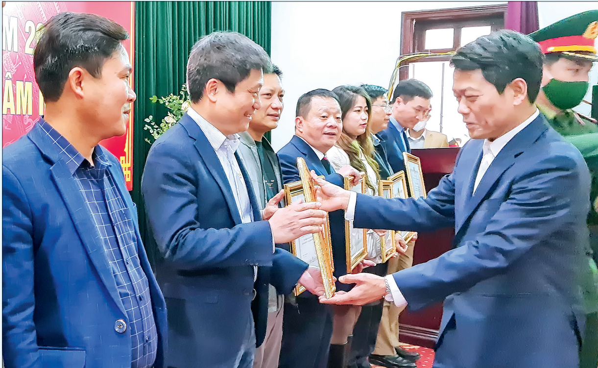
Đồng chí Hoàng Văn Thành, Ủy viên Ban Thường vụ Tỉnh ủy, Bí thư Thành ủy, Chủ tịch HĐND thành phố Thái Bình trao giấy khen cho các doanh nghiệp có nhiều đóng góp trong công tác an sinh xã hội.

Năm 2021 là năm đầu tiên thực hiện nghị quyết đại hội đảng bộ các cấp. Cùng với cả nước và các địa phương trong tỉnh, thành phố Thái Bình chịu ảnh hưởng nặng nề của đại dịch Covid-19. Nhưng với sự quyết tâm, sức mạnh tổng hợp của cả hệ thống chính trị và nhân dân, thành phố Thái Bình đã vượt qua mọi khó khăn, đạt được kết quả tích cực trên các lĩnh vực kinh tế, văn hóa - xã hội, quốc phòng - an ninh. Nhân dịp đầu xuân năm mới 2022, đồng chí Hoàng Văn Thành, Ủy viên Ban Thường vụ Tỉnh ủy, Bí thư Thành ủy, Chủ tịch HĐND thành phố đã dành cho Báo Thái Bình cuộc phỏng vấn về những dấu ấn năm 2021; đồng thời nêu những định hướng tập trung thực hiện để đưa thành phố Thái Bình sớm trở thành đô thị loại I trực thuộc tỉnh Thái Bình.