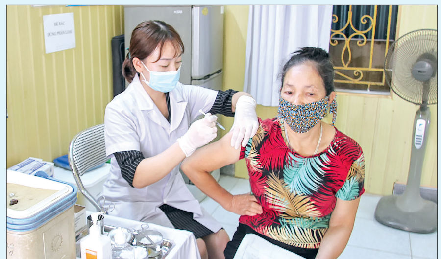
Tiêm vắc-xin phòng Covid-19 cho người dân