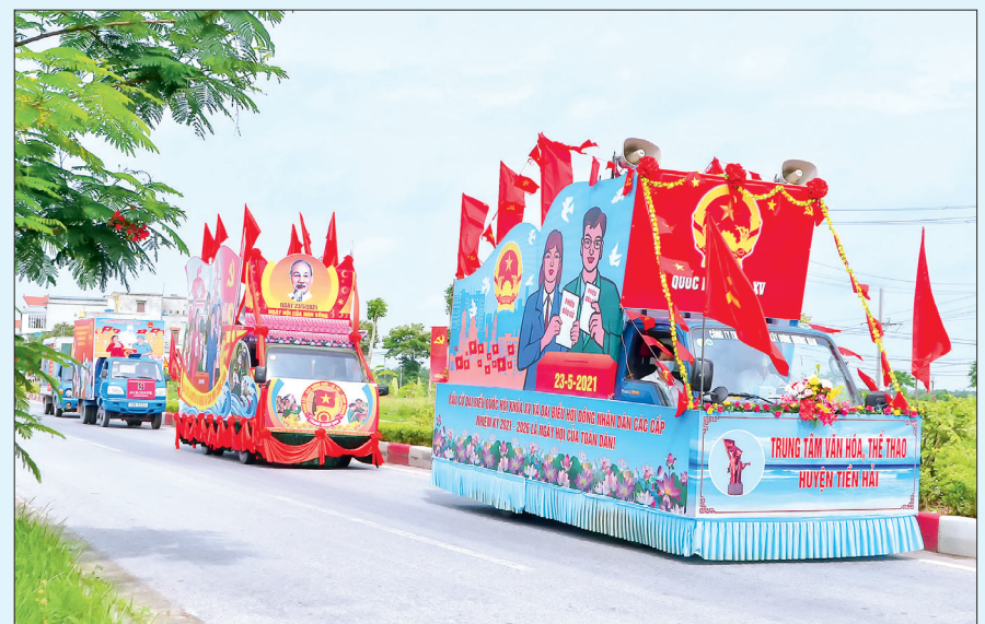
Thái Bình tung bừng ngày hội non sông.