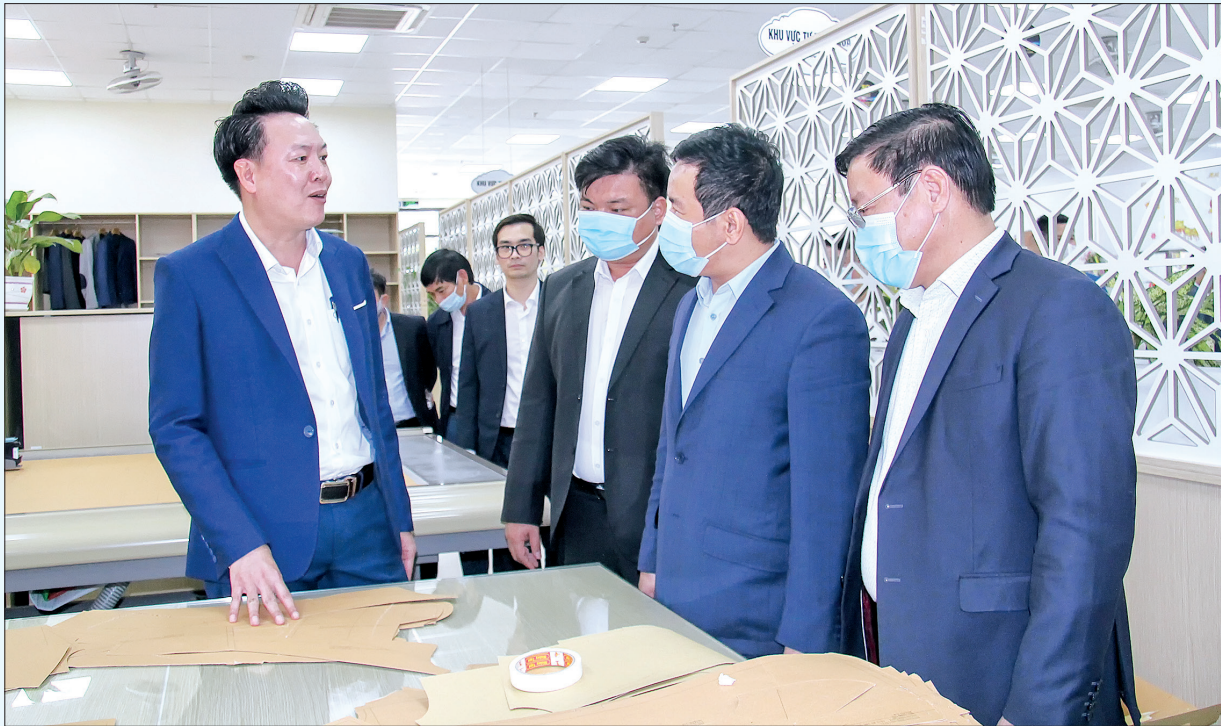
Các đồng chí lãnh đạo huyện Đông Hưng kiểm tra hoạt động sản xuất tại Công ty Cổ phần Đô Lương.

Phó Bí thư Huyện ủy, Chủ tịch UBND huyện Đông Hưng