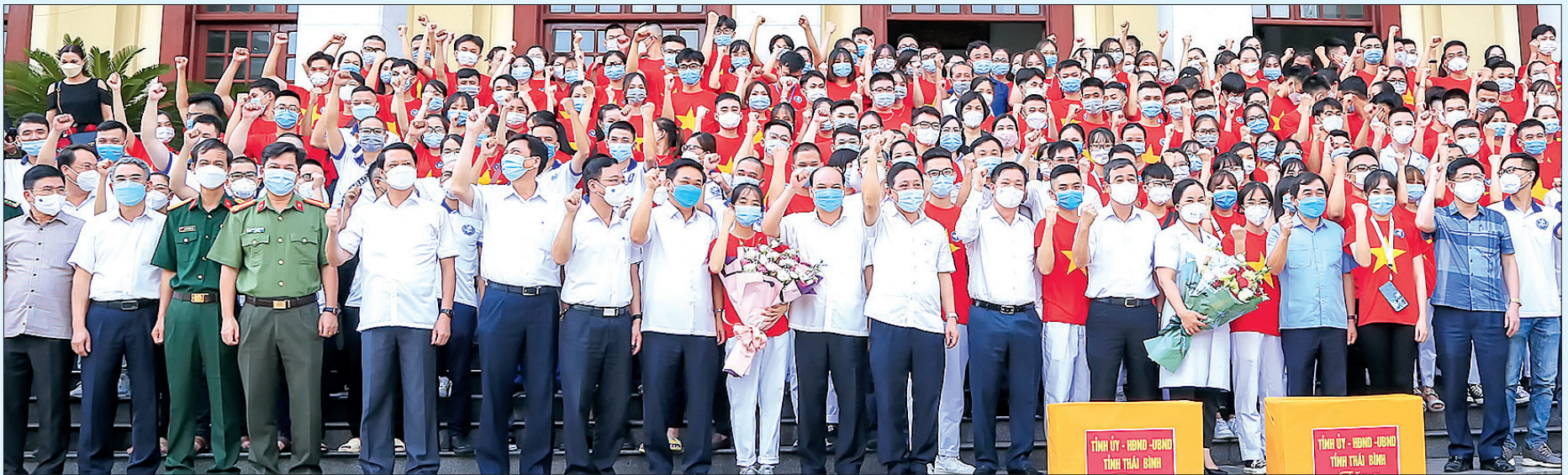
Các đồng chí lãnh đạo tỉnh chụp ảnh lưu niệm với đoàn cán bộ, y bác sĩ, giảng viên, sinh viên Trường Đại học Y Dược Thái Bình lên đường hỗ trợ Thành phố Hồ Chí Minh chống dịch Covid-19, ngày 25/8/2021.