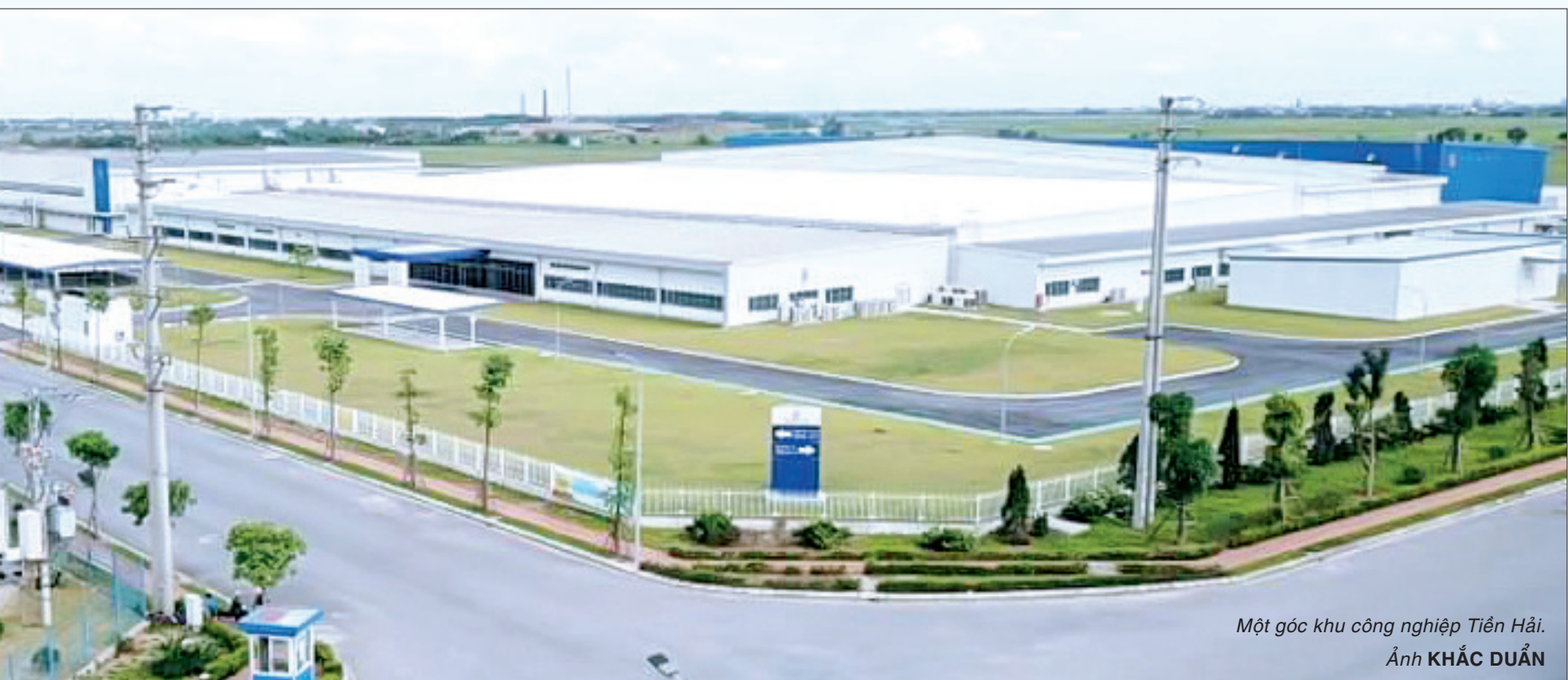
Một góc khu công nghiệp Tiền Hải.

Với kết quả đạt được trong năm đầu triển khai thực hiện Nghị quyết Đại hội XIII của Đảng, Nghị quyết Đại hội đại biểu Đảng bộ tỉnh lần thứ XX cùng với nỗ lực, quyết tâm cao của Đảng bộ, chính quyền và nhân dân, Thái Bình sẽ tiếp tục đổi mới, phát triển và là điểm đến hấp dẫn cho các nhà đầu tư trong và ngoài nước.