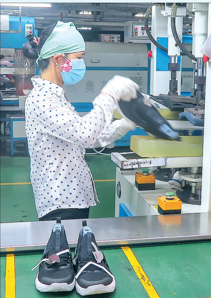
Dây chuyền sản xuất của Công ty TNHH Long Hành Thiên Hạ (cụm công nghiệp Vũ Quý, Kiến Xương).

Nhìn lại chặng đường đã qua và thành quả đã đạt được, Đảng bộ và nhân dân huyện Kiến Xương thêm tự hào về sự khởi sắc của quê hương. Vững tin bước vào xuân mới, với tinh thần đổi mới, đoàn kết, dân chủ, sáng tạo, trách nhiệm cao trước Đảng, trước nhân dân, tranh thủ thời cơ, phát huy mọi nguồn lực, nhất là những kết quả, bài học kinh nghiệm đã có, kiên quyết khắc phục những yếu kém, khuyết điểm, hạn chế, quyết tâm vượt qua mọi khó khăn, thách thức xây dựng Kiến Xương ngày càng giàu đẹp, văn minh.