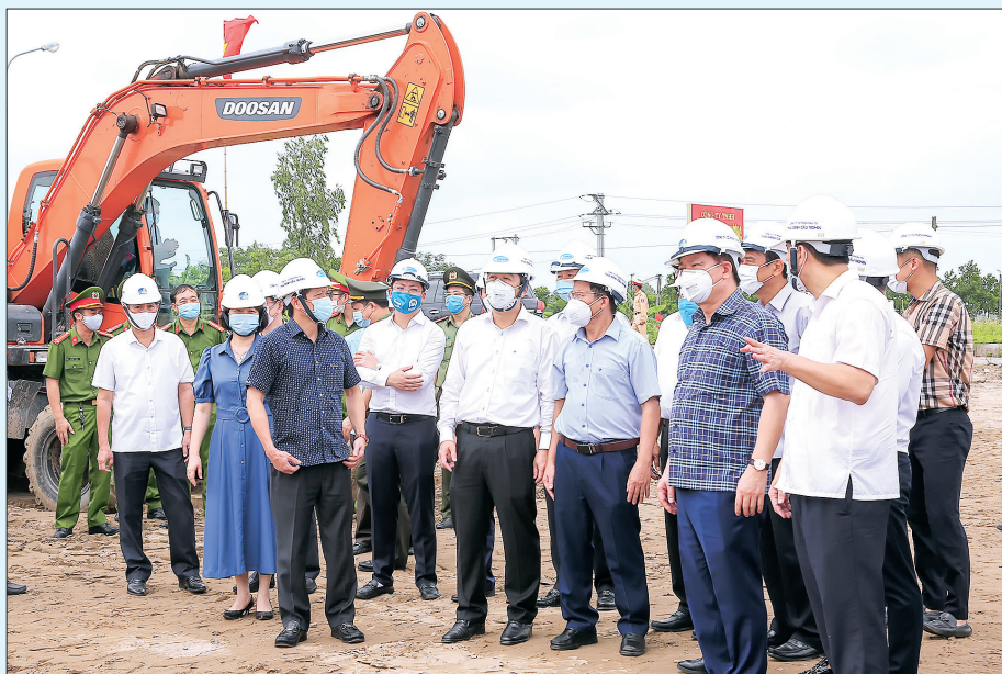
Các đồng chí lãnh đạo tỉnh chứng kiến nhà thầu triển khai thi công gói thầu số 1 dự án xây dựng tuyến đường bộ từ thành phố Thái Bình đi cầu Nghìn.