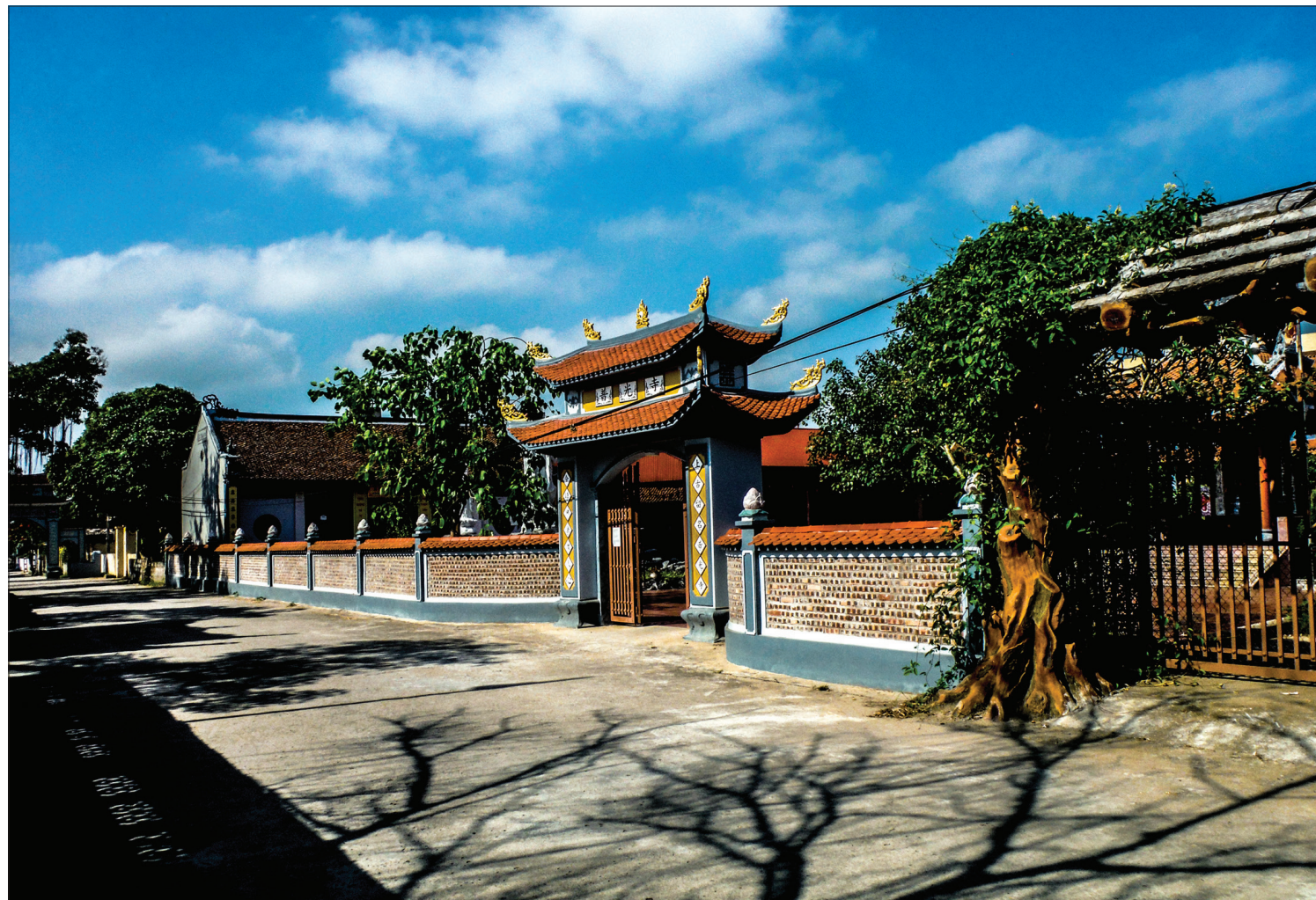
Chùa làng Đìa, xã Hồng An, huyện Hưng Hà được xây dựng từ năm 1238, thời nhà Trần thế kỷ XIII, địa danh cổ được xác định là phủ lỵ Ngự Thiên.

Các nghiên cứu về địa tảng thêm lục địa nước ta đã chỉ ra rằng, trên 2.000 năm trước, đất đai, cương vực tỉnh Thái Bình đã được hình thành, tuy muộn hơn các vùng đất khác nhưng tự nhiên lại ban tặng cho Thái Bình địa thế án ngữ bên bờ Biển Đông cùng sự màu mỡ của miền đất sa bồi, dồi dào nhân lực trẻ cùng với khát vọng chinh phục thiên nhiên hình thành bản lĩnh kiên cường của người dân bên bờ sóng tích tụ qua gian khổ để khai mở đất đai, chống thiên tai, địch họa. Cũng trong gian khó, thiên nhiên cũng hào phóng ban tặng cho Thái Bình vị thế quan trọng bởi ba mặt sông, một mặt biển như ốc đảo trú mật khiến các bậc vương triều, đặc biệt là vương triều Trần thế kỷ XIII coi đây là hậu phương lớn cung cấp sức người, sức của cho các cuộc trường chinh bảo vệ đất nước.