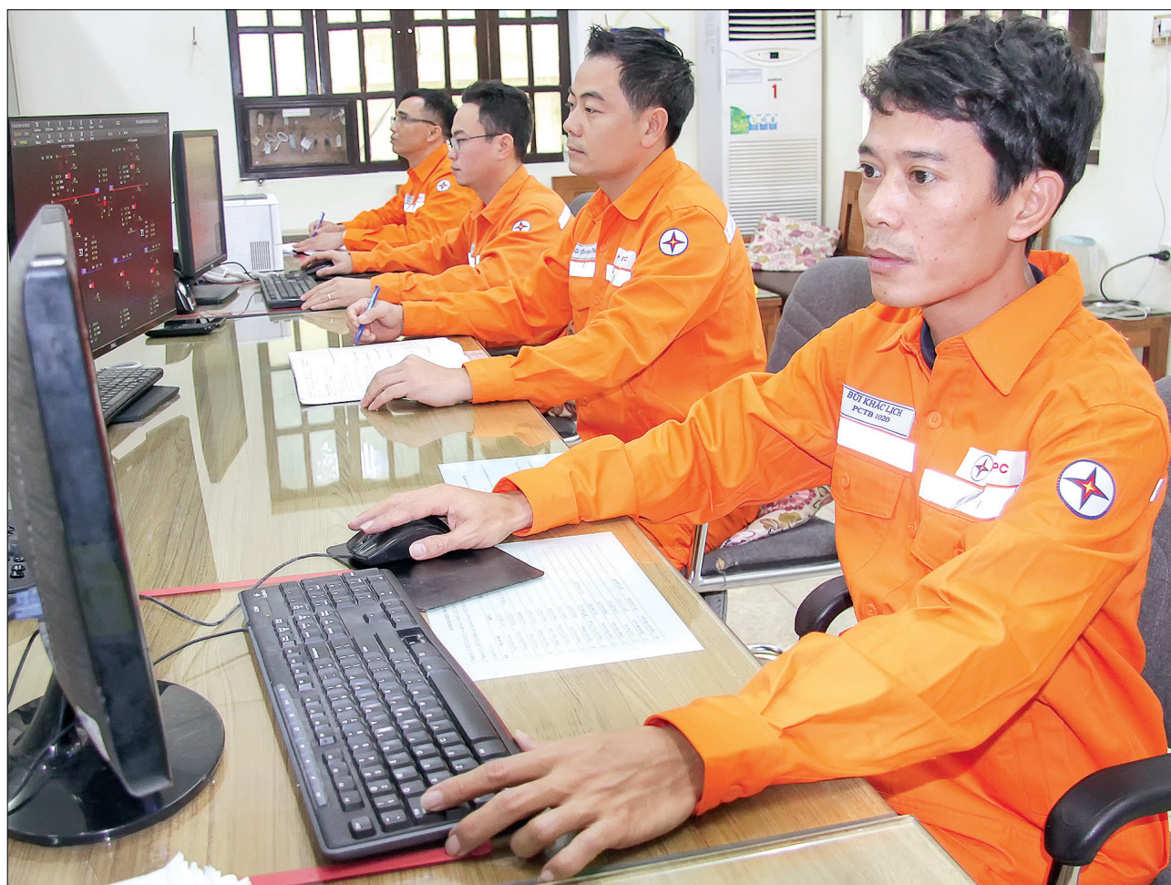
Công nhân Điện lực Thái Bình luôn hoàn thành nhiệm vụ sau mỗi ca trực tết.

Mỗi người một tâm sự nhưng điểm gặp nhau là niềm tự hào, hạnh phúc của những người công nhân Công ty Điện lực Thái Bình tất cả không ngoài mục đích là cung cấp an toàn, ổn định dòng điện, phục vụ nhân dân trong tình những ngày vui xuân đón tết Quý Mão 2023.