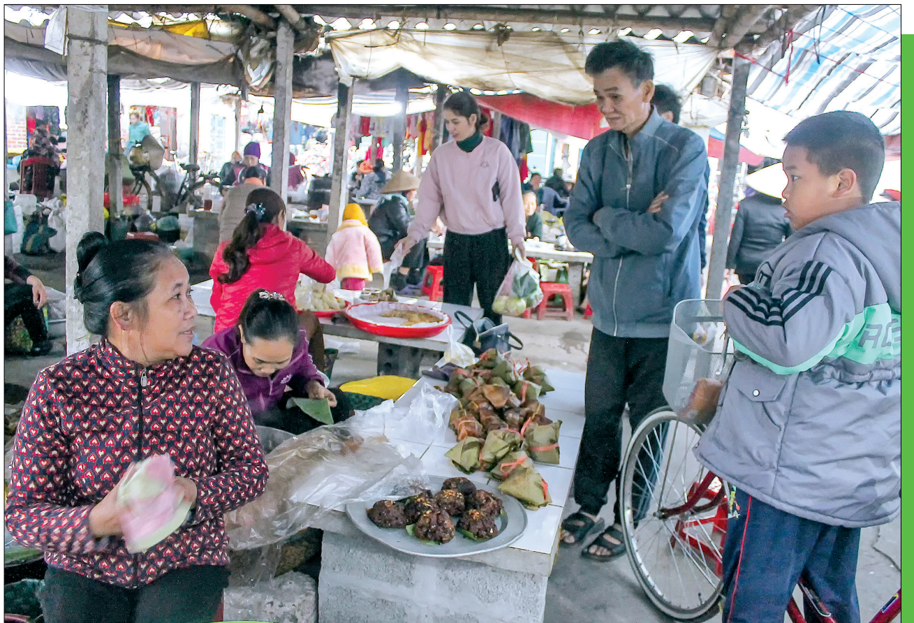
Các món bánh quà buổi sáng giúp người dân làng vườn “ấm bụng” và yên tâm bắt đầu một ngày lao động, học tập.

Bánh bèo chợ Thuận Vi là món bánh được nấu gần giống bánh đúc nhưng được đổ trong chiếc lá chuối cuốn tròn, có một lỗ nhỏ ở giữa chứa hành mỡ phi, nhìn từ trên xuống giống như chiếc lá bèo bồng. Người làng Thuận Vi quen dùng mắm ớt để chấm khi ăn bánh bèo. Mỗi chiếc bánh bèo 5.000 đồng, trẻ nhỏ, người già thông thường chỉ ăn 1 chiếc là đã no. Món bánh dân dã, rẻ tiền nhưng để lại thương nhớ trong lòng bao người dân làng