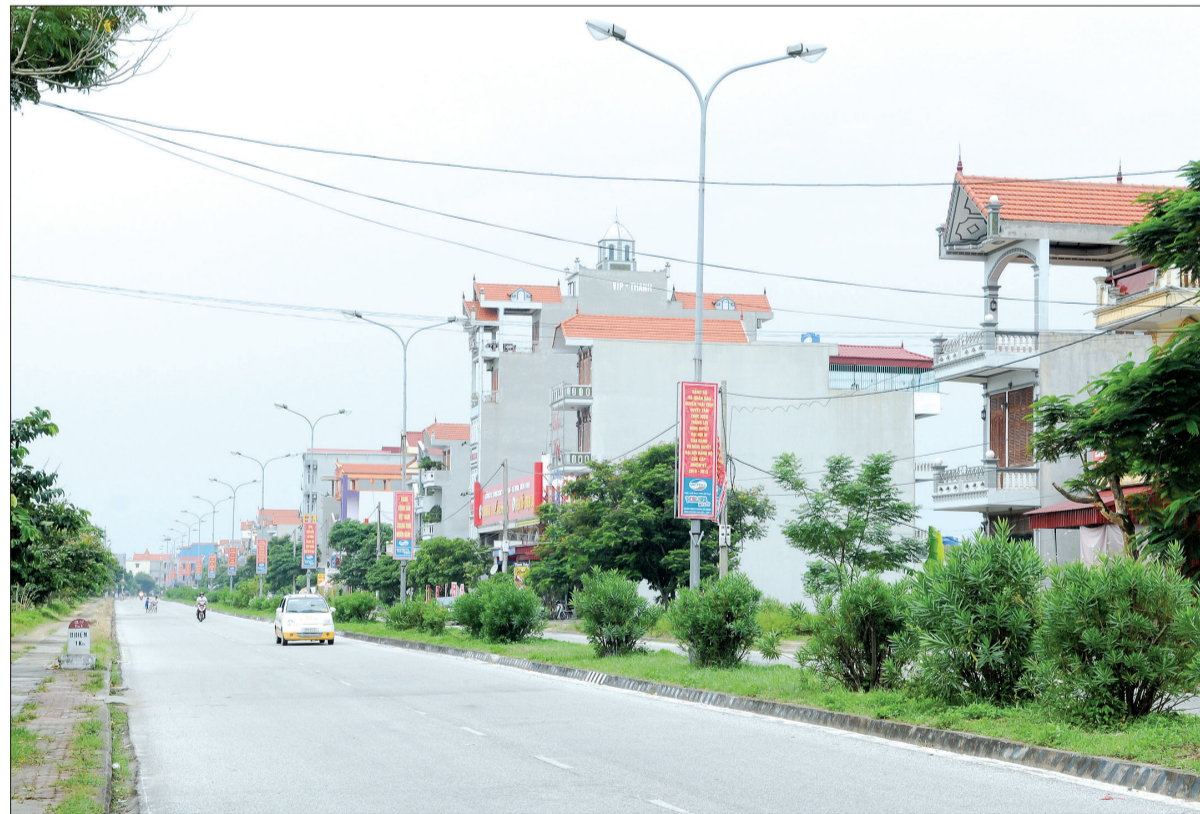
Thị trấn Diêm Điền (Thái Thụy).