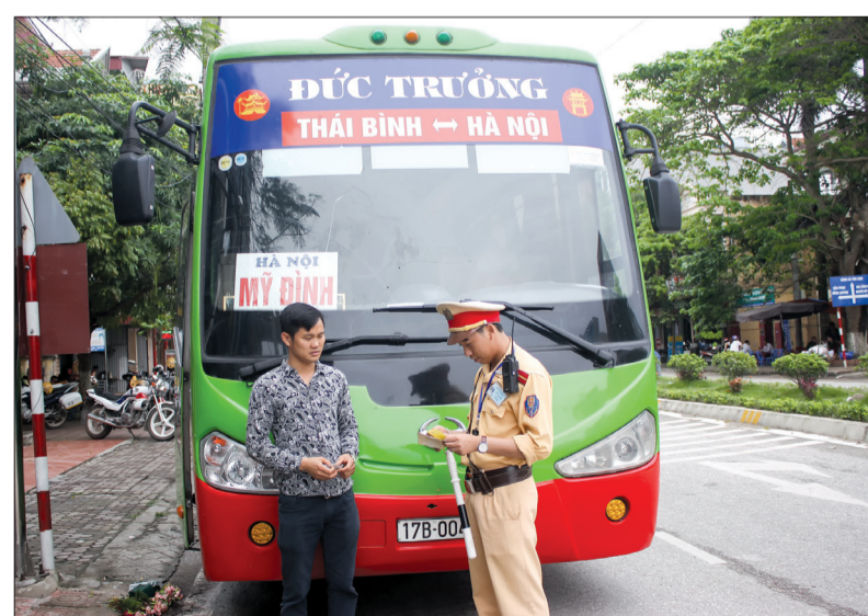
Lực lượng cảnh sát giao thông Công an huyện Thái Thụy tuần tra, kiểm soát bảo đảm trật tự an toàn giao thông trên địa bàn.

Các tổ chức Hội Phụ nữ, Đoàn Thanh niên giữ vai trò nòng cốt tuyên truyền, giáo dục cán bộ, chiến sĩ nâng cao lập trường tư tưởng, tinh thần trách