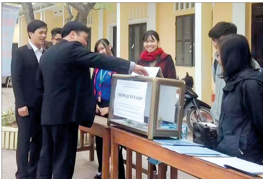
Câu lạc bộ trái tim nhiệt huyết tiếp nhận tiền, quà ủng hộ từ các tổ chức, cá nhân.

Vượt qua giá lạnh của thời tiết, hoạt động thiện nguyện vẫn diễn ra sôi nổi dưới sự tổ chức của các nhóm, câu lạc bộ trong tỉnh. Những món quà, việc làm xuất phát từ tình yêu thương và sự sẻ chia đã làm ấm lòng nhiều người có hoàn cảnh khó khăn.