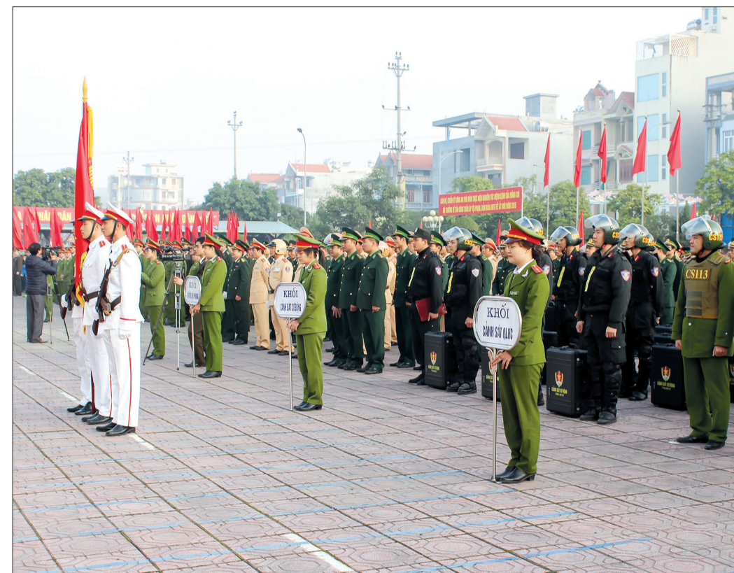
Lực lượng công an ra quân bảo đảm an ninh trật tự tết Nguyên đán.