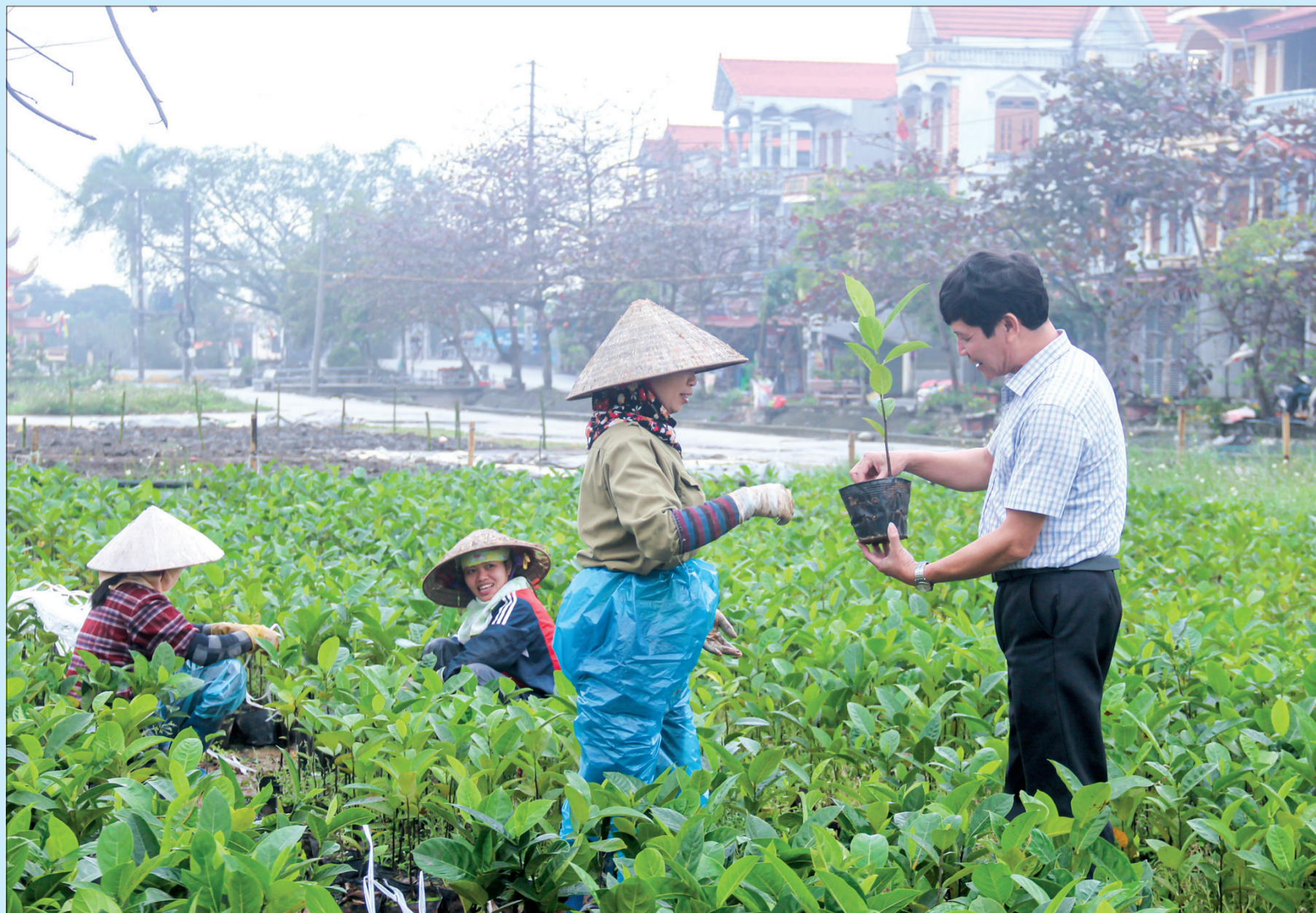
5,3 vạn cây mít dai vàng giống được HTX Bảo tồn và phát triển mít dai vàng Hà Giang (Đồng Hưng) nhân giống từ các cây mít đầu dòng.