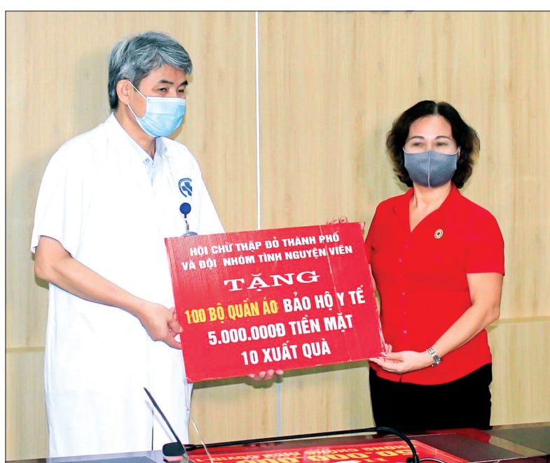
Hội Chữ thập đỏ thành phố Thái Bình hỗ trợ công tác phòng, chống dịch cho Bệnh viện Đa khoa tỉnh.

Bên cạnh phong trào cứu trợ nhân đạo, công tác phòng ngừa, ứng phó thảm họa và