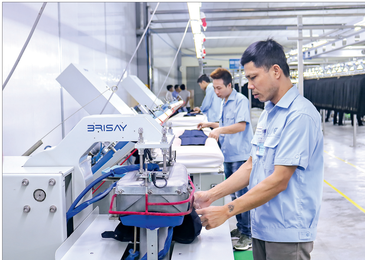
Công nhân Công ty Cổ phần Đô Lương thuộc Tổng công ty Đức Giang (cụm công nghiệp Đô Lương, huyện Đông Hưng) thi đua nâng cao năng suất, chất lượng sản phẩm.

Thực hiện Chỉ thị số 05 của Bộ Chính trị (khóa XII) về đẩy mạnh học tập và làm theo tư tưởng, đạo đức, phong cách Hồ Chí Minh, 3 năm qua, việc học tập và làm theo Bác ở Thái Bình trở thành việc làm thường xuyên, tự giác trong mọi hoạt động của các ngành, địa phương, cơ quan, đơn vị, góp phần thực hiện thắng lợi nhiệm vụ chính trị của tỉnh.