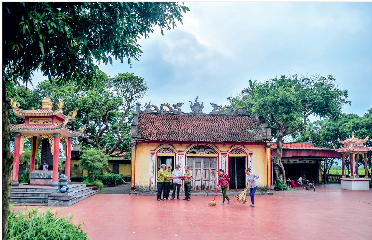
Đền Thái Bảo (thôn Tứ, xã Hồng Việt, huyện Đông Hưng) - di tích lịch sử cấp quốc gia đang xuống cấp nghiêm trọng.