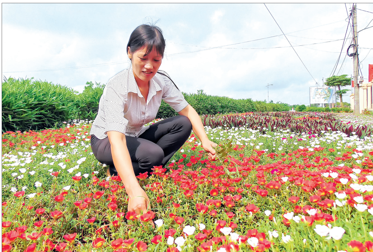
Các bồn hoa, đường hoa của xã Duy Nhất (Vũ Thư) luôn được chị em phụ nữ chăm sóc thường xuyên.

Thời gian qua, Ban Thường vụ Huyện ủy Vũ Thư chỉ đạo các tổ chức cơ sở đảng, các ban, ngành, đoàn thể, cơ quan, đơn vị trong toàn huyện triển khai thực hiện Chỉ thị số 05 của Bộ Chính trị (khóa XII) về đẩy mạnh học tập và làm theo tư tưởng, đạo đức, phong cách Hồ Chí Minh gắn với các phong trào thi đua, đạt hiệu quả thiết thực trên nhiều lĩnh vực.