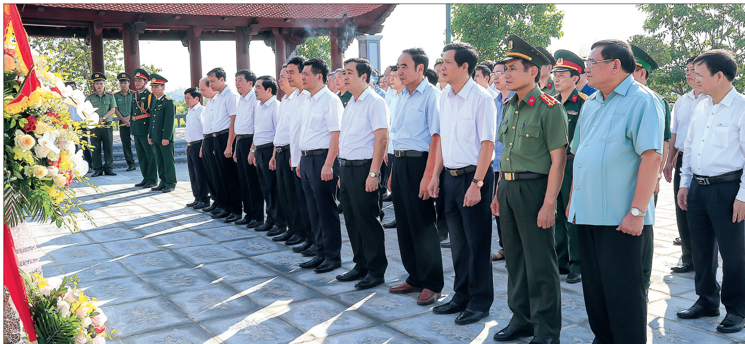
Các đồng chí lãnh đạo tỉnh dâng hương tưởng niệm Chủ tịch Hồ Chí Minh.