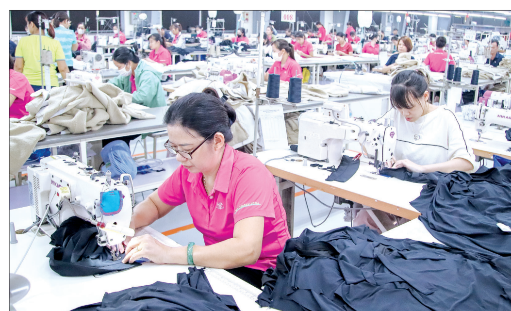
Nữ đoàn viên, người lao động Công ty TNHH Jeil Jersey Vina được sắp xếp công việc phù hợp với tay nghề và độ tuổi.