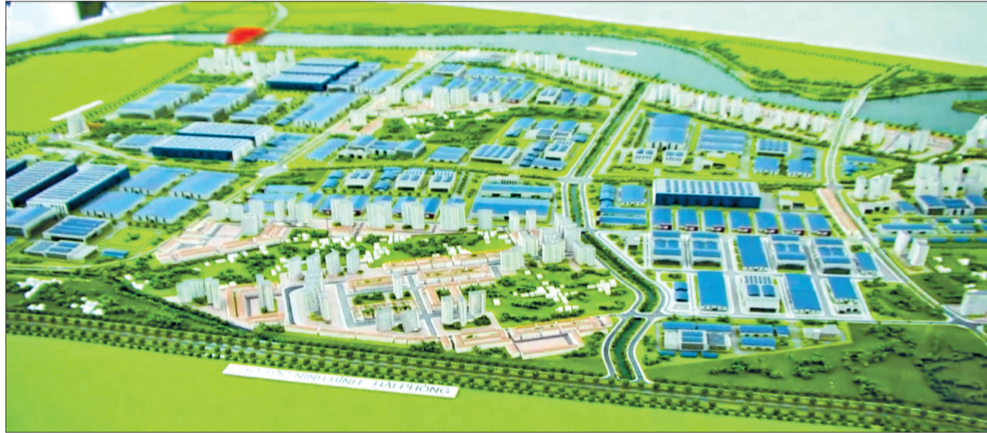
Mô hình khu công nghiệp - đô thị - dịch vụ Liên Hà Thái trong Khu kinh tế Thái Bình.

Nghị quyết Đại hội đại biểu Đảng bộ tỉnh lần thứ XX, nhiệm kỳ 2020 - 2025 xác định một trong ba đột phá là: Tập trung xây dựng đồng bộ kết cấu hạ tầng kinh tế - xã hội, nhất là hạ tầng giao thông kết nối các trục giao thông đầu mối trong tỉnh với các trung tâm kinh tế vùng duyên hải Bắc Bộ; trong đó, tập trung hoàn thành đầu tư xây dựng tuyến đường bộ ven biển và các tuyến đường liên huyện huyết mạch; xây dựng và phát triển Khu kinh tế Thái Bình thành trọng điểm, động lực phát triển kinh tế của tỉnh. Sau những nỗ lực vượt bậc của Đảng bộ và nhân dân Thái Bình, đến nay Nghị quyết đã "đơm hoa kết trái".