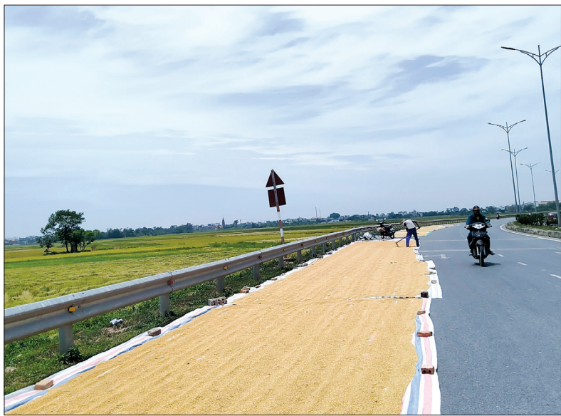
Người dân phơi thóc trên đường vành đai phía Nam đoạn qua xã Vũ Chính và xã Vũ Lạc (thành phố Thái Bình) - ảnh chụp ngày 7/6/2020.