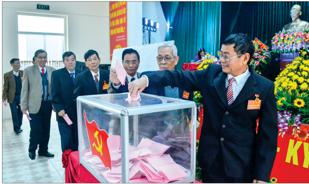
Đại biểu dự Đại hội Đảng bộ phường Trần Lâm (thành phố Thái Bình) bỏ phiếu bầu Ban Chấp hành Đảng bộ phường khóa mới.

Đến thời điểm này, Thành ủy Thái Bình đã có những bước chuẩn bị chu đáo nhằm tổ chức thành công Đại hội Đảng bộ thành phố lần thứ XXVIII, nhiệm kỳ 2020 - 2025. Việc xây dựng văn kiện đại hội, công tác nhân sự Đảng bộ thành phố khóa XXVIII bảo đảm theo đúng kế hoạch.