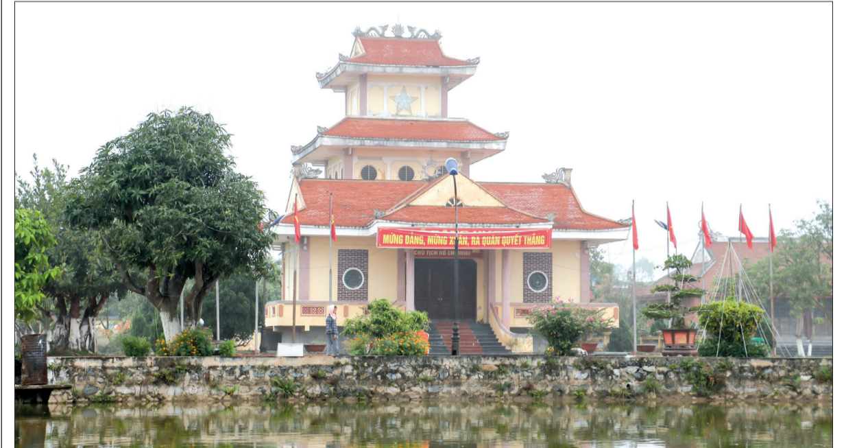
Đến thờ Bác Hồ tại xã Nam Cường (Tiền Hải).

Với thành tích quai đê lấn biển, ngày 26/3/1962, Đảng bộ, chính quyền và nhân dân xã Nam Cường (Tiền Hải) vinh dự được đón Bác Hồ về thăm. 58 năm đã trôi qua, thực hiện những lời căn dặn của Bác, các thế hệ cán bộ, đảng viên và nhân dân xã Nam Cường đã đoàn kết, chung sức đồng lòng vượt qua mọi khó khăn, thử thách, lập nên nhiều kỳ tích, xây dựng Nam Cường thành vùng đất trù phú, ngày càng phát triển.