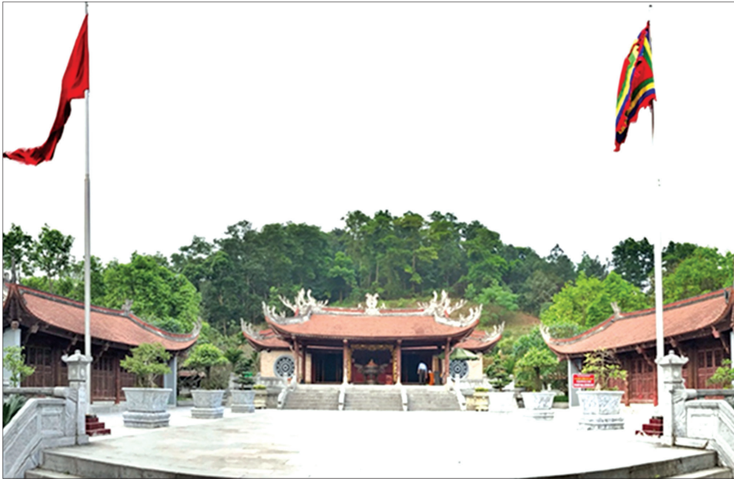
Đền thờ Quốc Tổ Lạc Long Quân tại Núi Sim, xã Chu Hóa, thành phố Việt Trì, tỉnh Phú Thọ.

Sâu thẳm trong tiềm thức mỗi người dân nước Việt, Quốc Tổ Lạc Long Quân và Tổ Mẫu Âu Cơ là khởi nguồn của cộng đồng dân tộc, gắn liền với nghĩa “đồng bào”; các Vua Hùng là những người có công dựng nước, là niềm tự hào, tự tôn dân tộc.