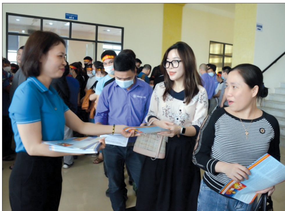
Cán bộ công đoàn phát tờ rơi tuyên truyền về bầu cử cho đoàn viên, người lao động.

công đoàn cấp trên cơ sở và các công đoàn cơ sở phối hợp với chuyên môn đồng cấp bảo đảm các điều kiện thuận lợi để cán bộ, đoàn viên, người lao động tham gia bầu cử. Qua đó phát huy quyền làm chủ của đoàn viên, người lao động