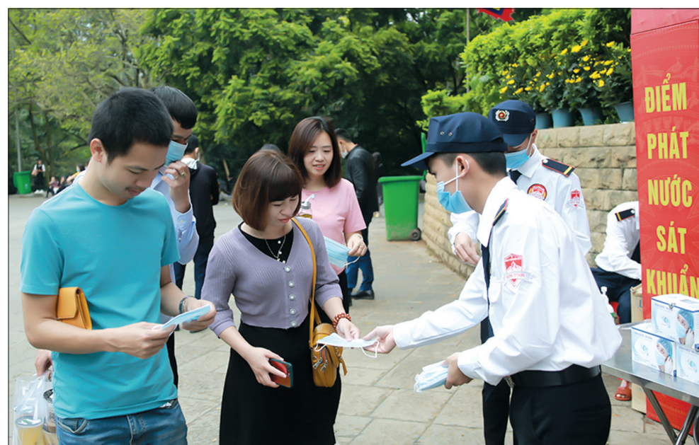
Du khách về hành hương, tham quan được phát khẩu trang miễn phí.