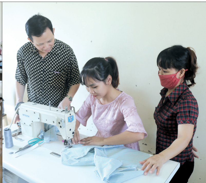
Người khuyết tật học nghề may tại Trung tâm dạy nghề thuộc Hội Bảo trợ người khuyết tật và Bảo vệ quyền trẻ em tỉnh.