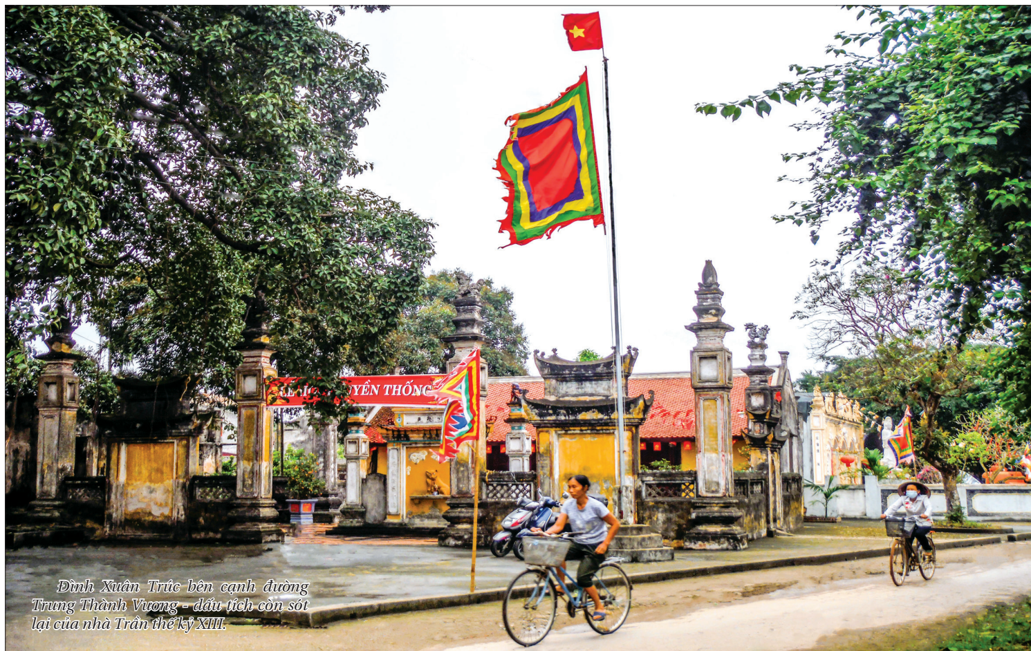
Đình Xuân Trúc bên cạnh đường Trung Thành Vương - dấu tích còn sót lại của nhà Trần thế kỷ XIII.