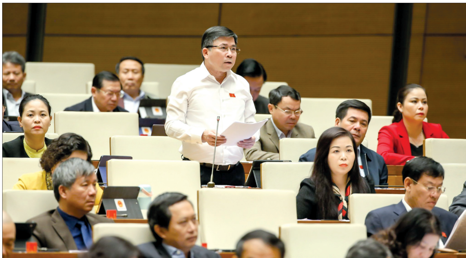
Đại biểu Đoàn đại biểu Quốc hội khóa XIV tỉnh Thái Bình phát biểu tại hội trường.