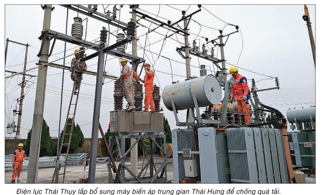
Điện lực Thái Thụy lắp bổ sung máy biến áp trung gian Thái Hưng để chống quá tải.

tại nơi sẽ diễn ra Đại hội; lập phương án dự phòng, bố trí nhân lực trực tại chỗ để xử lý kịp thời khi có sự cố lưới điện trong những ngày diễn ra Đại hội. TRẦN TUẤN