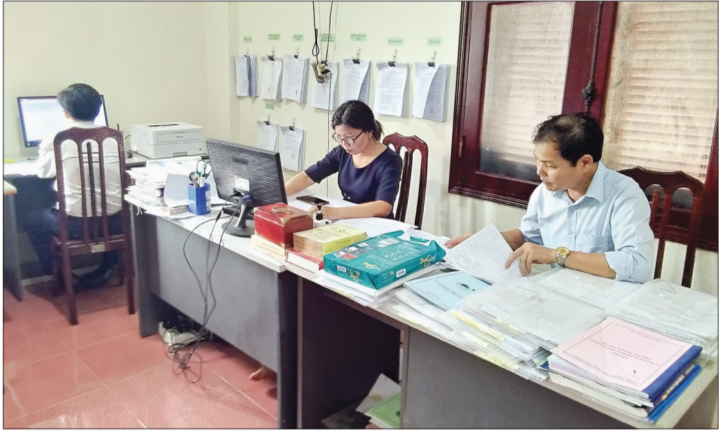
Tổ giúp việc Ban Chỉ đạo huyện Vũ Thu thẩm định danh sách người dân gặp khó khăn do đại dịch Covid-19.

Đến thời điểm này, việc hỗ trợ kinh phí cho người có công, thân nhân người có công gặp khó khăn do đại dịch Covid-19 đã cơ bản hoàn thành. Hiện tại, các huyện, thành phố đang tiếp tục tập trung rà soát, lập danh sách nhóm người lao động, hộ kinh doanh giúp họ sớm nhận được kinh phí hỗ trợ. Hoàn thành hỗ trợ người có công với cách mạng Tại các huyện, thành phố, tính đến ngày 10/5, công tác chỉ trả kinh phí hỗ trợ cho người có công