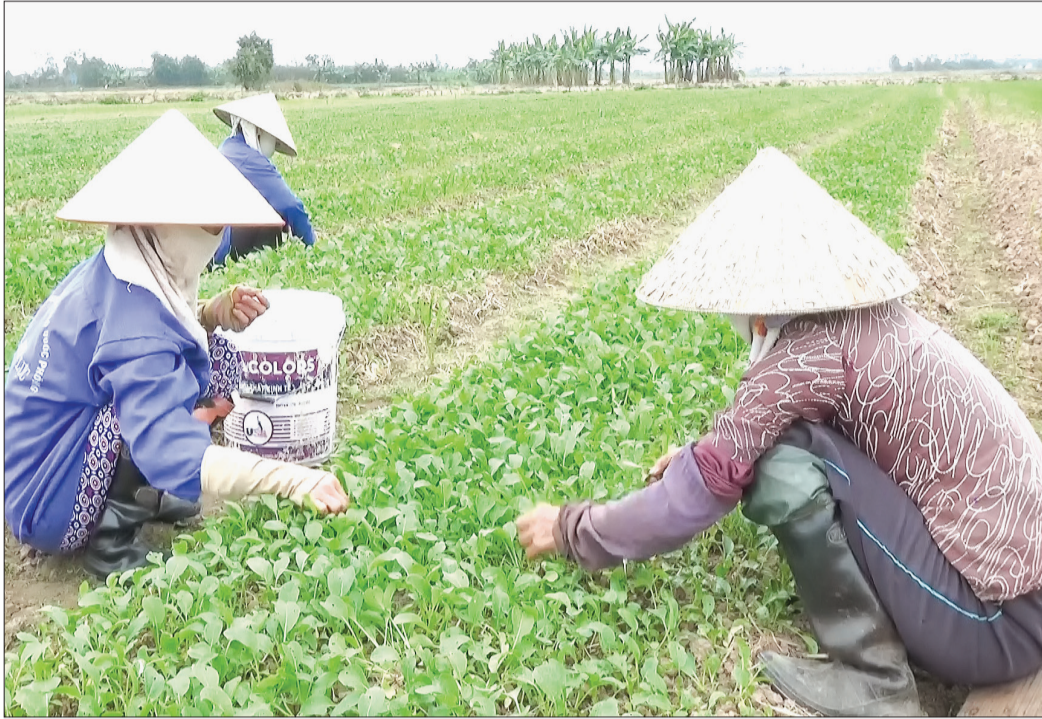
Nông dân Thanh Tân chăm sóc rau màu.

Phần đầu trở thành đô thị loại V vào năm 2020, Thanh Tân (Kiến Xương) đang nỗ lực nâng cao chất lượng các tiêu chí nông thôn mới. Cùng với việc đẩy mạnh chuyển dịch lao động sang ngành nghề, dịch vụ, xã đã có nhiều giải pháp phát triển nông nghiệp theo hướng hiệu quả, bền vững.