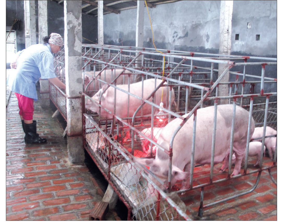
100% gia trại chăn nuôi ở Thanh Tân áp dụng quy trình chăn nuôi VietGAP.