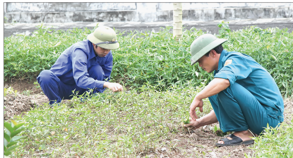
Cán bộ, chiến sĩ Đại đội Kho tăng gia sản xuất tại đơn vị.