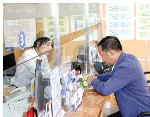
Hoạt động giao dịch ở Ngân hàng Thương mại cổ phần Bưu điện Liên Việt Chi nhánh Thái Bình.

Để huy động tối đa lượng tiền nhàn rỗi trong dân cư, từ đầu năm đến nay, các tổ chức tín dụng trên địa bàn đã chú trọng phát triển các sản phẩm, dịch vụ, đa dạng hóa các loại hình huy động, đổi mới phong cách giao dịch, nâng cao chất lượng phục vụ khách hàng; đồng thời, thực hiện nghiêm ngặt khai thác lãi suất huy động tại trụ sở giao dịch nhằm bảo đảm cạnh tranh lành mạnh giữa các đơn vị trên địa bàn.