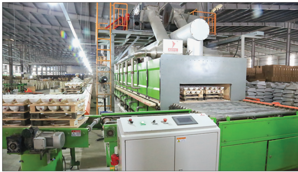
Công ty Sứ Hào Cảnh (khu công nghiệp Tiến Hải).