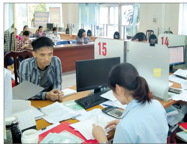
Người lao động làm các thủ tục bảo hiểm thất nghiệp tại Trung tâm Dịch vụ việc làm Thái Bình.

Theo số liệu thống kê của Trung tâm Dịch vụ việc làm Thái Bình, trong 7 tháng đầu năm Trung tâm đã tiếp nhận và làm thủ tục cho 4.750 hồ sơ hưởng trợ cấp thất nghiệp, trong đó có 4.348 hồ sơ đủ điều kiện được Sở Lao động - Thương binh và Xã hội ban hành quyết định hưởng trợ cấp thất nghiệp với tổng số tiền trả trên 56,4 tỷ đồng. Cũng trong 7 tháng, Trung tâm đã tổ chức tư vấn, giới thiệu việc làm cho 4.750 người; hỗ trợ học nghề cho 41 người với tổng số tiền 161 triệu đồng. Việc giải quyết kịp thời trợ cấp thất nghiệp và hỗ trợ học nghề cho người lao động giúp họ có cơ hội sớm tìm được việc làm mới phù hợp.