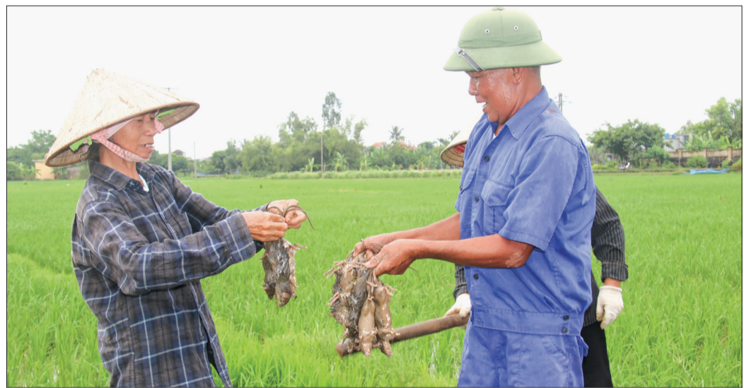
Người dân Đông Hưng bắt được hàng nghìn con chuột trong chiến dịch diệt chuột vừa qua.