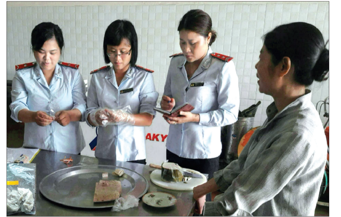
Cán bộ Chi cục Quản lý chất lượng nông lâm sản và thủy sản Thái Bình lấy mẫu giò chả kiểm tra các chỉ số an toàn.

Tăng cường triển khai các cuộc thanh tra, kiểm tra bảo đảm an toàn thực phẩm (ATTP) đã góp phần tích cực nâng cao ý thức của các cơ sở sản xuất, kinh doanh và người dân trong sản xuất, chế biến, cung cấp hàng hóa và sử dụng thực phẩm an toàn, góp phần đáp ứng mong đợi của người dân và bảo vệ quyền lợi của người tiêu dùng.