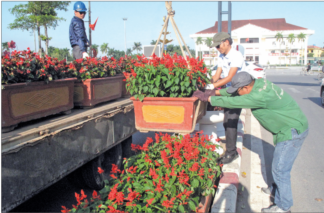
Chinh trang diện mạo đô thị.

Trong tiến trình trở thành đô thị loại I, cùng với các chỉ tiêu phát triển kinh tế - xã hội, nâng cao chất lượng cuộc sống cho người dân, thành phố Thái Bình đặc biệt quan tâm xây dựng đô thị văn minh, hiện đại.