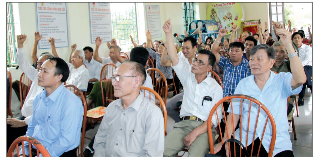
Cử tri thôn Tống Khê, xã Đông Hoàng (Đông Hưng) biểu quyết tín nhiệm đối với các ứng cử viên cử tri trên địa bàn.