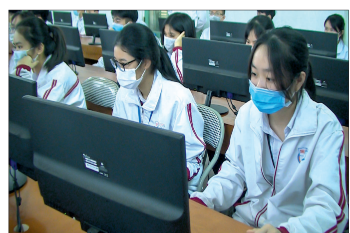
Học sinh các trường THPT tích cực tham gia cuộc thi.

Sau 3 tuần phát động, đợt 1 cuộc thi đã thu hút sự tham gia của cán bộ, đảng viên, học sinh, sinh viên và các tầng lớp nhân dân. Các địa phương, đơn vị có số lượng người, lượt người dự thi đông là thành phố Thái Bình và các huyện Đông Hưng, Vũ Thư, Hưng Hà, Kiến Xương, lực lượng công an. Một số địa phương, đơn vị có phổ điểm cao, nhiều người dự thi trả lời đúng nhiều câu hỏi trắc nghiệm như các huyện: Tiến Hải, Quỳnh Phụ, Thái Thụy và thành phố Thái Bình.