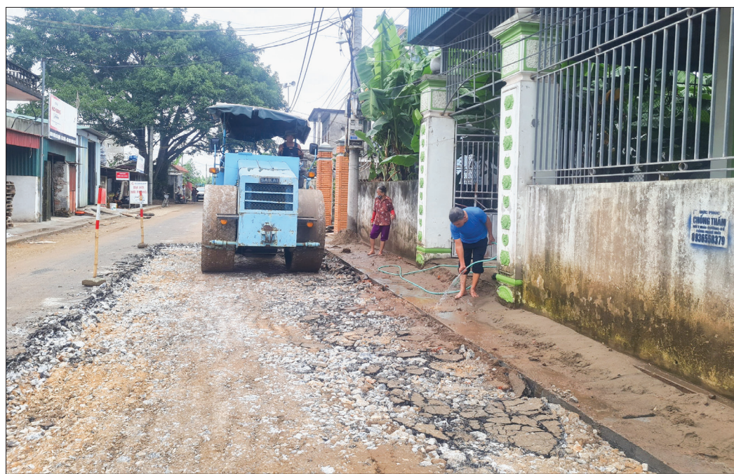
Thi công đường cứu hộ, cứu nạn từ quốc lộ 39 đến đê tả Trà Lý qua xã Trọng Quan.

Thời gian qua, huyện Đông Hưng đã chủ động, quyết liệt, sáng tạo trong lãnh đạo, chỉ đạo, tạo sự đồng thuận của nhân dân trong công tác giải phóng mặt bằng (GPMB). Qua đó tạo thuận lợi thu hút đầu tư, phát triển kinh tế - xã hội.