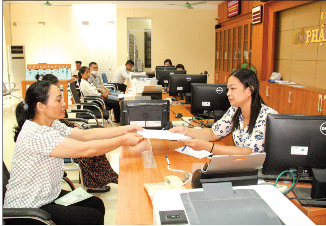
Xây dựng chính quyền số được huyện Hưng Hà thực hiện từ thái độ phục vụ nhân dân của đội ngũ cán bộ.

Trong ảnh: Cán bộ Phòng Lao động - Thương binh và Xã hội huyện tiếp nhận và giải quyết thủ tục hành chính cho người dân tại Bộ phận tiếp nhận và trả kết quả huyện.