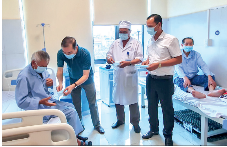
Đại diện Công ty Cổ phần Sản xuất thương mại A1 Á Châu và Công ty Cổ phần Bệnh viện Phước Hải Thái Bình trao khẩu trang kháng khuẩn cho bệnh nhân tại bệnh viện.

Bố trí nhân lực tham gia kiểm soát y tế, ngoài lực lượng công an, quân sự và nhân lực của các huyện, Sở Y tế đã huy động 30 sinh viên Trường Cao đẳng Y tế Thái Bình tham gia hỗ trợ, làm nhiệm vụ đo thân nhiệt, hướng dẫn khai báo y tế. Đây là những sinh viên năm thứ 2, thứ 3 ở các khoa: xét nghiệm, điều dưỡng... Hiện tại, 12 sinh viên đang làm nhiệm vụ đo thân nhiệt, hướng dẫn khai báo y tế tại chốt cầu Triều Dương, cầu La Tiến; 15 sinh viên tại chốt cầu Hiệp và 3 sinh viên dự phòng, sẵn sàng thực hiện nhiệm vụ khi có yêu cầu.