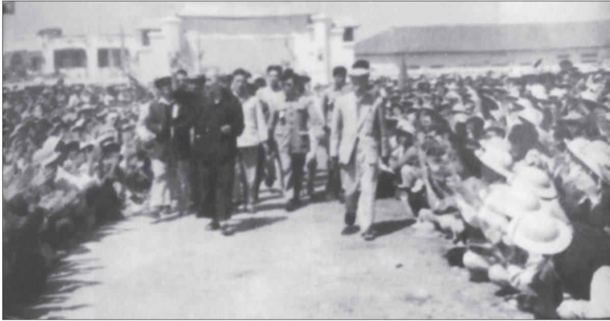
Đại biểu nhân dân Thái Bình dự Đại hội sản xuất Đông - Xuân năm 1958 phấn khởi chào đón Chủ tịch Hồ Chí Minh về thăm, ngày 26/10/1958.

Để làm tốt những việc đó, cần phải thực hiện 6 điểm: