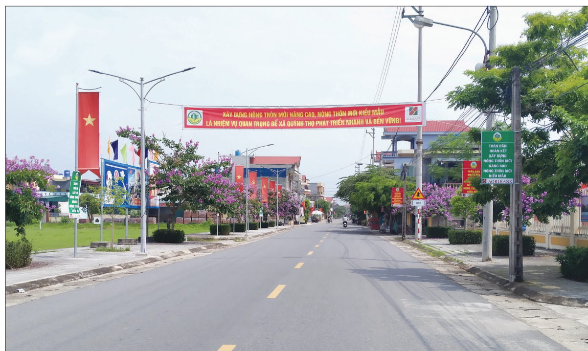
Hệ thống đường giao thông xã Quỳnh Thọ (Quỳnh Phụ) được đầu tư xây dựng đồng bộ.