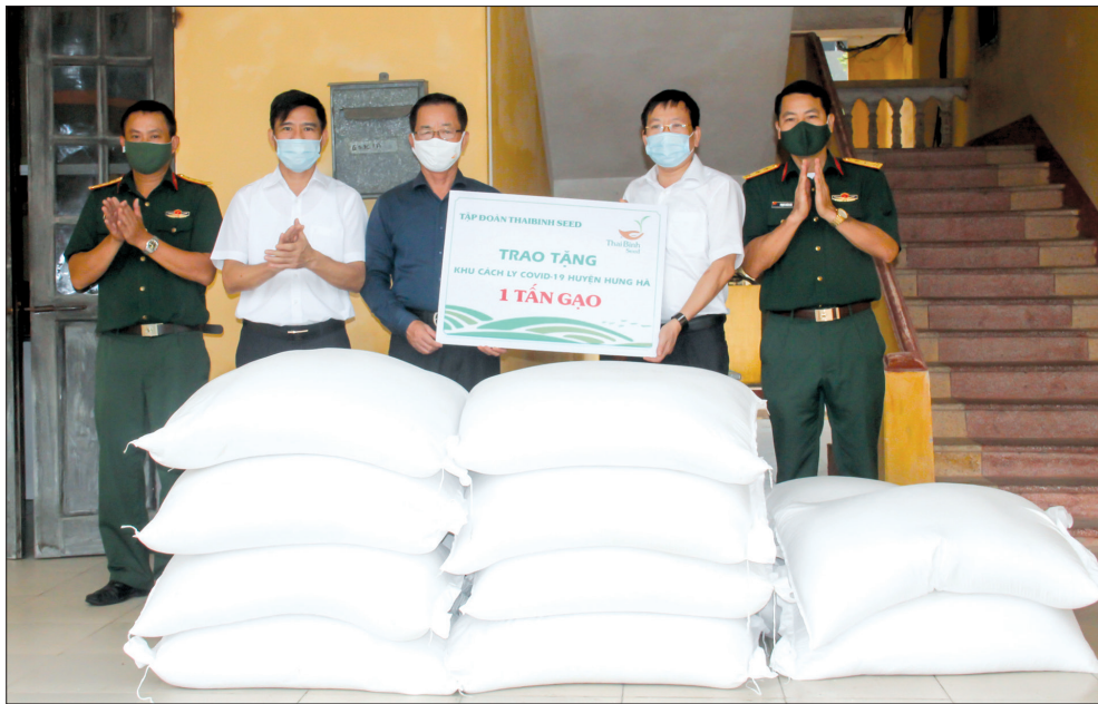
Năm 2021, Công ty Cổ phần Tập đoàn Thai Binh Seed ủng hộ khoảng 2,3 tỷ đồng cho công tác phòng, chống dịch Covid-19.

Mới đây, Thai Binh Seed đã ký kết bản ghi nhớ hợp tác toàn diện với Tập đoàn SATAKE (Nhật Bản) về phát triển ngành hàng lúa gạo ở Việt Nam như một cam kết khẳng định quyết tâm hiện thực hóa chiến lược từng bước vươn ra thị trường nước ngoài, tiếp tục đưa Thai Binh Seed trở thành doanh nghiệp hàng đầu trong ngành giống cây trồng Việt Nam.