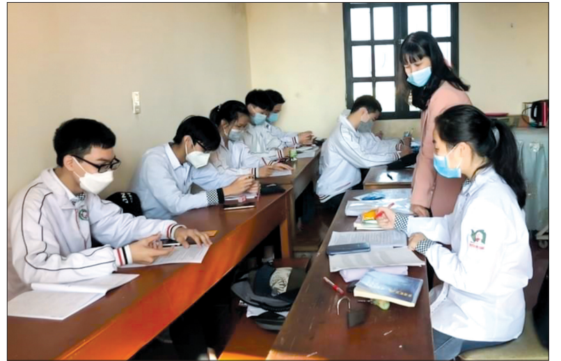
Giờ ôn tập của học sinh đội tuyển Vật lý, Trường THPT Nguyễn Đức Cảnh.

Để bảo đảm công tác phòng, chống dịch Covid-19, kỳ thi diễn ra tại 8 điểm thi tại 8 huyện, thành phố. Buổi sáng, các thí sinh dự thi ở các môn Ngữ văn, Toán, Sinh học, Địa lý và Giáo dục công dân. Buổi chiều, các thí sinh dự thi ở 4 môn còn lại: Vật lý, Hóa học, Lịch sử và Tiếng Anh.