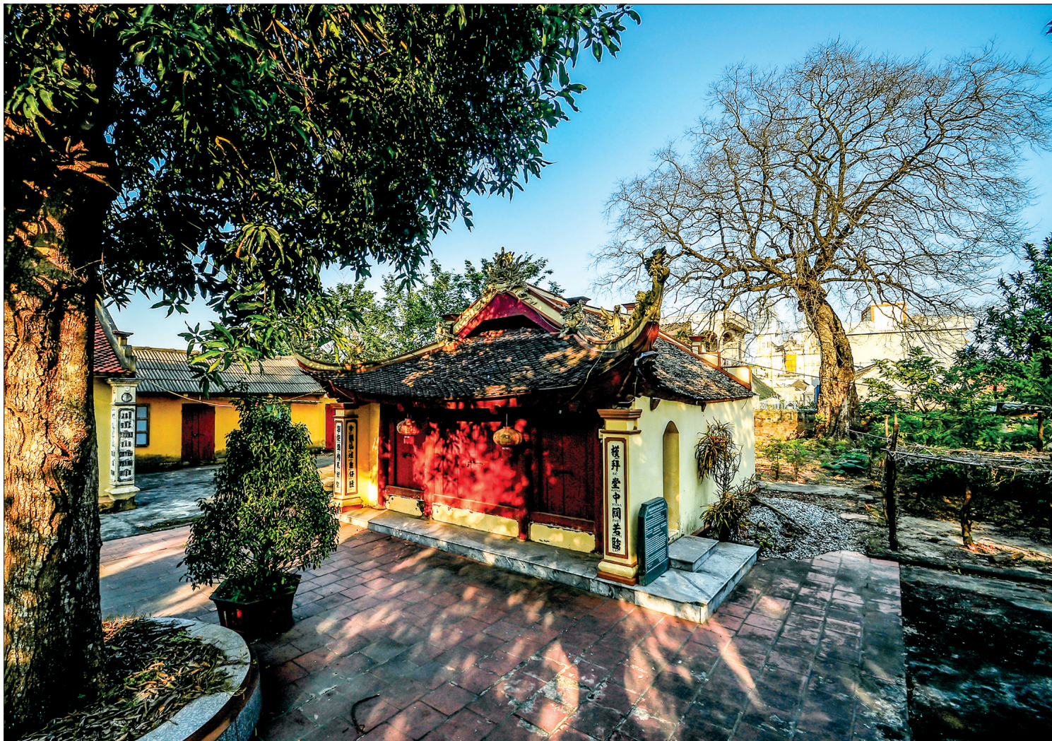
Chùa Công, còn gọi là chùa Đống Lâm, chùa Phụng Công, xã Minh Tân, huyện Hưng Hà - nơi phát lộ trống đồng Đông Sơn năm 2000.

Những năm 2000, không riêng các nhà nghiên cứu văn hóa mà dư luận cũng đặt nhiều dấu hỏi về việc người dân ven sông Hồng thuộc tỉnh Thái Bình đào được 2 chiếc trống đồng Đông Sơn có niên đại hơn 2.000 năm. Những dấu hỏi vẫn chờ các nhà nghiên cứu chứng minh về khảo cổ học ở một tấm rộng lớn hơn về mảnh đất “ven bờ cuối bãi” có phải đã hình thành cách ngày nay hơn 2.000 năm.