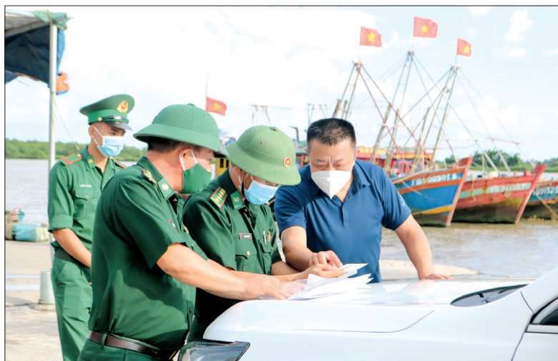
Cán bộ, chiến sĩ Đồn Biên phòng Trà Lý xử lý đối tượng người nước ngoài vi phạm quy chế khu vực biên giới biển.