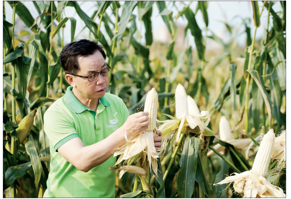
Những giống cây trồng của Thai Binh Seed đã góp phần mang lại những mùa vàng cho người nông dân.

giống Đông Cơ có 56ha đất dành cho sản xuất lúa giống nhưng từ năm 1987 trở về trước, mỗi năm chỉ được giao sản xuất 60 tấn lúa giống, nghĩa là mỗi năm mỗi héc-ta đất chỉ làm ra khoảng 1,1 tấn lúa giống, trong khi hơn 20 năm trước (1966), Thái Bình đã là quê hương 5 tấn. Khi được phân công phụ trách trại Đông Cơ, ước muốn tạo được những giống lúa có năng suất cao, có chất lượng tốt, xác lập được thương hiệu giống Việt Nam trên