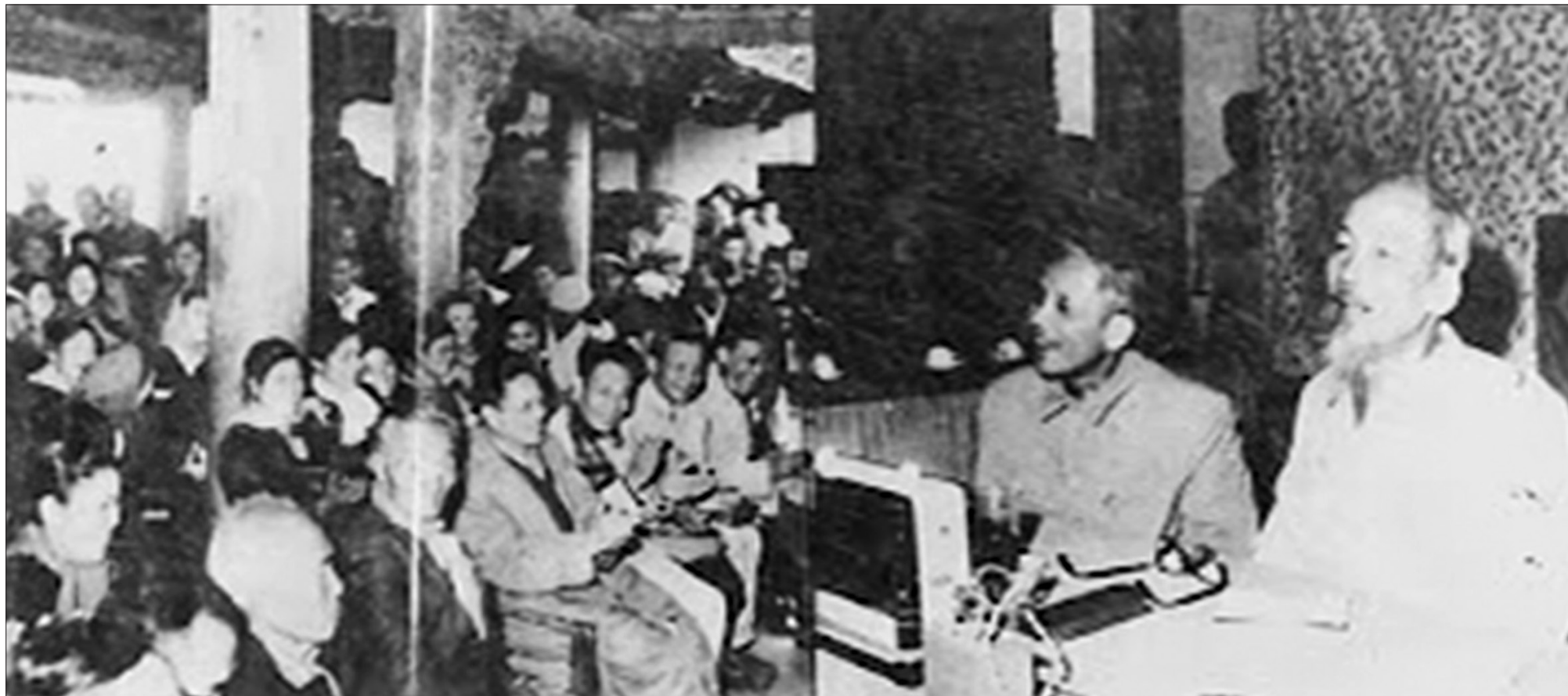
Bác Hồ nói chuyện với cán bộ, nhân dân tỉnh Thái Bình tại đình Phương Cáp, xã Hiệp Hòa (Vũ Thư), ngày 1/1/1967.