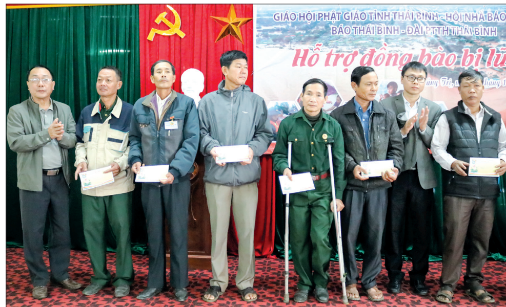
Lãnh đạo Báo Thái Bình, Đài Phát thanh và Truyền hình Thái Bình trao quà cho người dân vùng lũ tỉnh Quảng Trị, tháng 11/2020. Ảnh tư liệu

Với những người làm Báo Thái Bình, ngoài trách nhiệm truyền tải thông tin, họ còn luôn hăng say và sẵn sàng với công tác xã hội để trợ giúp những hoàn cảnh khó khăn, những mảnh đời không may mắn. Niềm vui, sự đổi thay trong cuộc sống của những hoàn cảnh khó khăn luôn là động lực to lớn để đội ngũ cán bộ, phóng viên Báo Thái Bình cùng các nhà hảo tâm tiếp tục vững bước trên hành trình thiện nguyện, viết tiếp những ước mơ còn dang dở của những “chiếc lá chưa lành”, làm cầu nối yêu thương đến mọi người, mọi nhà.