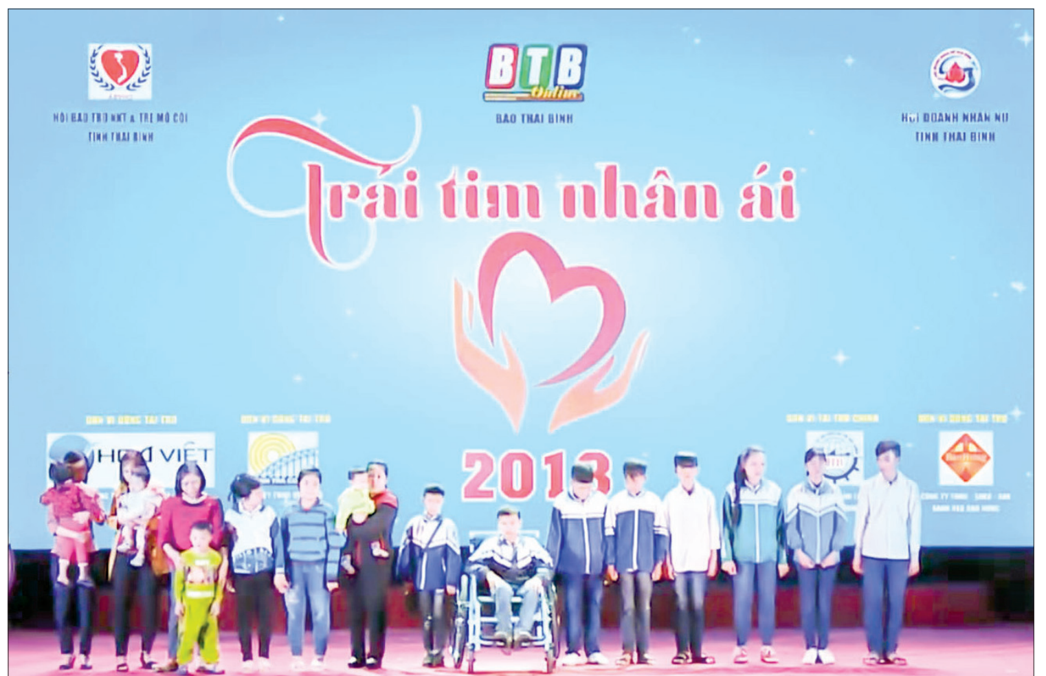
Chương trình “Trái tim nhân ái” đã nhận được sự quan tâm đặc biệt của cán bộ, nhân dân, đồng thời tạo hiệu ứng lan tỏa, góp phần kêu gọi các cơ quan, đơn vị, doanh nghiệp, tổ chức, nhà hảo tâm trong và ngoài tỉnh sẽ chia sẻ với những mảnh đời không may mắn. Ảnh tư liệu