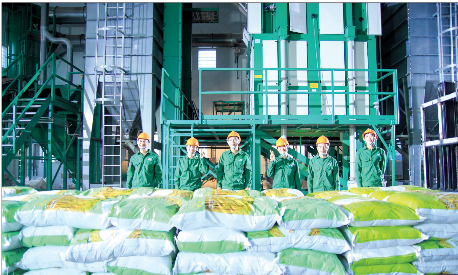
Để phục vụ sản xuất vụ xuân năm 2022, Thai Binh Seed cung cấp ra thị trường trên 10.000 tấn lúa giống.