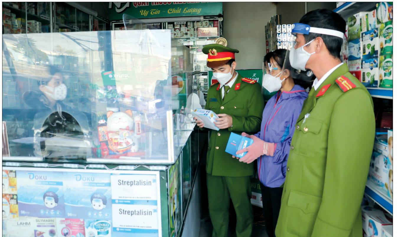
Công an xã Đông Mỹ (thành phố Thái Bình) phối hợp kiểm tra công tác phòng, chống dịch Covid-19 tại địa bàn.