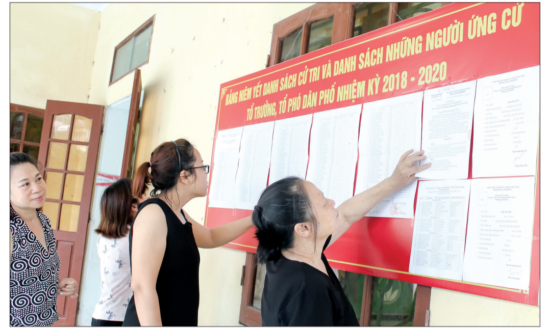
Cử tri khu vực bỏ phiếu tổ dân phố Minh Tân I, thị trấn Vũ Thư xem danh sách cử tri niêm yết tại hội trường tổ dân phố.