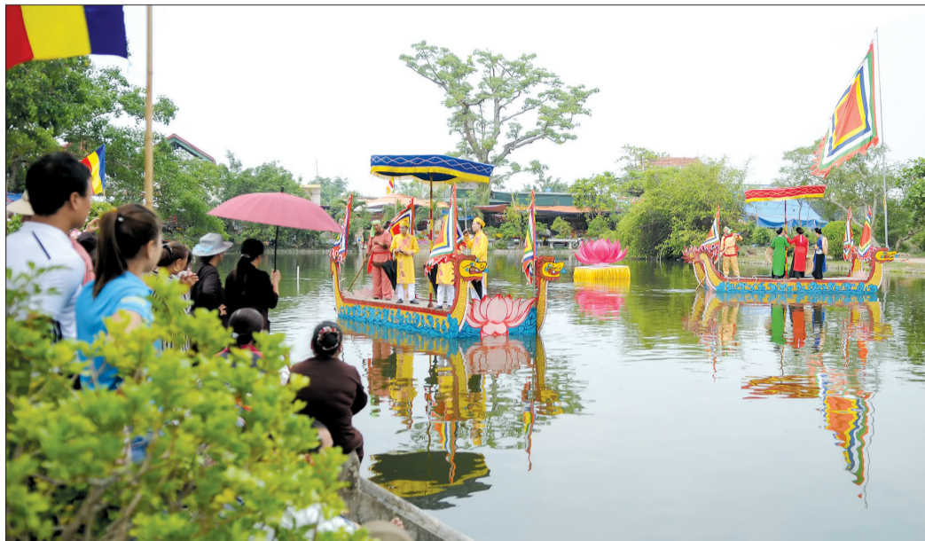
Du thuyền hát hội tại lễ hội chùa Keo.