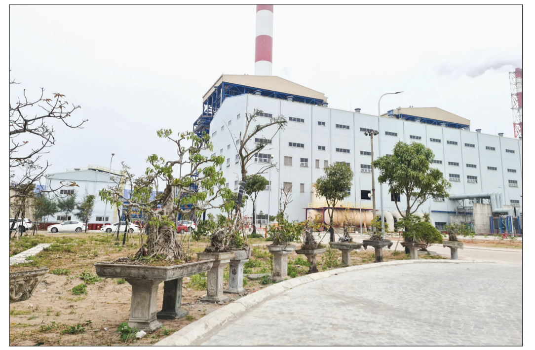
Nhà máy nhiệt điện Thái Bình 2 không chỉ hồi sinh hoạt động mà còn xanh những hàng cây bảo vệ môi trường.

Quyết tâm sớm đưa dự án đi vào hoạt động, Tập đoàn Dầu khí Việt Nam đã phát động chiến dịch 500 ngày đêm từ ngày phát điện thương mại và lắp đặt đồng hồ đếm ngược để tất cả các lực lượng làm việc trên công trường cùng chung một ý chí thi đua về đích. Đặc biệt, Tập đoàn đã nhanh chóng tái cấu trúc bộ máy và rà soát, cải thiện hệ thống quy trình, kịp thời bổ sung nhân lực chất lượng, uy tín, kinh nghiệm để quản lý, điều hành, triển khai dự án. Tập đoàn phối hợp chặt chẽ với các bộ, ngành chức năng nghiên cứu, xây dựng các cơ chế phù hợp theo quy định của pháp luật để khơi thông dòng tiền cho nhà thầu, đáp ứng tiến độ dự án.