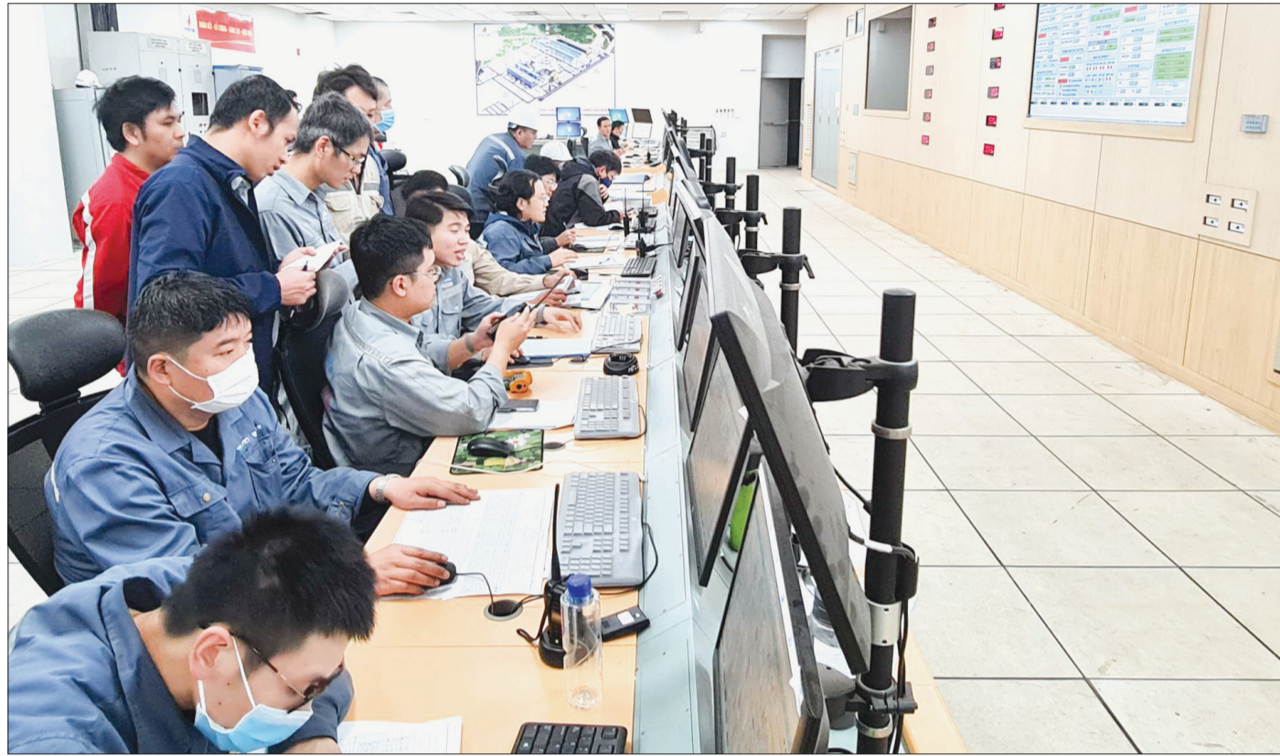
Các kỹ sư làm việc tại trung tâm điều khiển vận hành Nhà máy nhiệt điện Thái Bình 2.

Nhà máy nhiệt điện (NMNĐ) Thái Bình 2 hoàn thành đầu tư và đi vào phát điện thương mại là thông tin làm nức lòng cán bộ, người dân Thái Bình cũng như cán bộ, kỹ sư của Tập đoàn Dầu khí Việt Nam bởi đã có lúc dự án trọng điểm quốc gia này đóng băng, tưởng chừng chết yểu nhưng sau đó đã hồi sinh một cách thần kỳ.