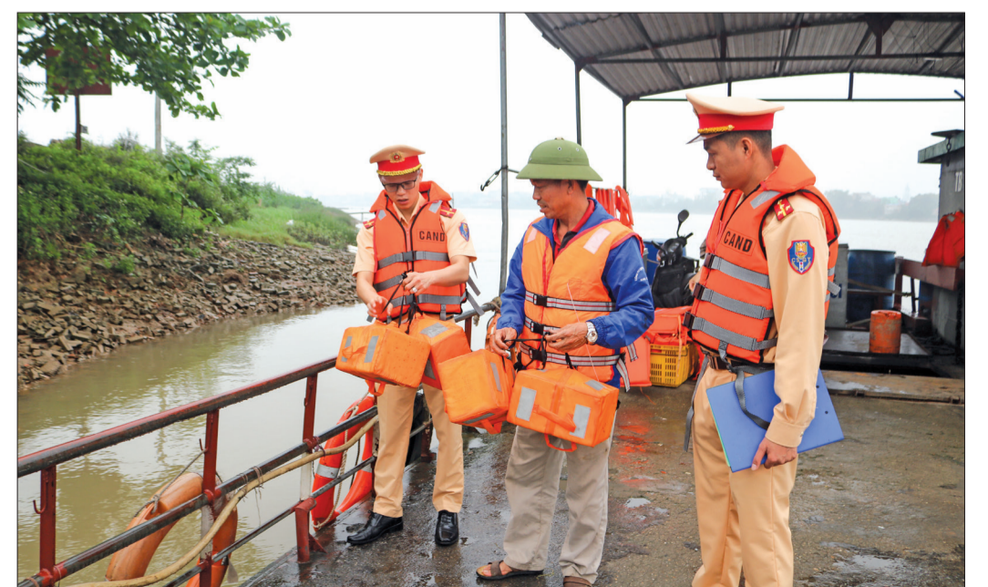
Lực lượng cảnh sát giao thông đường thủy tăng cường kiểm tra bảo đảm an toàn phương tiện tại các tuyến đò, phà chở khách ngang sông.